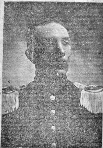
Teniente Coronel Nestor Montes

Primer Comandante del Batallón Loa 4° de Línea