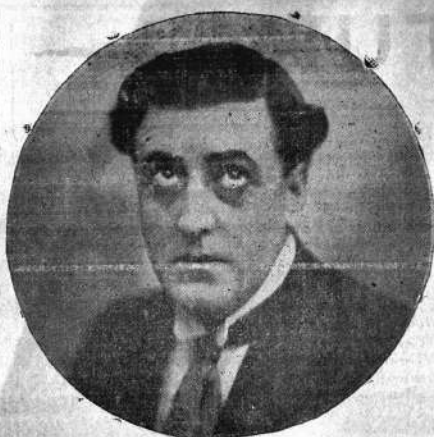
Virginia Fabregas, primera actriz

—Desarrollo y estado económico-financiero de las líneas