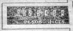
Recibo del Comerciante

Estas ruedas sumadoras deben mostrar la suma de los importes de los recibos dados á los clientes.