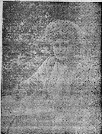
Mrs. Pankhurst, Generala DE LAS SUFRAGISTAS

falsas. La pretensión que hacen la «Asociación Carnegie» de Bolivia y otras repúblicas análogas, hace pensar que toda esa gran obra de conciliación internacional, no constituye una verdad total.