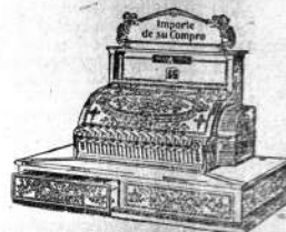
Recibo del Cliente