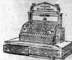
Recibo del Cliente