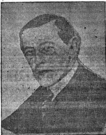
Mr. Woodrow Wilson

Presidente de EE. UU. quien se opone a la reunión del Congreso Mejicano.