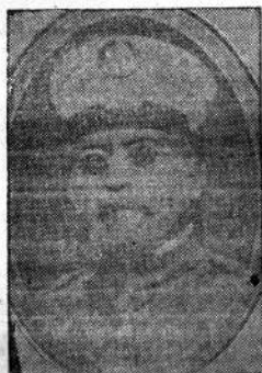
General Victoriano Huerta

Presidente de EE. UU. quien se opone a la reunión del Congreso Mejicano.