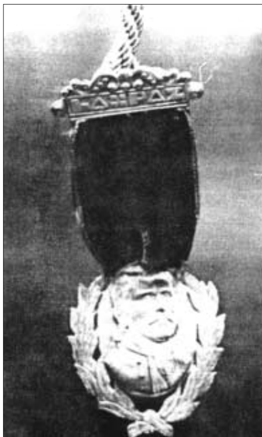
Medalla "Prócer Pedro Domingo Murillo"

En febrero de 1979 el gobierno nacional confirió al Banco la más alta condecoración del país, el "Cóndor de los Andes" en el grado de Oficial, como justo reconocimiento a la labor realizada por la institución en 50 años de vida al servicio de la comunidad.