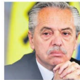
El expresidente Fernández

"(Después de la reunión de Alaska) nos reuniremos con el presidente Putin, el presidente Zelenski y yo, y quizás traigamos a algunos líderes europeos, o quizás no. No lo sé", explicó ante la prensa en la Casa Blanca.