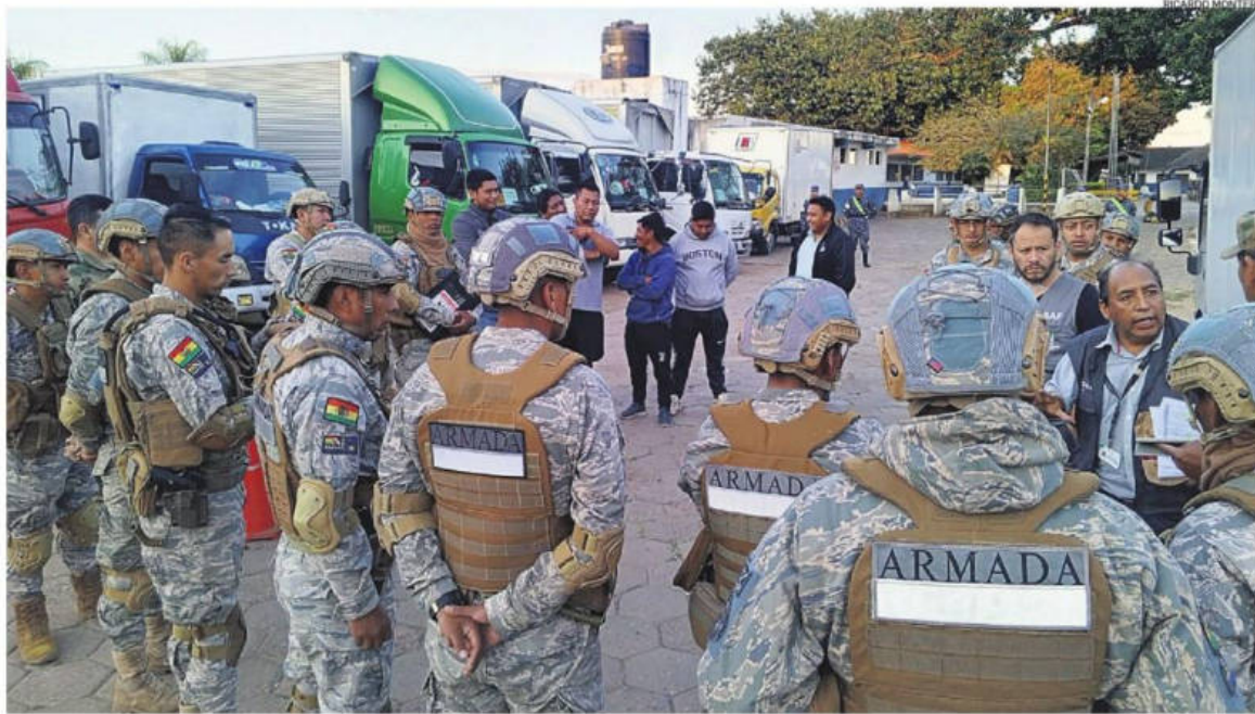
Militares de las Fuerzas Armadas junto a funcionarios del TED, a punto de partir a las provincias cruceñas para llevar las maletas electorales

LAS FF AA Y POLICÍA COADYUVAN CON EL ÓRGANO ELECTORAL