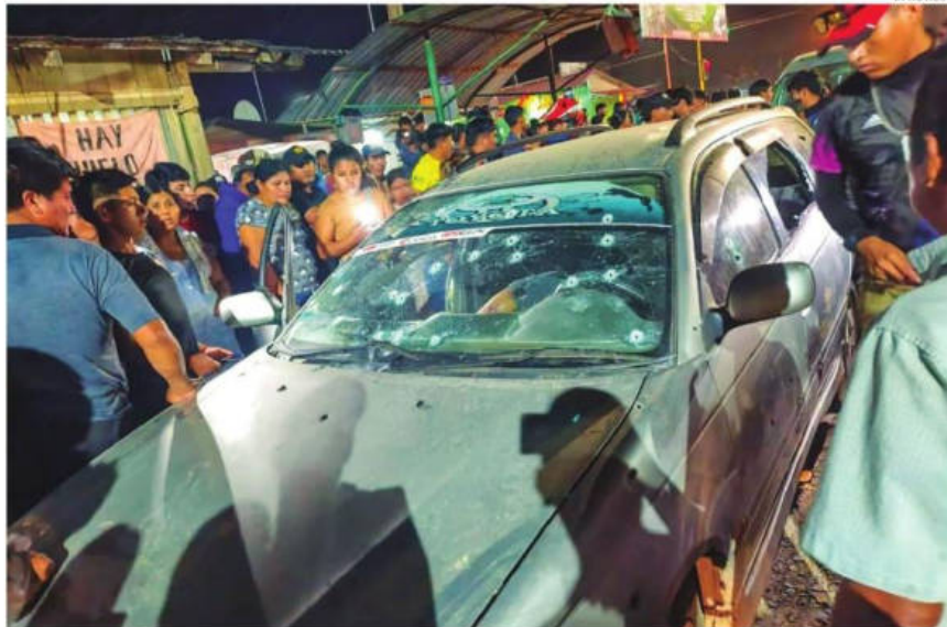
El vehículo en el que dos hombres fueron baleados en Cochabamba

También se desconoce si existe relación entre las dos víctimas, el primero fue identificado como