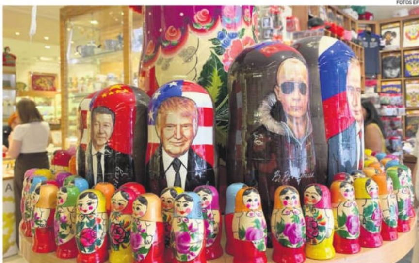
Figuras de Putin y Trump abundan en una tienda de recuerdos en el centro de la capital moscovita

"Este es un momento que puede definir su legado. Si Trump se mantiene firme e insiste en un alto el fuego antes de que haya conversaciones (de paz), que en las conversaciones se incluya a los socios europeos y contenga garantías puede obtener algo que le valga el No-