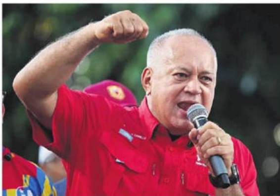
El ministro del Interior y Justicia venezolano Diosdado Cabello

Asimismo, aseguró que el territorio venezolano está libre de producción de drogas y negó que sea un paso de distribución, al tiempo