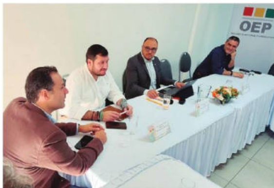
La reunión de los cívicos y el TSE, en instalaciones del Serecí

como "la elección más importante en 200 años de historia de Bolivia".