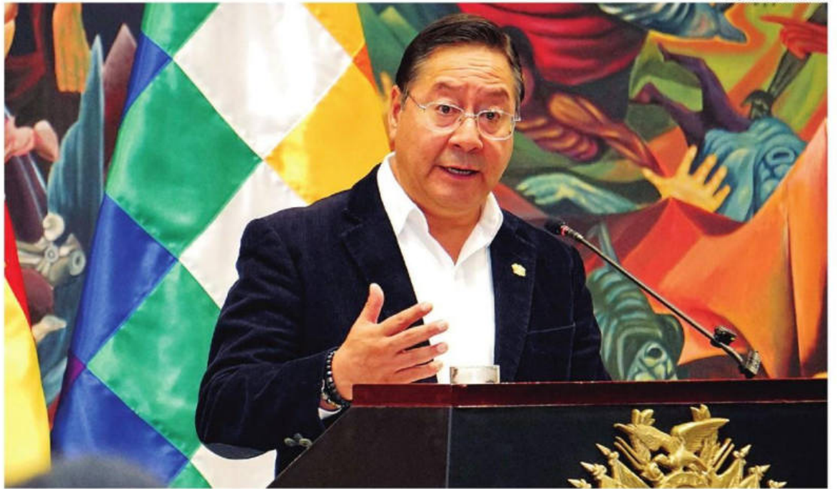
El Presidente del Estado Plurinacional ratificó el carácter democrático de su gobierno y reafirmó una transición democrática con quien gane

Por otro lado, en una reunión que fue calificada como "fructífera" por ambas partes, el Comité pro Santa Cruz y el TSE intercambiaron criterios y revisaron el estado de preparación para las elecciones generales de este domingo. El encuentro, que se desarrolló en la capital cruceña, estuvo marcado por llamados a la transparencia, advertencias sobre la necesidad de control político en las mesas de votación y un tono de urgencia ante lo que los cívicos calificaron