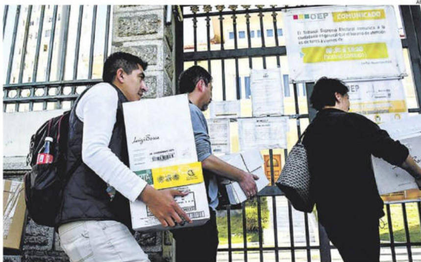
Delegados de los partidos políticos llegan al TSE con las listas de sus candidatos, Fue en mayo

La actividad número 55 del Calendario Electoral señala que del 3 al 13 de agosto se abre el “periodo excepcional de inha-