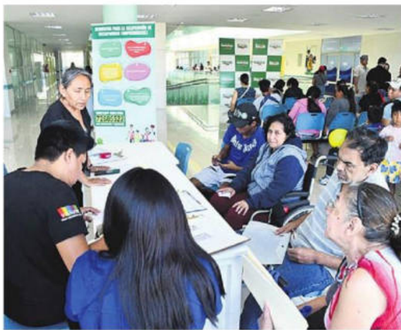
El personal destacó la respuesta de la gente a la cruzada

La respuesta fue positiva desde el primer día. Personas de distintas edades en sillas de ruedas y niños cargados en brazos llegaron desde temprano y aguardaron