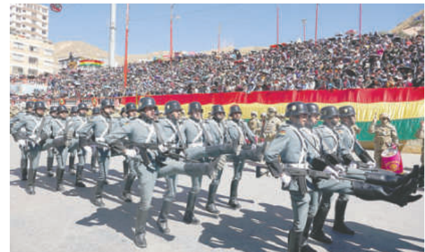
Con gallardía, unidades militares demostraron su fervor cívico