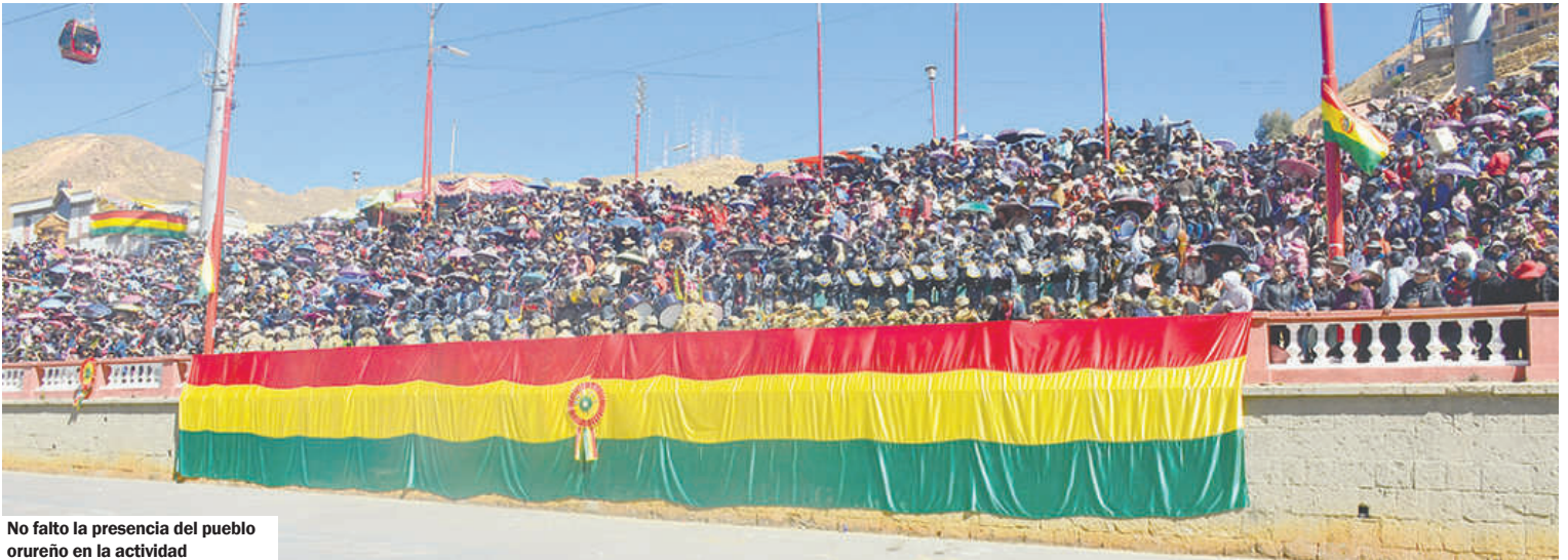
No faltó la presencia del pueblo orureño en la actividad