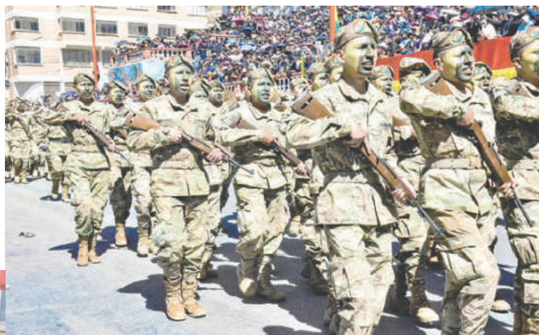
Premilitares deslumbraron con su participación