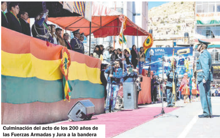
Culminación del acto de los 200 años de las Fuerzas Armadas y Jura a la bandera