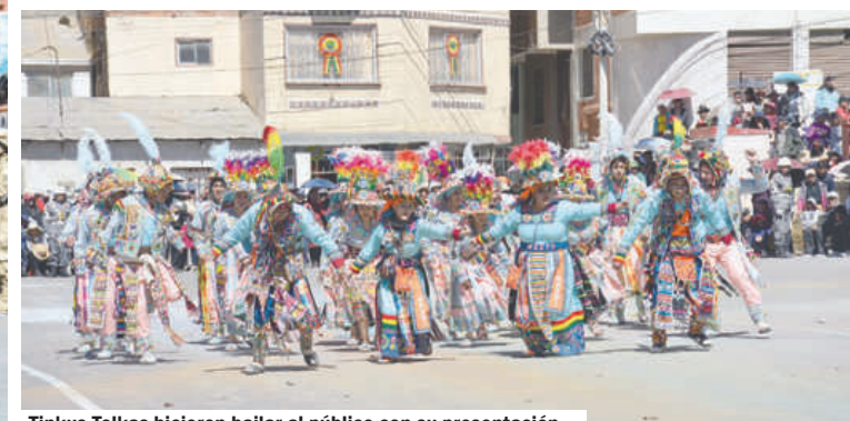
Tinkus Tolkas hicieron bailar al público con su presentación