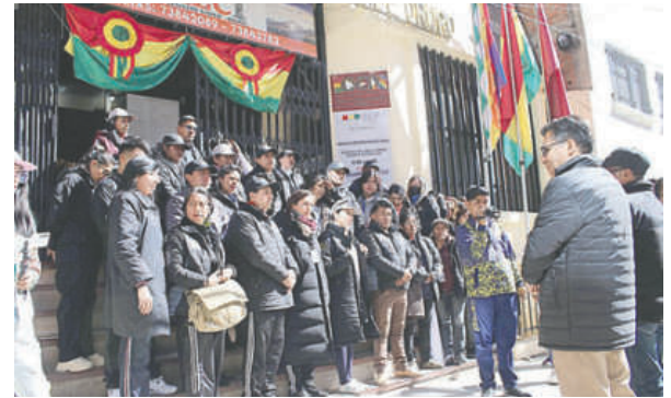
Brigadas de capacitación electoral listas para instruir a jurados en provincia

Se conoce que las autoridades originarias de regiones fronte-