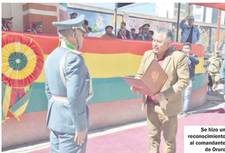
Se hizo un reconocimiento al comandante de Oruro