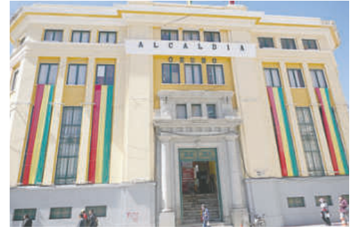
A la fecha, el GAMO recaudó más de Bs.114 millones

El 31 de julio venció el segundo periodo de pago con un descuento del 10% en inmuebles y vehículos y a partir de agosto, el descuento es del 5%. Instó a los contribuyentes a aprovechar