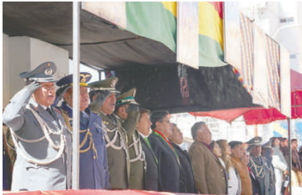
Autoridades presenciaron la solemne jura a la bandera y la Parada Militar

merece Fuerzas Armadas modernas, eficaces y al servicio del desarrollo integral del Estado", concluyó.