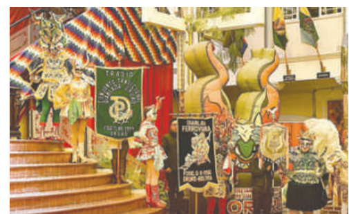
Carnaval podría generar economía creativa todo el año

"Tenemos que pensar en que no solo podemos hacer artesanías, no solo se puede danzar, no solo se