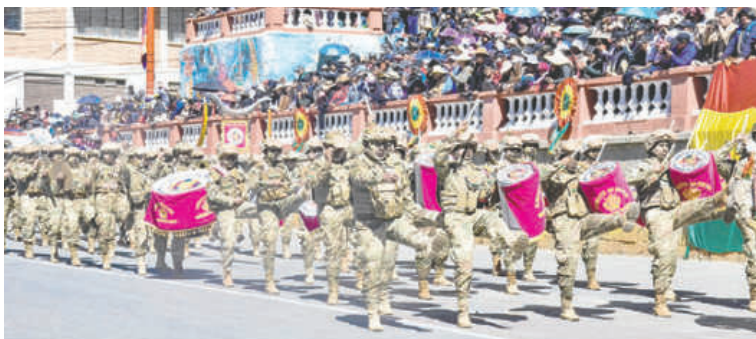
Banda militar de música acompañó en todo el acto con patriotismo