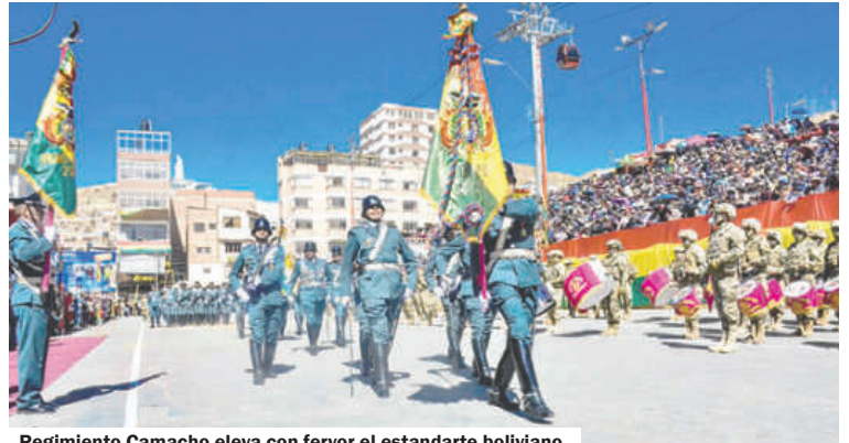
Regimiento Camacho eleva con fervor el estandarte boliviano