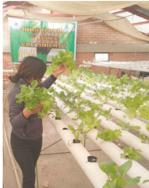
Cosecha de acelga y lechuga hidropónica lista para la comercialización

tos hidropónicos se caracterizan por ser más limpios, frescos y nutritivos que los cultivos tradicionales, además de ofrecer ventajas en su producción como un menor consumo de agua y espacio, además