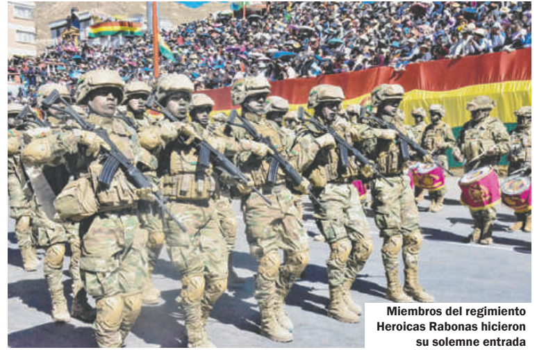
Miembros del regimiento Heroicas Rabonas hicieron su solemne entrada