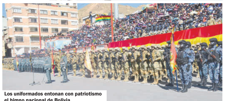
Los uniformados entonan con patriotismo el himno nacional de Bolivia