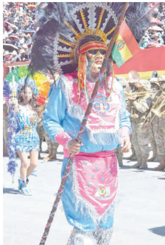
Toba impactó con su vestuario colorido