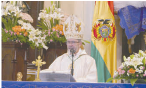
Obispo de la Diócesis de Oruro, Monseñor Cristóbal Bialasik

Durante la celebración de los 200 años de independencia boliviana, el Obispo pidió a toda la familia boliviana seguir unidos para buscar mejores días para la patria, dejando de lado la soberbia o el egoísmo y que realmente se busque el bien de la casa común. "Felicidades Bolivia,