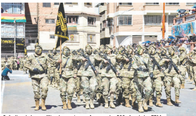
Señoritas de la premilitar demuestran su fervor en los 200 años de las FFAA