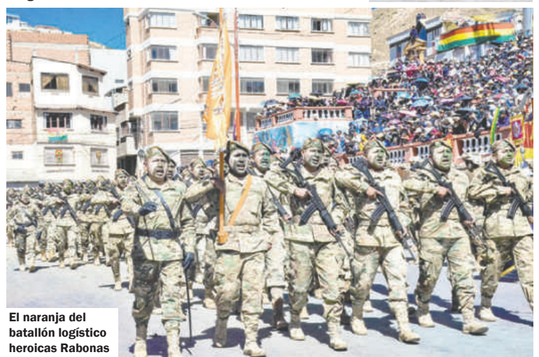
El naranja del batallón logístico heroicas Rabonas