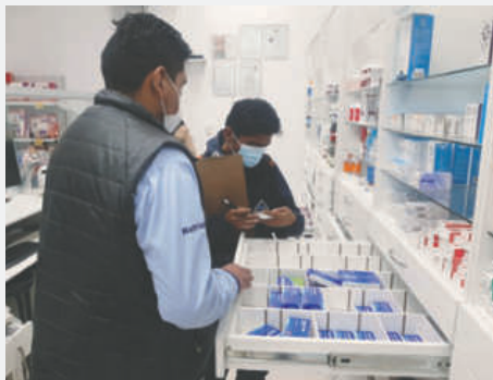
Operativos en farmacias se intensifican