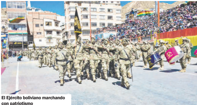
El Ejército boliviano marchando con patriotismo