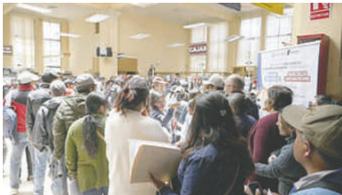
Ciudadanos acceden a los descuentos en el pago de impuestos / LA PATRIA

El Gobierno Autónomo Municipal de Oruro (GAMO) reportó una recaudación de más de 114 millones de bolivianos, alcanzando un 54,86% de la meta programada para la gestión 2025.