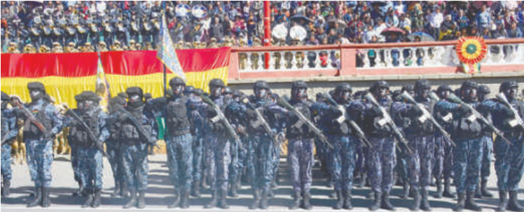
Fuerza Aérea brilló con su impecable uniforme