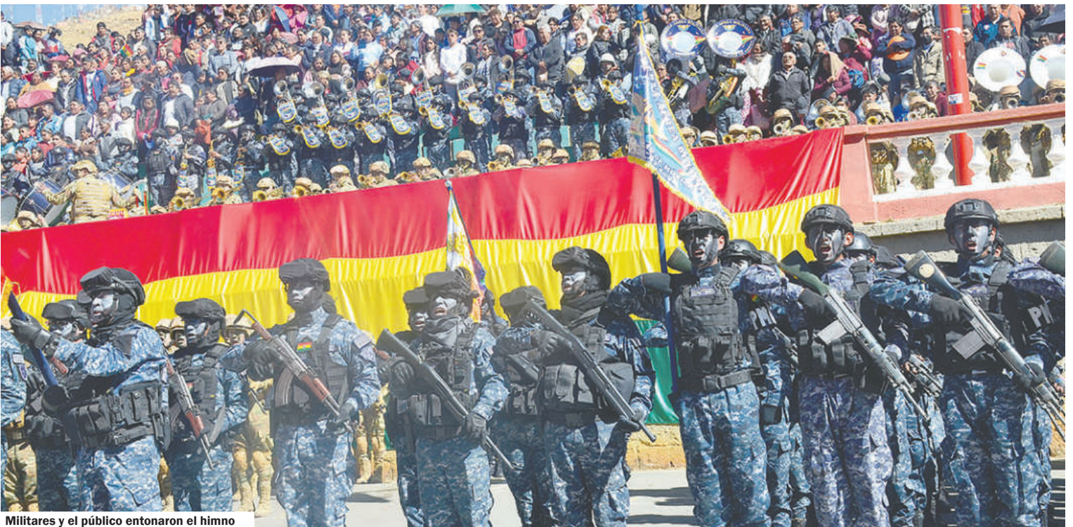
Militares y el público entonaron el himno