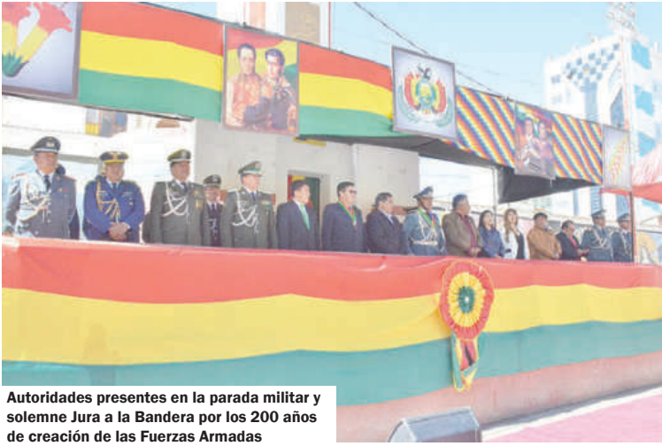
Autoridades presentes en la parada militar y solemne Jura a la Bandera por los 200 años de creación de las Fuerzas Armadas