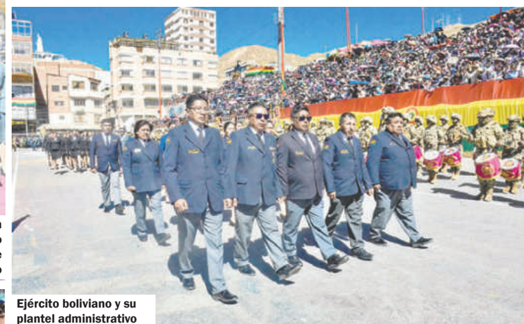
Ejército boliviano y su plantel administrativo