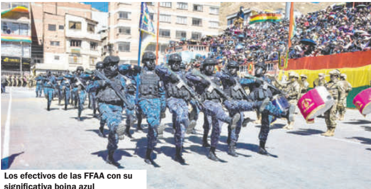
Los efectivos de las FFAA con su significativa boina azul