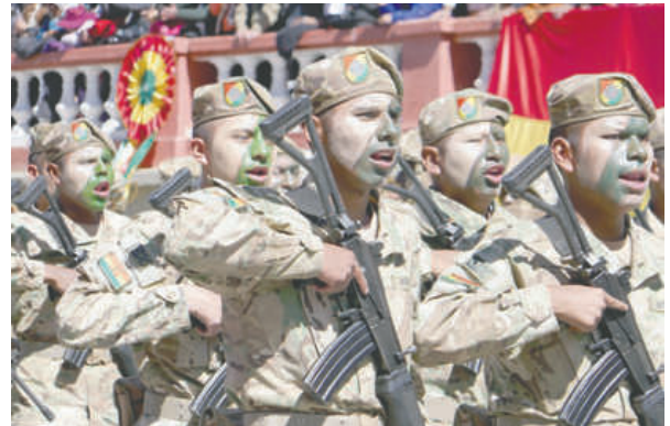
Premilitares demostraron su civismo y patriotismo

A su vez, resaltó la importancia de fortalecer las capacidades de las Fuerzas Armadas con equipamiento, tecnología y preparación táctica. "Bolivia