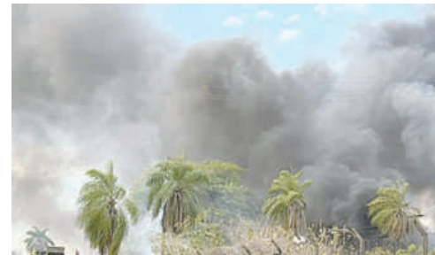
La emergencia provocó intenso humo

Cerca de las 17:30 horas, se informó que uno de los hidrantes de la zona no funcionaba. Unos minutos después se logró hacer la conexión y hasta las 18:30 horas reportaron que el fuego fue contro-