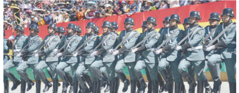
Regimiento de Artillería 1 "Gral. Eliodoro Camacho" en el cuadro de honor