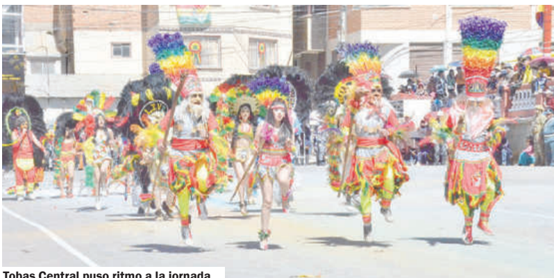
Tobas Central puso ritmo a la jornada