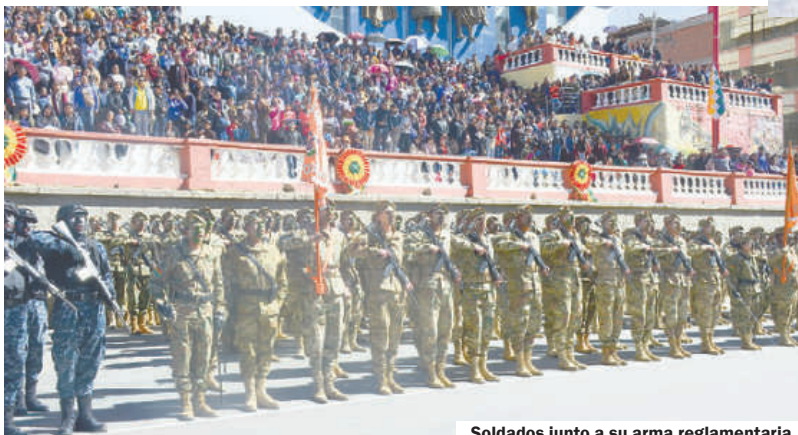
Soldados junto a su arma reglamentaria