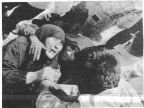
Libertad de prisioneros Una madre llora de alegría cuando le toma las manos a su hijo al llegar éste junto a otros prisioneros de guerra iraníes puestos en libertad por Irak. Asimismo Irak accedió a devolver los territorios fronterizos durante el conflicto con Irán.

BEIRUT. Las tropas sirias intervienen para sofocar los combates entre grupos chaitas rivales que dejaron una decena de muertos en los enfrentamientos con bombas de mortero y ametralladoras en los suburbios sureños de Beirut. Las luchas entre milicianos del partido pro-irani Hizbullah y de Amal, respaldados por Siria, dejaron además 25 heridos y entre las víctimas fatales se hallaban dos niños. (AP).