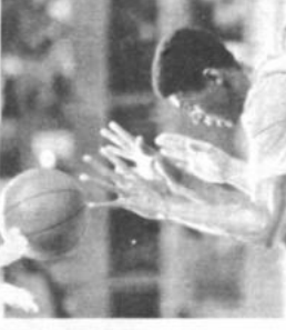
Buenos Aires.- Gerson de Brasil, gana el título de campeón del mundo al derrotar a Yugoslavia en la final del mundial de básquet.

La prensa deportiva calificó hoy a la selección argentina de "campeón de lujo" por haber ganado el título de campeón del mundo al derrotar a Yugoslavia en la final del mundial de básquetbol. Para "Clarín", la final fue un espectáculo, un show a cargo de Yugoslavia, que resultó un legítimo y lujoso campeonato. El equipo argentino, que en el partido final y demostró su "superioridad" sobre los restantes equipos del certamen, fue derrotado por el equipo de Yugoslavia por un marcador de 86 a 78. El equipo argentino, que en el partido final y demostró su "superioridad" sobre los restantes equipos del certamen, fue derrotado por el equipo de Yugoslavia por un marcador de 86 a 78.