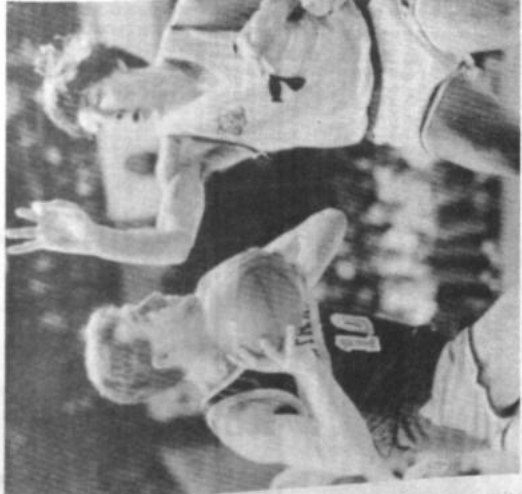
Buenos Aires.- Andrew Gazo, delantero de Australia, controla ante la mirada de Diego Orrella de Argentina, mientras el partido entre ambos se desarrolla en el mundial de básquet.

BUENOS AIRES, AGO 20 (REUTERS).-El básquetbol europeo mostró su predominio en el XI Campeonato Mundial de Básquetbol que ganó el domingo Yugoslavia después de vencer en la final a la Unión Soviética.