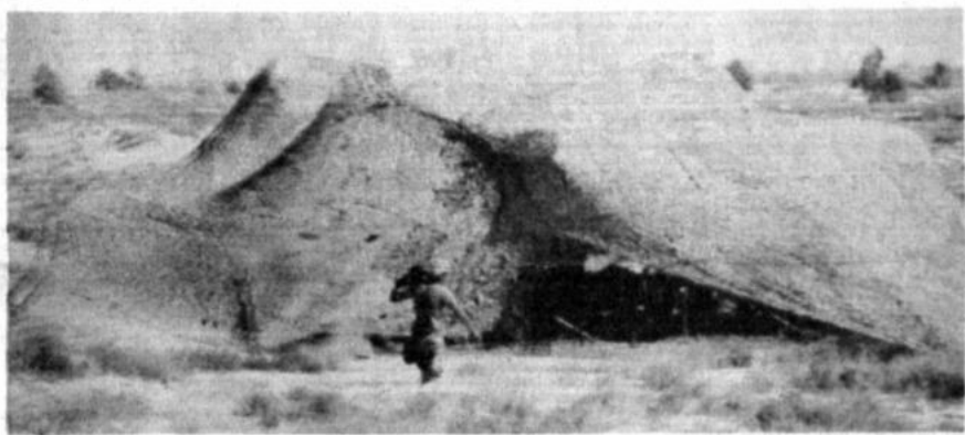
Camuflaje en el desierto

Las tropas enviadas por Estados Unidos al desierto de Arabia Saudita han instalado gigantescas carpas camufladas, en el desierto. El operativo constituye el de más largo alcance, desde la acción militar estadounidense en Vietnam.