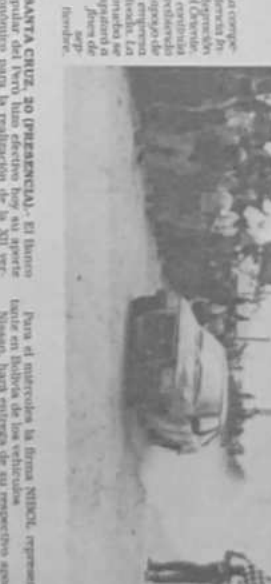
Entrega del aporte para la integración del Oriente.

Se entregó un aporte para la integración del Oriente. El aporte se entregó en el estadio de la Universidad de Chile.