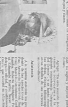
El directorio de la FEBAD durante su reunión en Cochabamba.

El directorio de la FEBAD se reunió en Cochabamba para discutir los planes de la federación para el próximo año. La reunión se celebró en el Hotel Cochabamba.