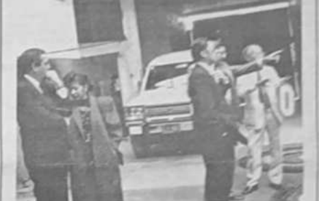
Director de ONUDI en PROSEINPE. El director general de ONUDI, Domingo Sicaiza, junto a representantes de esta institución y del Programa de Promoción de Inversiones (PPI), se hizo presente en instalaciones de PROSEINPE S.R.L., una industria de productos de exportación que espera concretar operaciones comerciales con los Estados Unidos y otros países de Europa.

Exhortó finalmente a los participantes para que busquen soluciones a largo plazo para sus municipios.