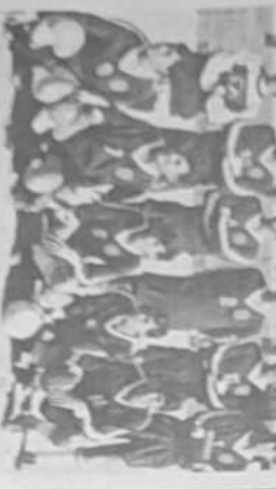
La selección de fútbol de la Universidad de Chile en un partido de la Copa de Chile.

El primer torneo de fútbol se disputó en el estadio de la Universidad de Chile. Blasquedel venció a su rival con un marcador de 2-1.