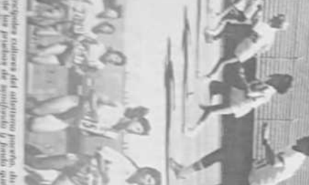
Participantes del torneo de básquetbol en Coblia.