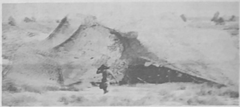
Camuflaje en el desierto

Las tropas enviadas por Estados Unidos al desierto de Arabia Saudita han instalado gigantescas carpas camufladas, en el desierto. El operativo camuflaje el de más largo alcance, desde la acción militar estadounidense en Vietnam.