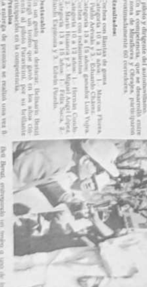
Un momento de la carrera "Beli Benzi".

La carrera "Beli Benzi" se cumplió con éxito. El evento se disputó en el estadio de la Universidad de Chile.