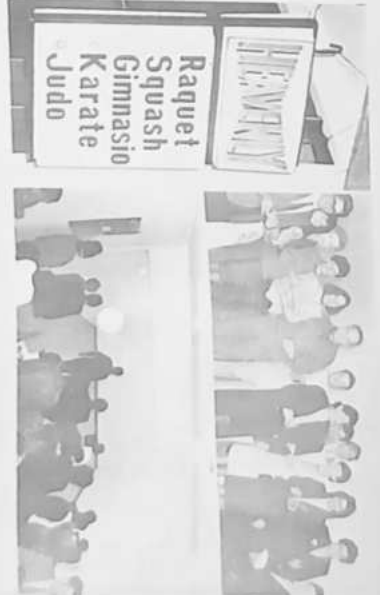
Nuevo Gimnasio El gimnasio de Bolívar, ubicado en la ciudad de Montevideo, es el más moderno y equipado de la ciudad.