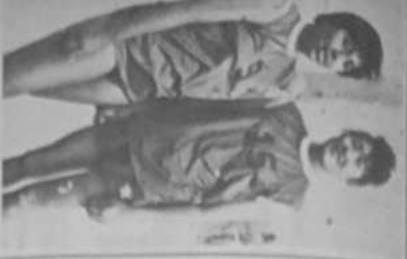
Relay de 4x100 metros de la selección de fútbol de la Universidad de Chile.