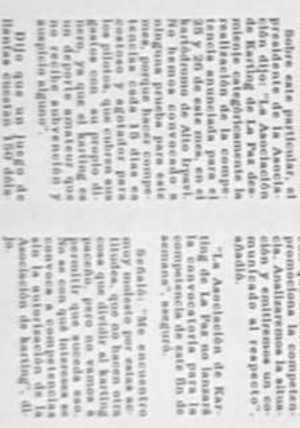
Un momento de la prueba de Karling.

La Asociación de Karling de La Paz, desmiente la prueba del domingo 26. El evento se disputará en el estadio de la Universidad de Chile.