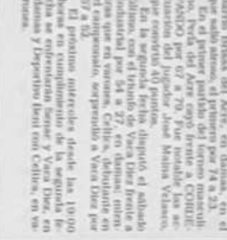
Un momento del torneo de básquetbol en Coblia.

El torneo de básquetbol se inició en Coblia. El primer partido se disputó entre Coblia y su rival, con un marcador de 80-70 a favor de Coblia.