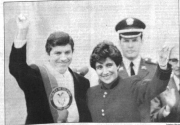
Nuevo presidente de Colombia César Gaviria juró ayer como nuevo presidente de Colombia, en una etapa más de la consolidación democrática de su país. En el gráfico Gaviria aparece junto a su esposa Ana Milena. (Más información página 9).

"Pensamos que existe una amenaza inminente a Arabia Saudita por la forma en que los iraquíes se han desplegado y tomado posiciones", dijo hoy a los periodistas el vocero de la Casa Blanca, Martin Fitzwater. El vocero presidencial se negó a detallar cuáles serían los movimientos de tropas, pero fuentes del Pentágono confirmaron que una brigada de 4.000 paracaidistas fue enviada al reino, un estrecho aliado de Washington, desde el este norteamericano. La resolución de la Casa Blanca fue adoptada tras la misión que desarrolló en Arabia Saudita y otros países del Golfo el secretario de Defensa, Dick Cheney. Funcionarios del Departamento de Defensa indicaron que las tropas de la 82a División Aerotransportada y fuerzas especiales podrían ser reforzadas por contingentes militares egipcios y de otras naciones.