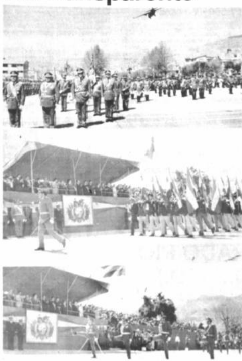
Unidades militares acorronadas en La Paz participaron ayer de la Jura a la Bandera y la parada militar en el Campo de Marte ubicado en la plaza Villarroel de la zona de Miraflores. Al acto asistió el presidente Paz Zamora, autoridades policiales, cuerpo diplomático, parlamentarios e invitados especiales. Naves de la Fuerza Aérea Boliviana (FAB) sobrevolaron el lugar.

Además, se destruyeron 63.109 metros cuadrados de almacén, lo que significa que se impidió la producción de 6.156 hectáreas de coca.