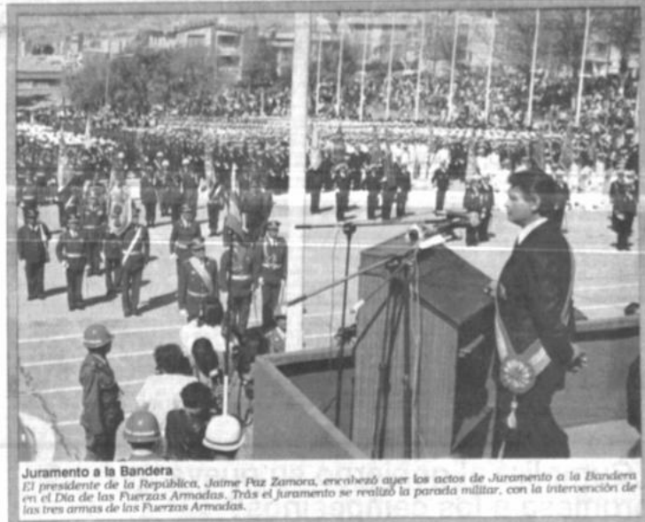
Juramento a la Bandera El presidente de la República, Jaime Paz Zamora, encabezó ayer los actos de Juramento a la Bandera en el Día de las Fuerzas Armadas. Tras el juramento se realizó la parada militar, con la intervención de las tres armas de las Fuerzas Armadas.

"Era imprevisible y nadie previó que iba a estallar el conflicto", declaró.