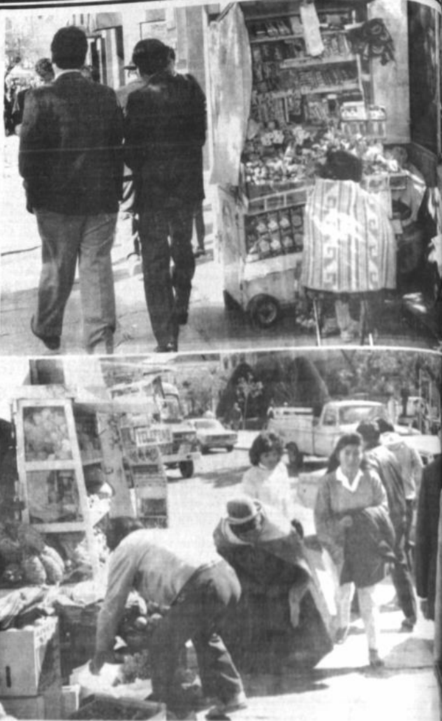
La Paz tiene intendente?