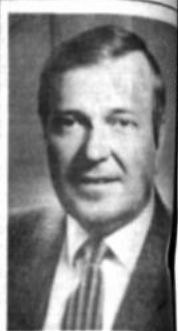
Encargado de Negocios de Suiza, Fermo Geronzi

la zona de la Serranía del Candado, en Bermejo, Tarija, dijo Aramayo. El ejecutivo afirmó que la empresa "Plus Petrol" se comprometió a invertir 24,3 millones de dólares en los seis años de explotación geológica y perforación de pozos. Finalmente, el directorio aprobó el contrato de operación con Petrolvez, que invertirá 12 millones de dólares en los seis primeros años de explotación y perforación de pozos en la zona de Lagunillas, en el departamento de Chuquisaca y Santa Cruz. YPFB también ultimaré detalles del contrato de explotación en las zonas Poopó 1 y Poopó 2, ubicadas en las regiones altiplánicas de los departamentos de Oruro y Potosí.