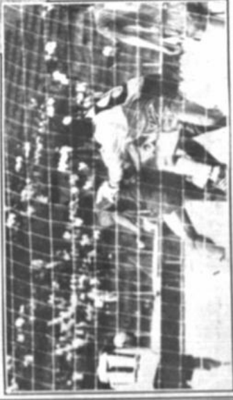
La actividad futbolística estará vigente hoy, con los partidos entre Real Blooming, en Santa Cruz y Wilstermann Independiente Porvenir, en Cochabamba.