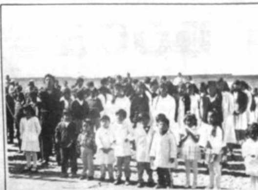
Alumnado del Centro Educativo "Mutual La Paz" que funciona bajo el sistema cooperativado en la Urbanización El Kenko.