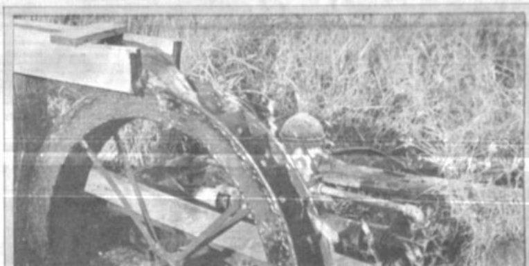
Auto-abastecimiento de agua potable

El paro tiene su origen en la intención del gobierno MIR-ADN de transferir a la empresa privada la explotación petrolera en pozos de recuperación de Montegudo, Tararanda, Bermejo, El Toro y La Guinilla. Según Blanco la transferencia provocará un masivo despido de trabajadores.