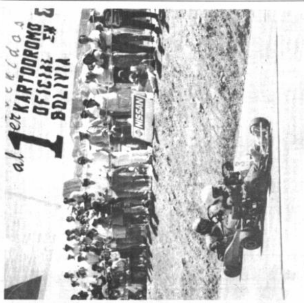
El karting internacional de Alto Irupati, este fin de semana volverá a ser escenario de una importante competencia internacional.

Las inscripciones se reciben en BAMBI SRL, a un costo de $10, 15 por piloto.