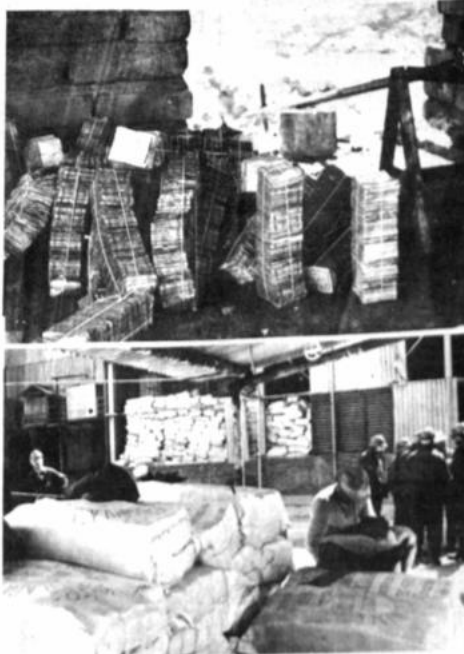
Quema de billetes

Fuente de billetes de diversas denominaciones son incinerados en el Complejo Metalúrgico de Vinto, en cumplimiento a lo dispuesto por el D.S. 22524 que instruye la destrucción de todo el material de la época crítica de la hiperinflación en Bolivia.