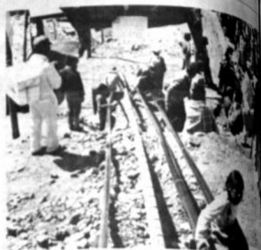
Los niños de la zona Waca Taq'i, el único lugar de esparcimiento son los oleoductos que conectan la planta de Entre Ríos de YFPD.

El "camino de los toros" ha cedido paso al camino de las dificultades de los pobladores de las villas marginales y tiende a convertirse en el proyecto de las gradass, al camino que disminuirá la penuria de los que no tienen suficientes recursos económicos para constituirse a sus fuentes de trabajo que se hallan en la ciudad de La Paz.