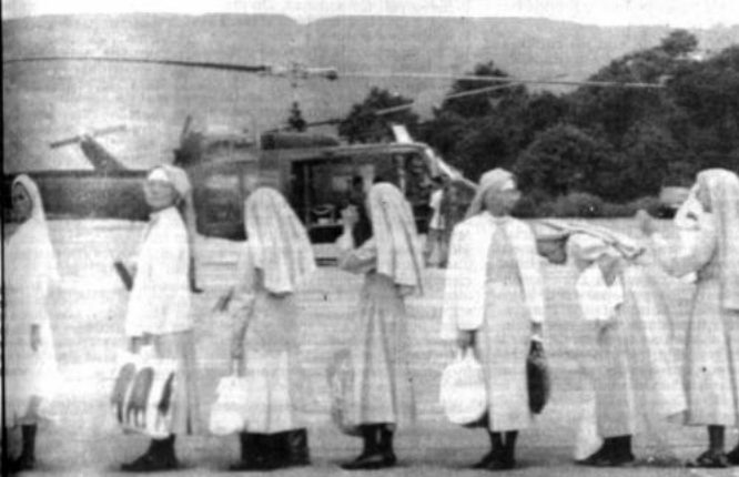
Los habitantes esperan en fila antes de viajar a Manila por helicóptero en Baguio. La evacuación de la zona continuó siete días después del terremoto que causó la muerte de más de 1.000 personas (Fili-Telefoto, Reuters).