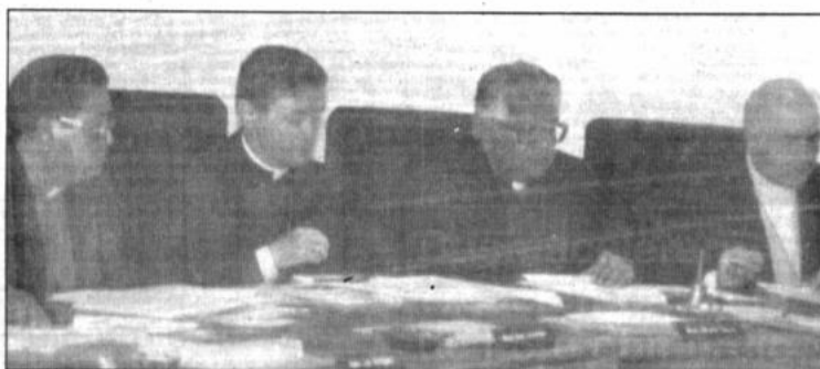
La Conferencia Episcopal Boliviana trajo ayer su reunión anual ordinaria en la ciudad de Cochabamba.