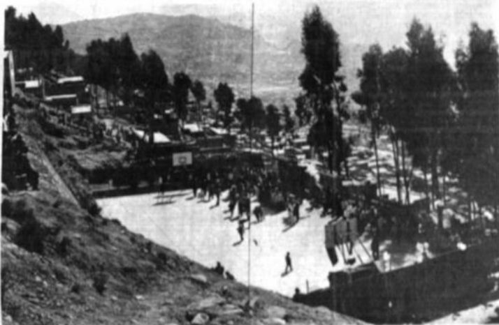
La zona Waca Taq'i (camino de los toros), se encuentra en plena pendiente del cerro que divide la ciudad de El Alto con La Paz. Los barrancos y los árboles hacen de la zona una urbanización muy particular, pero de difícil acceso peatonal y vehicular.

APOYO DE LA COM En conocimiento de la Comisión Democrática del país, emitido a los medios de comunicación, pide a los acreedores la aprobación de la resolución, para expropiar los terrenos.