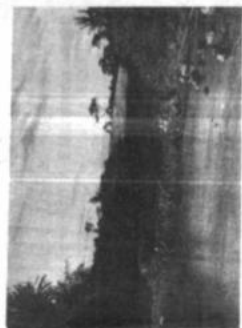
Uno de los varios ríos, por donde pasará la prueba "Vuelta a La Paz".