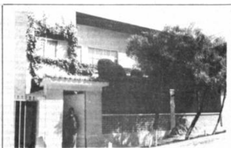
Químicos e inmueble del narcotráfico a la UMSA y la JNSDS

La Paz, Bolivia, martes 17 de julio de 1990