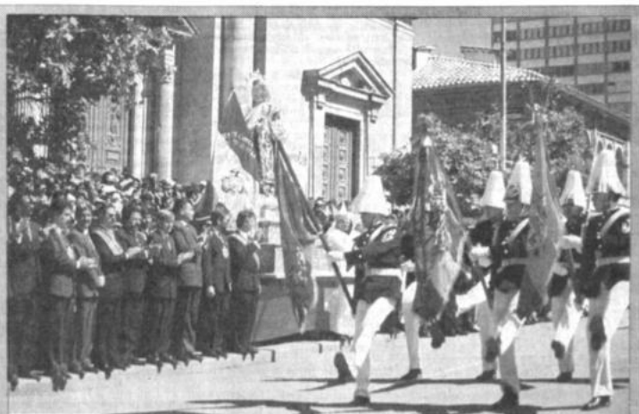
Homenaje a La Paz El presidente de la República, ministros, autoridades militares, eclesiásticas y pueblo en general se concentraron ayer en la Plaza Murillo para rendir homenaje al aniversario cívico de La Paz. El gobierno ha anunciado un programa extraordinario de inversión, de más de 20 millones de dólares para impulsar el desarrollo cívico.

Comandante en jefe de las Fuerzas Armadas dice que no se necesita autorización congresal