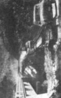
Uno de los tantos desfiladeros, para nivelar la carretera a Yungas.