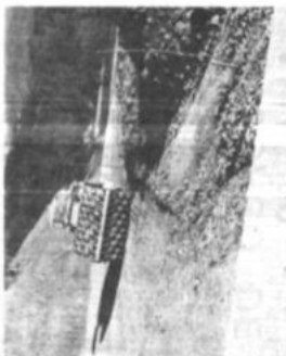
Máquina compactadora de tierra, durante el trabajo de la ruta.

El "Tigre" está con problemas Luna y Martínez no actuarán ante San Pedro Ramallo se automarginó del equipo Alvarez al borde de la desesperación