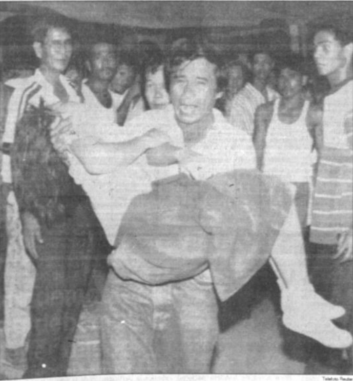
Victima Un hombre gita mirando transporta a una niña hacia una ambulancia, después que un terremoto azotó Manila y destruyó al Colegio Cristiano Filipino en Cabanatuan City. Se teme que cientos de personas siguen atrapados en los escombros de la escuela.

MANILA, JUL 17 (REUTER). Soldados y trabajadores de los equipos de rescate se esforzaban hoy por liberar a cientos de personas que quedaron atrapadas bajo los escombros de dos hoteles y una escuela que se derrumbaron cuando un poderoso terremoto sacudió el norte de Filipinas. Por lo menos 90 personas murieron durante el sismo que alcanzó los 7,7 puntos en la escala de Richter y como consecuencia del cual se desmoronaron hoy varias escuelas, hoteles y un edificio de la universidad, dijeron funcionarios a cargo de la coordinación de las operaciones de socorro. La ciudad septentrional de Baguio fue la más afectada por el sismo. El director de la defensa civil filipina Ernesto Rivera expresó que unos 250 huéspedes y miembros del personal quedaron sepultados bajo gruesas losas de concreto cuando dos lujosos hoteles se derrumbaron allí. (Más información, página 7).