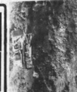
Maquinaria pesada abriendo camino para la "Vuelta a La Paz".