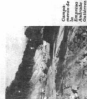
Campaña de nivelamiento de la Empresa Andrade Outléz.