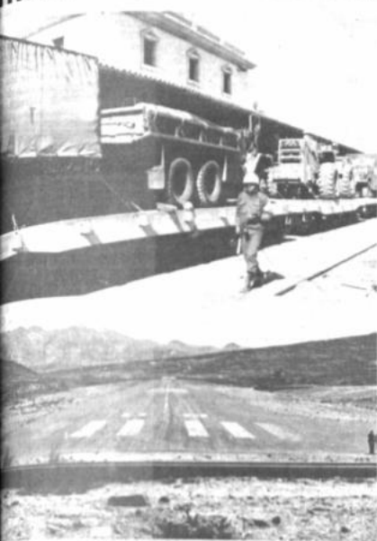
ente militar de EE.UU.

ente contingente norteamericano que tomará a su cargo la explanación del cerro Pati Pati, llegó en las últimas horas, para dar el trabajo durante la presente semana.