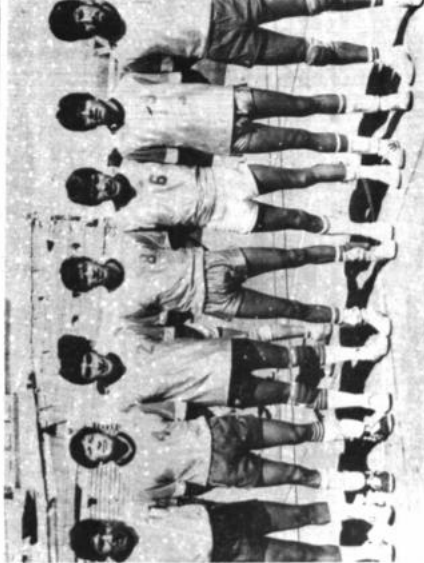
Selección de volibol de la facultad de Ingeniería Mecánica, que interviene en el torneo de LUD de ESA