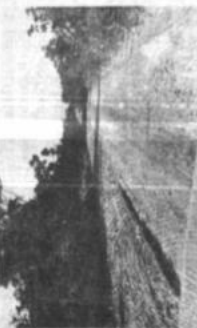
Un panorama del sector entre las poblaciones de Curunani-Chulumani.