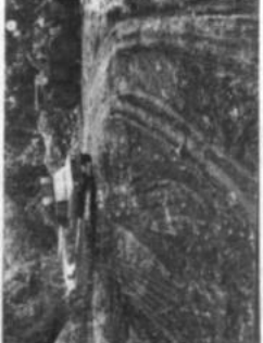
Uno de los sectores donde la empresa Andrade Outléz trabaja.