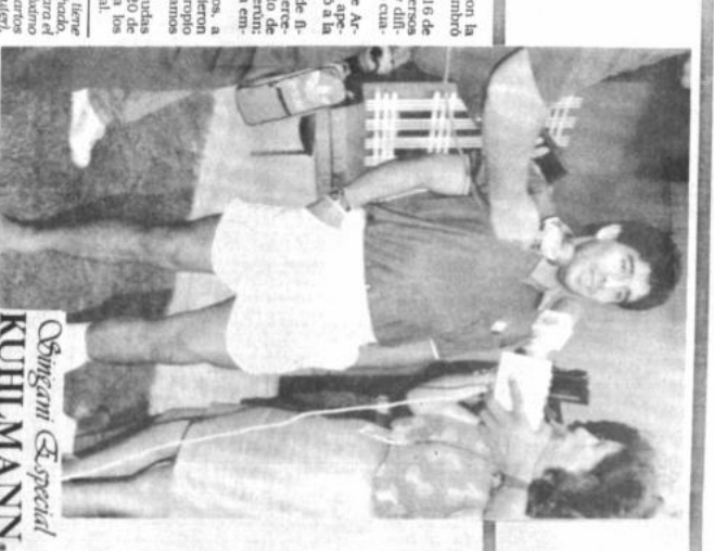
Diego Maradona, el jugador argentino que se convirtió en el héroe de la Copa del Mundo.

Maradona, como una lechuga, suple el papel de jugador, pero fundamentalmente multichico, pero fundamentalmente multichico.