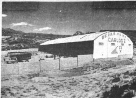
Nueva fábrica Una nueva fábrica de cerámica roja fue inaugurada recientemente en la ciudad de Potosí, la misma que lleva el nombre de "Carlos V".

Informó que el gobierno de Alemania prestará importante cooperación con el principal objeto de evitar la migración de familias campesinas de los departamentos de Oruro y Potosí que agobiadas por los efectos de la sequía tienden a ingresar a las ciudades del interior de la República.