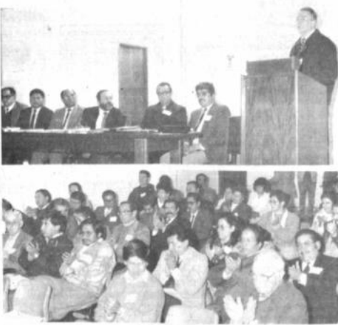
Comisión Episcopal de Educación y gobierno

Para hoy está programada una exposición sobre las experiencias de: Muryrnia, capacitación técnica y humanística en función de un contexto religioso; y el pro-