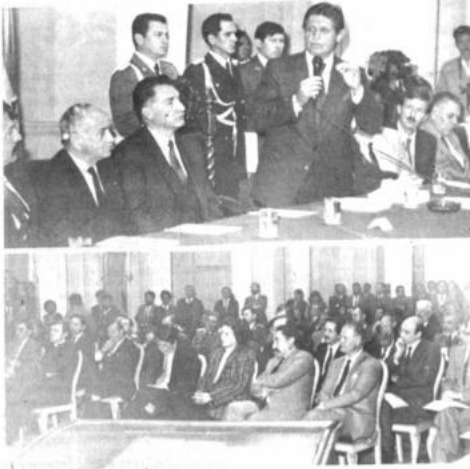
Las autoridades bolivianas, diplomáticos e invitados especiales durante el acto de adhesión al Día Internacional de Lucha contra las Drogas, que se llevó a cabo ayer en la Cancillería.

El precio de la carga de 50 kilos de coca, que entre 1.980 y 1.983 llegó a la espectacular cifra de