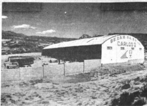
Nueva fábrica Una nueva fábrica de cerámica roja fue inaugurada recientemente en la ciudad de Potosí, la misma que lleva el nombre de "Carlos V".

Informó que el gobierno de Alemania prestará importante cooperación con el propósito de evitar la migración de familias campesinas de los departamentos de Oruro y Potosí que agobiadas por los efectos de la sequía tienden a ingresar a las ciudades del interior de la República.