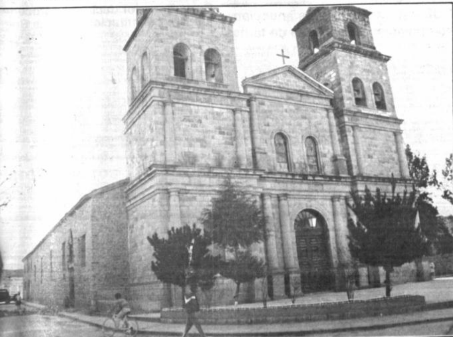
TARIJA, 24 (PRESENCIA). La Catedral de Tarija ha empezado a demurrarse sin que los múltiples ofrecimientos formulados para financiar los trabajos de mantenimiento hubiesen logrado concretarse hasta el presente.

8.- Conclusiones y recomendaciones del evento.