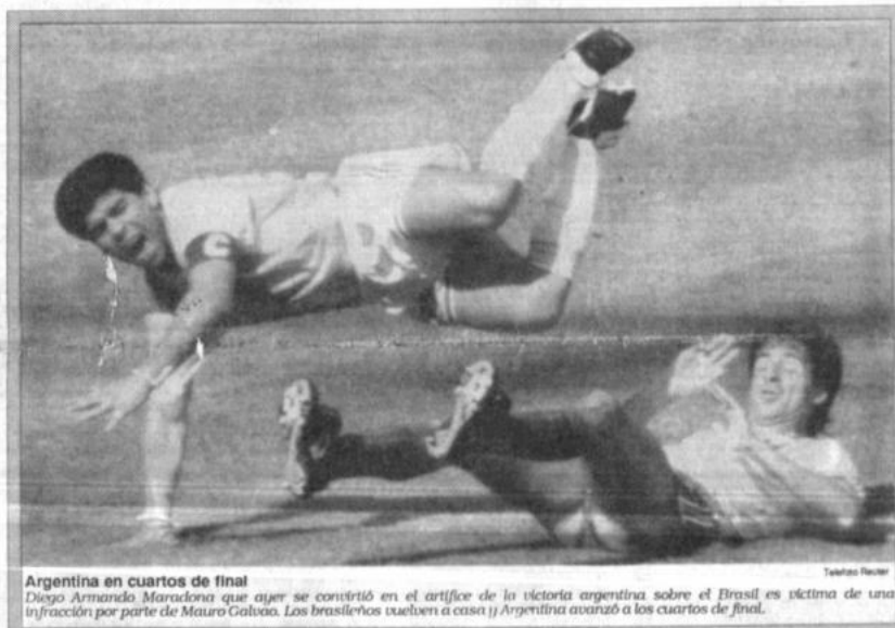
Argentina en cuartos de final

Diego Armando Maradona que ayer se convirtió en el artífice de la victoria argentina sobre el Brasil es víctima de una infracción por parte de Mauro Galvão. Los brasileños vuelven a casa y Argentina avanzó a los cuartos de final.