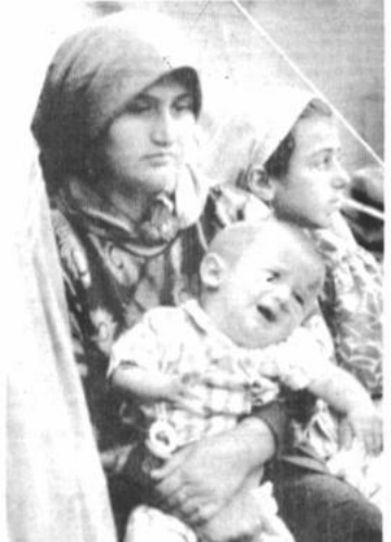
Victimas Una mujer iraní se sienta con sus hijos en la entrada de una carpa en la calle principal de Rasht. Un temblor que afectó a esta ciudad de 20.000 personas dejó más de 8.000 muertos. En toda la región afectada se prevé un total de 50.000 muertos.

Irán comunicó a las Naciones Unidas que el número de muertos podría elevarse a 50.000 de los 40.000 ya registrados.