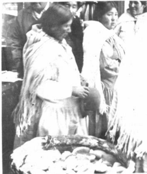
Frente al anuncio del alza del precio del pan de batalla, la Alcaldía se ocupa de controlar el precio y el peso de ese producto a través de la intendencia.

"En caso de que suban los precios arbitrariamente, la intendencia determinará las sanciones respectivas a las panaderías que lo hagan", manifestó al tiempo de informar que en El Alto hay normal suministro de pan.