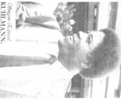
Fernando Flores, entrenador de Colombia, expresó su fe en eliminar a Camerun en los octavos de final.

En los octavos de final se acaloran las especulaciones. Los partidos son por eliminación directa y que los equipos que logren imponer sus condiciones, especialmente sobre el arco contrario. Si ambos equipos repiten las actuaciones que los llevaron a la clasificación, el espectáculo está garantizado. Con el arbitraje del italiano Tullio Lanzi, el partido por los octavos de final se jugará el sábado 23 de junio a las 10:00 horas boliviana (16:00 GMT) en el estadio de fútbol de Bogotá por los octavos de final de la Copa Mundial de Fútbol en México, en la que logró una victoria ante el sorprendente Camerun cuando ambos equipos se enfrentaron el sábado 19 de junio en el estadio de fútbol de Bogotá por los octavos de final del equipo de Francisco Matarruna. El equipo de Colombia, que se enfrentó a las 11:00 horas boliviana (16:00 GMT) clasificó por el Grupo B, con un marcador de 1-0, con el que logró clasificarse a la siguiente ronda, a la vez que Colombia se enfrentó a la selección de la Unión Africana.