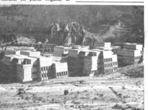
La planta de Vuelta Grande en Chuquisaca, que costó 79,8 millones de dólares, produce 2.400 barriles diarios de petróleo.