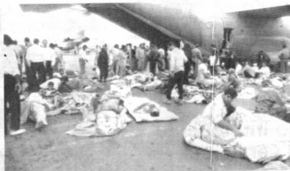
Víctimas Miles de víctimas fueron evacuadas en autocares procedentes de Teherán, para ser atendidas en los respectivos institutos de salud. Las víctimas se encuentran por el momento en el aeropuerto de Teherán.