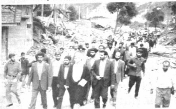
Inspección El presidente de Irán, Hashemi Rafsanjani, visita una área devastada por el terremoto. El sismo causó más de 35.000 muertes 30.000 heridos y 400.000 evacuados.

"No existe justificación para dar gratis un barril por cada tres que vendamos. Sencillamente es injustificable e ilógico", agregó.