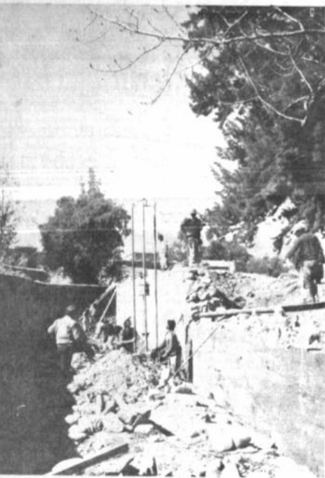
Quebrada del Cementerio

La municipalidad de Tarija, con apoyo financiero del Fondo Social de Emergencia, construye un canal aductor de las aguas de la quebrada del "Cementerio", dentro un programa de protección del suelo contra la erosión.