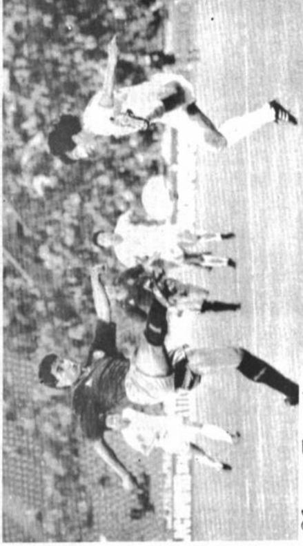
Bingami Especial KUHLMANN.

En el quinto tiempo, Michel volvió a marcar con un tiro libre desde la izquierda del área, tras haber pasado el balón al lado de la barrera de los marcadores de Corea.