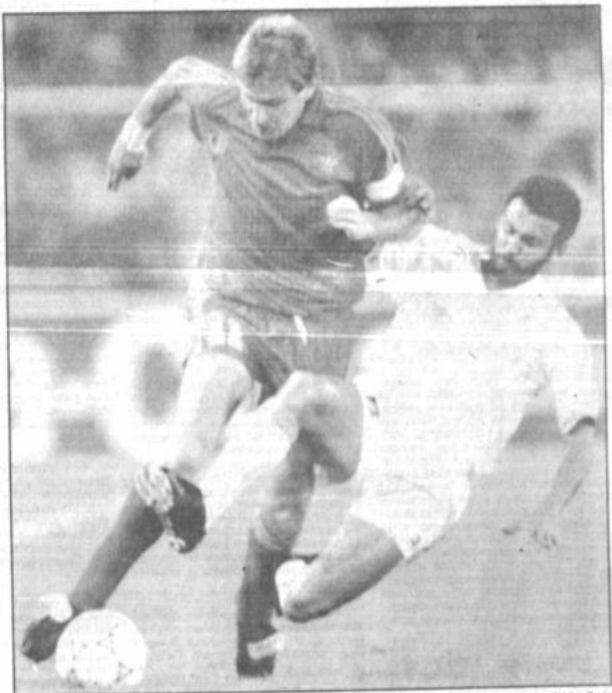
Victoria de Bélgica

Lea Plaza reveló que ambos mandatarios acordaron presentar ante el presidente brasileño Fernando Collor de Mello, una política conjunta de negociación para la venta boliviano-argentina de gas. (Más información, pág. 5).