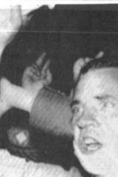
Manifestantes. Un manifestante rumano herido grita lemas antigubernamentales en Bucarest. Esta fue la primera manifestación, luego de tres días de violencia ocurridos la semana pasada. Este hombre fue golpeado por mineros que apoyan al presidente Iliescu.

Dirección: Parroquia de los Padres Carmelitas, avenida 20 de Octubre