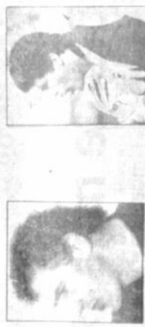
Peter Shilton, de Inglaterra.

En la administración de los aficionados con sus audaces salidas anticipándose a los riesgos, estudiando a delanteros rivales y simplificando las jugadas más complicadas.