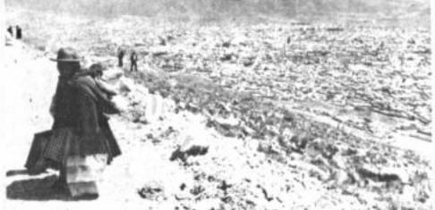
Faldas del Cerro Rico La fotografía muestra en primer plano las faldas del Cerro Rico de Potosí. Una comisión de expertos se hará cargo de analizar los motivos del cambio de la fisonomía de la cuspide del legendario cerro.

Reiteró "Precisamente con ese propósito, este miércoles 20 de junio, visitará la población de Catavi, y de Catavi una misión del Banco Interamericano de Desarrollo conjuntamente una representación nacional".