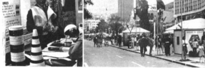
"Paquito 90". Con los orgánicos de la Policía, se inauguró ayer la Expo-Feria "Paquito 90" en la avenida 16 de Julio. La muestra de equipos modernos y posados de esa institución y la explicación de actividades realizan sus efectivos en el país. La exposición es uno de los actos destinados a celebrar el aniversario de la creación de la Policía. La Expo-Feria durará una semana, según informaron autoridades de esa entidad.

Dijeron que el incremento de los carburantes sobrepasó el 4,8 por ciento y que deben incluirse otros componentes del costo, como el precio de los repuestos y lubricantes. "El aumento no puede ser menor al 32 por ciento", aseguraron.