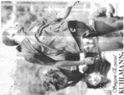
Costa Rica, Escocia y Uruguay se enfrentan en una práctica de Costa Rica, ayer en Mendocino.