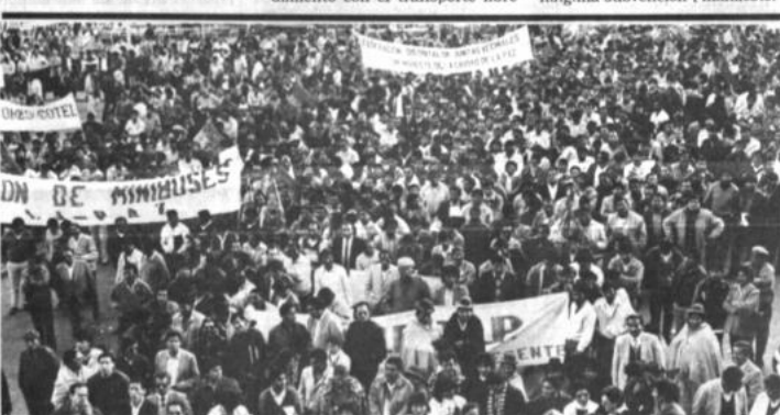
Marcha de la COD

"Nosotros no queremos subir las tarifas pero no encontramos otra alternativa, pues no tenemos ninguna subvención", manifestó.