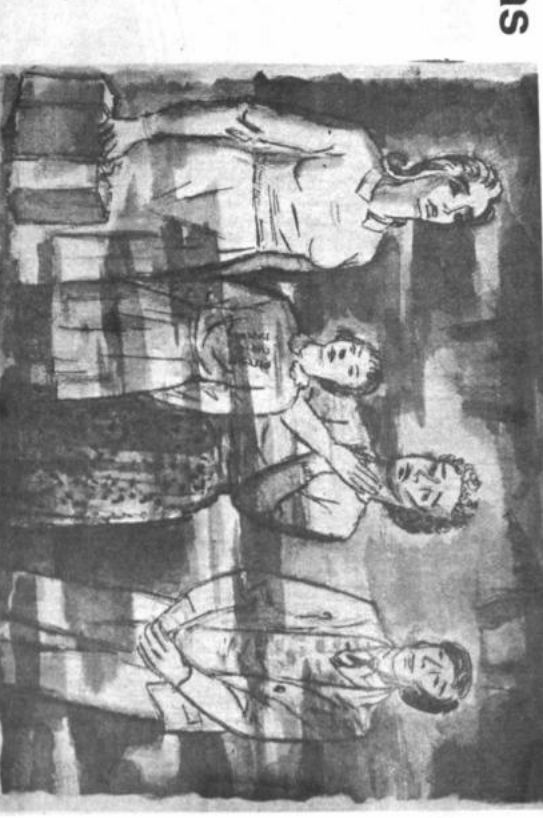
Ilustración de Laura y su madre.