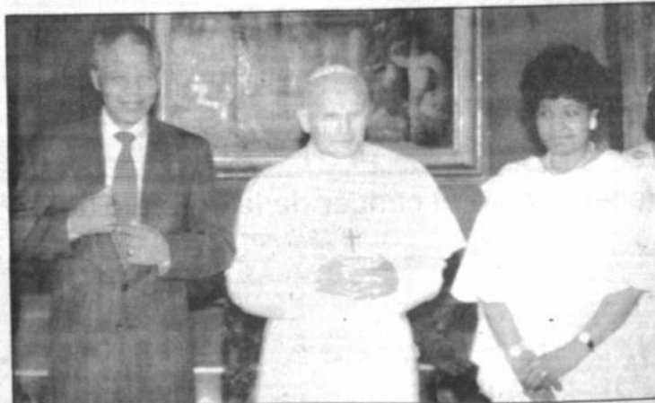
Mandela con el Papa. El Papa Juan Pablo II recibió ayer en audiencia especial a Nelson Mandela y a su esposa Winnie. Mandela realiza una gira mundial para persuadir a los gobiernos para que mantengan sanciones contra el gobierno de Sudafrica, hasta que el apartheid sea abolido.