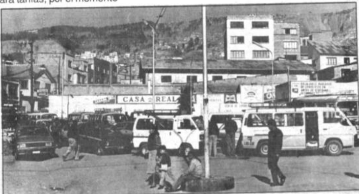
A pesar del alza en el precio, largas colas se formaron ayer en las gasolineras, especialmente de vehículos de servicio público.

Al paro se sumarán los asociados del Transporte Libre, con quienes los choferes sindicalizados habrán llegado a un entendimiento. "El costo de operaciones es el mismo y, por tanto, todos debemos en-