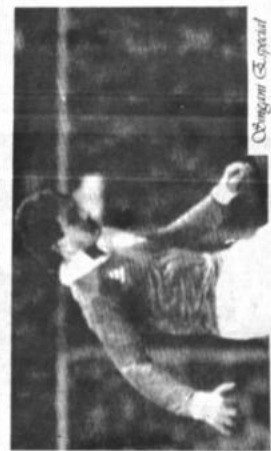
Branco, sorprendido bajo.