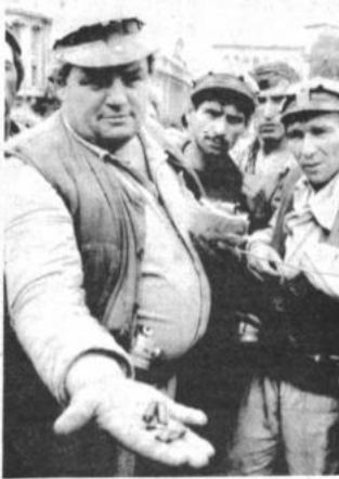
Disturbios Partidarios del gobierno rumano del presidente Ion Iliescu exhiben cartuchos de balas usados en Bucarest. Los mineros dicen que los utilizaron contra manifestantes, contra el gobierno durante los días de violencia y disturbios.

Asimismo, ayer temprano soldados abrieron fuego contra manifestantes que arrojaban bombas incendiarias contra la sede de la policía, y en toda la ciudad se escuchaban disparos esporádicos, tras lo cual aparecieron los mineros.