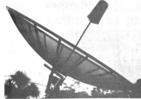
Antena parabólica Vista de la antena parabólica de televisión que las empresas madereras San Francisco e Ixiamas donaron al pueblo de Ixiamas.