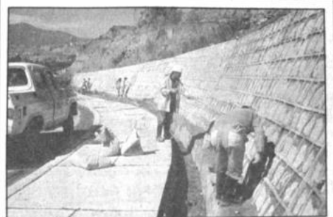
Mantenimiento de la Av. Kantutani

En cumplimiento a las instrucciones del alcalde MacLean, obreros del municipio procedieron a la limpieza y mantenimiento de los 3 mil metros de la Av. Kantutani. Para el efecto se demandó la participación de 270 obreros y técnicos, equipo pesado y semipesado. El trabajo consistió en el pintado de muros y muretes; limpieza de cunetas y bocas de tormenta; reparación de aceras, retiro de escombros y desechos sólidos; estabilización de las aceras; señalización de las curvas; instalación de barreras de seguridad; cambio de luminarias; peinado de taludes y otros. Al mismo tiempo se procedió a la planificación de 400 arbolitos ornamentales. Los trabajos de mayor atención continuarán en el curso de esta semana, como los relacionados con el resellado de la calzada.