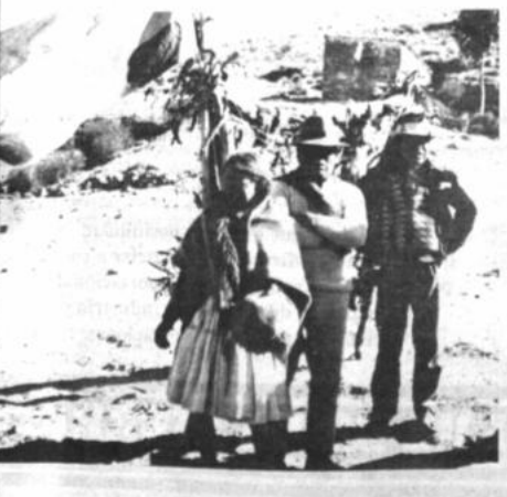
Campeño agentes de la comunidad de Pokorasi, que se movilizaban hacia el camino troncal a Potosí, plantearon a una comisión del gobierno los puntos relacionados con sus necesidades sociales y destacaron el principal problema que requiere solución, es la construcción de un camino de acceso a su comunidad.