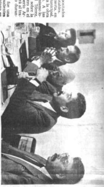
MESA REDONDA SOBRE TIWANAKU. Ayer se cumplió el programa sobre la mesa redonda sobre Tiwanaku, en el auditorio del Museo Nacional de Arqueología.

Con este motivo, ayer se trasladó a ese país, el oficial mayor de la Legación Boliviana, para velar en la madrugada del viernes 7.