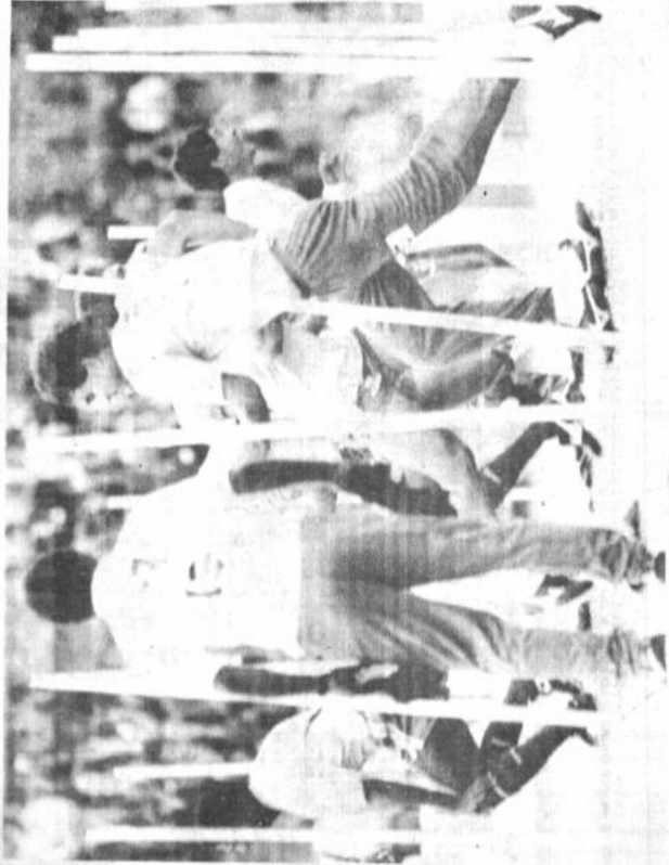
Brasil. Los componentes de la selección nacional de Brasil se desplazan por el campo de juego durante una sesión de entrenamiento que se realizó en Asil, al norte de Italia, (Fieigio-Reuter).

MARIO MENA, exfutbolista, es considerado el candidato número uno para el primer lugar. Los argentinos esperan con optimismo la concreción de un buen resultado en el torneo de fútbol. Los brasileños, por su parte, esperan con optimismo la concreción de un buen resultado en el torneo de fútbol.