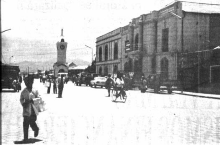
Uyuni, 5 (PRESENCIA).- El tema de la explotación del litio se mantiene en permanente actualidad. Ayer se celebró en esta ciudad un ciclo de conferencias auspiciado por la Policía sobre las perspectivas que existen para la explotación del litio. Igualmente hace poco se redactaron los términos de referencia para la explotación del litio de Uyuni. La fotografía muestra el palacio consistorial de Uyuni, donde se efectuó a principios de año un seminario sobre el tema.