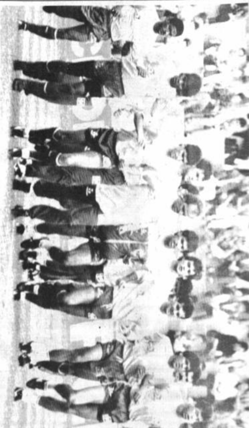
La selección de fútbol de Brasil se prepara con el mayor optimismo para competir por el título en el torneo que se iniciará el próximo viernes en Italia. En la fotografía un pasaje del entrenamiento que realizó ayer. (Telefoto Reuters).

El Mundial todavía no empezó, pero ya se escuchó la estrella, dice hoy un corresponsal del diario Corriere della Sera al elegir el desempeño del holandés Rivaldo Gullit en el partido de fútbol.