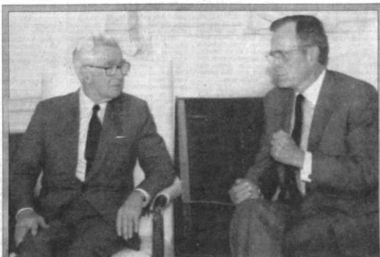
Barco en Estados Unidos

El presidente colombiano Virgilio Barco conversa con su colega norteamericano George Bush, en lo que fue su última visita oficial a EE.UU., antes de entregar el mando, en julio, a César Gaviria. El tema del narcotráfico dominó la reunión.