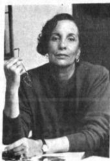
la galería de Arte, donde trabajo ya 15 años.