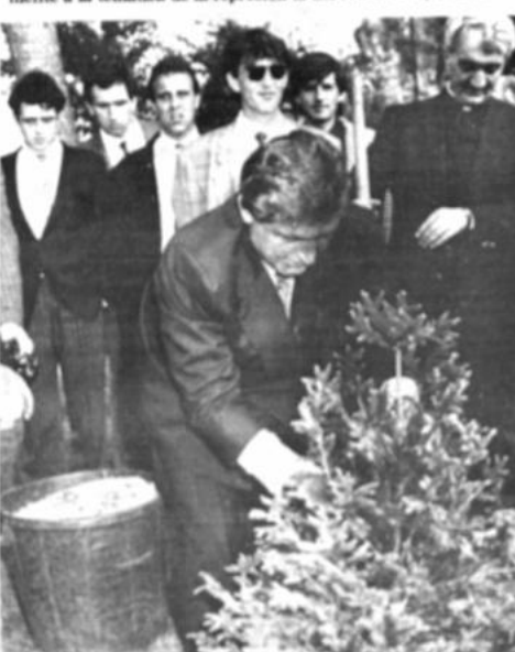
El presidente de la República, Lic. Jaime Paz Zamora, visitó durante su breve estadía en Roma, el Ceto, un centro de rehabilitación de drogadictos, donde el jefe del Estado plantó un árbol, simbolizando el deseo de que en el futuro, crezcan y se desarrollen, como las plantas, los hombres sanos y nuevos.

"He sido invitado por el presidente, pero mi participación en las reuniones con autoridades estadounidenses y organismos de financiamiento internacional, no estará referida exclusivamente a la temática de la represión al narcotráfico", precisó.