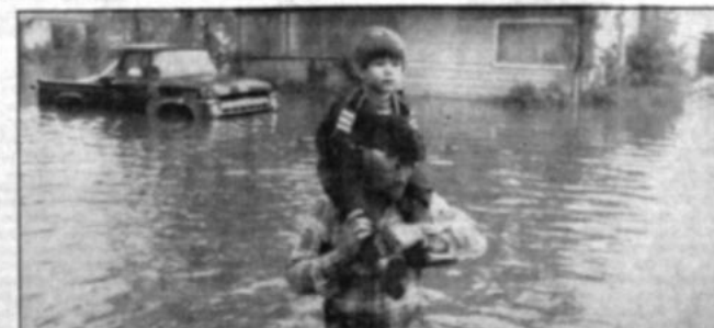
Inundación Un ciudadano de Dallas, EE.UU., lleva a su hijo en hombros por una calle inundada a causa de las fuertes lluvias caídas ayer. Se informó que al menos tres personas murieron.