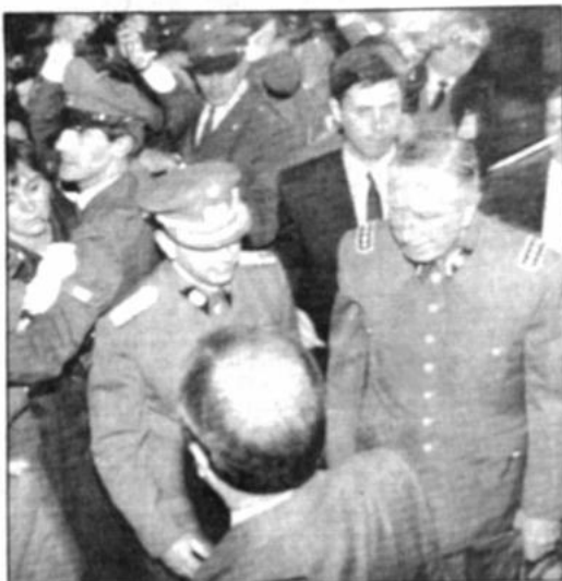
De vuelta al Palacio El general Augusto Pinochet (derecha), sin gorra, ingresa al Palacio de La Moneda, donde se reunió ayer con el presidente Patricio Aylwin, en su primera visita a la sede del gobierno de Chile desde que entregó el poder en marzo pasado.

El polémico contrato, que originó la protesta cívica del pueblo potosino, sus dirigentes, la oposición en pleno y los sindicatos, fue puesto anoche en la mesa de sesiones de la Cámara de Diputados, después de alterar el orden del día. Pese a la premura del gobierno, el contrato será considerado formalmente a partir del lunes. La necesaria aprobación de dos leyes adicionales al contrato del litio -las de salinera y de regalías- obstaculizará la ratificación de ese convenio en el Congreso, advirtió el MNR, que rechazó en principio el tratamiento del contrato por no estar incluido en la agenda de sesiones extraordinarias. El MBI argumentó que las modificaciones propuestas por el gobierno a una legislación sobre el Salar son inconstitucionales.