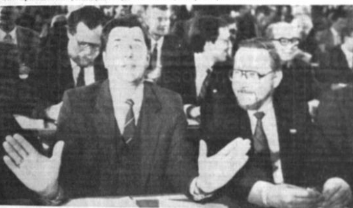
Sesión de Parlamento El presidente de Letonia Anatoly Gorbachov (aquí) hace un gesto durante una sesión del Parlamento en Riga. Los funcionarios de Letonia están considerando un programa de independencia que conservaría la Unión Soviética.

Durante el pasado año, Letonia fue siguiendo los osados movimientos políticos lituanos. En diciembre abolió el monopolio del poder del Partido Comunista, en febrero condenó la ley de 1940 que formalizó su anexión por la Unión Soviética; y el mes pasado una gran parte de su Partido Comunista, rompió con el de Moscú. Todo fue ocurriendo meses, y a veces semanas, después que en Lituania.