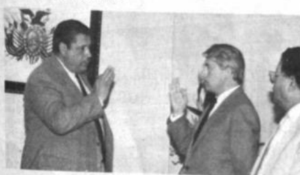
Nuevo director de Unidad Sanitaria La Paz

El senador nacional dijo que las bancadas del "Acuerdo Patriótico" en virtud de esas razones y otras de carácter técnico y económico, han decidido respaldar el contrato con la LITICO en ambas cámaras legislativas.