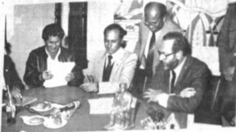
Dirigentes del magisterio y el ministro de Educación firman el convenio que dio por concluido el conflicto de los maestros.

rio ejecutivo de la Confederación de Maestros Urbanos de Bolivia, dijo que la directiva de esta organización se reunirá para definir las formas de "apoyar a quienes hoy están en las calles, pidiendo atención del gobierno".