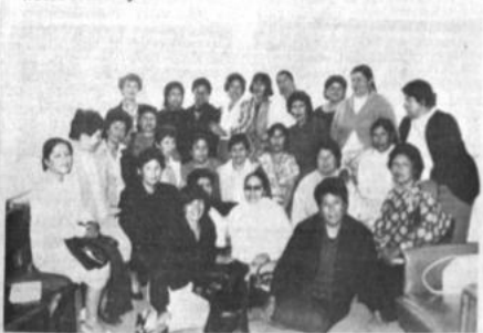
Clubes de Madres de Bolivia

De acuerdo con la convocatoria a elecciones, la posesión del nuevo comité ejecutivo se realizará el próximo 10 de mayo.