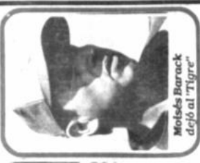
Moisés Barack dejó al "Tigre"

Volvió el malestar Los jugadores de The Strongest ignoraron ayer sus medidas de presión al directorio exigiendo cumplimiento de compromisos económicos. El plantel no entró ayer y es probable que tampoco trabaje hoy.