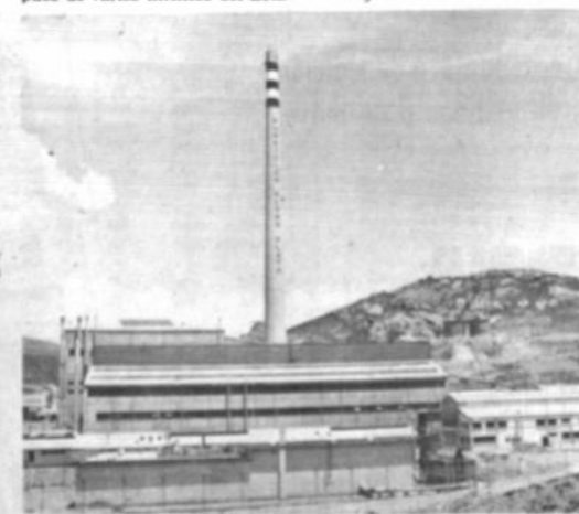
Planta de Karachipampa, en Potosí

Desde marzo cuatro comisiones boliviano-norteamericanas, trabajaron en la preparación de documentos referentes a las áreas de prevención, desarrollo alternativo, interdicción y jurídica y asuntos bilaterales.