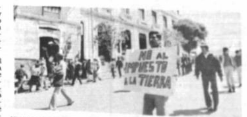
Marcha de protesta