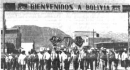
Centro de Fronteras

El nuevo director de Fronteras fue elegido hace dos años entre las diez personalidades más destacadas de Bolivia por el periódico "Última Hora", fue director del programa televisivo de difusión cultural "Jenecheru" y realizó estudios de Derecho, Antropología y Periodismo.