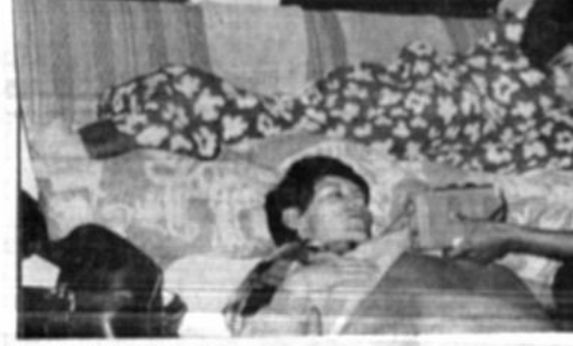
Huelga de hambre cívica

Bajo la atenta vigilancia de policías y agentes de seguridad del Ministerio del Interior, diez representantes cívicos de Potosí cumplieron ayer su octavo día de huelga de hambre en el rector del Hotel Crillon, donde fueron recluidos por el gobierno tras el primer día de la medida. Los huelguistas reiteraron su ineluctable decisión de mantener el ayuno, en tanto el gobierno y la bancada parlamentaria oficialista no desistan de firmar un contrato de explotación de litio potosino a cargo de la transnacional "Lithium Co.", y decidan llamar a una licitación internacional para esa concesión.