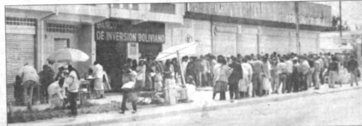
Pago de impuestos. La Dirección General de la Renta dispuso ampliar el plazo para el pago de impuestos de inmuebles urbanos y vehículos. Hasta ayer se registraron enormes colas los bancos, para cumplir con esta obligación, como se aprecia en la foto tomada en la ciudad de El Alto.

Hasta el jueves, los legisladores habrán terminado de analizar los convenios internacionales y préstamos contrados por el gobierno boliviano, por lo que se presume que la reconsideración del contrato con la LITCO se efectuará de inmediato.