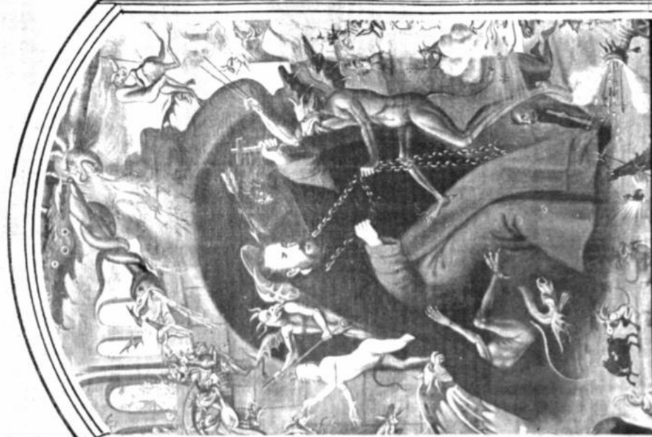
RESTAURACION. Seis lienzos y cuatro murales de la Iglesia de Capatzen, siendo restaurados por personal especializado del Museo Nacional de Arte. Las obras estarán completamente listas y serán entregadas en breve. En la fotografía: "Las tentaciones de San Antonio Abad".

- Circula nuevo libro sobre culturas indígenas