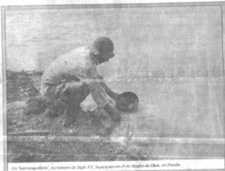
Un "barranquillero", ex minero de Siglo XX, busca oro en el río Madre de Dios, en Pando.

Tuvo una reunión de trabajo con el presidente del Consejo de ministros, Giulio Andreotti, asistió al almuerzo ofrecido por esa autoridad y posteriormente estuvo presente en la firma de los acuerdos. Luego de su conferencia de prensa, visitó la sede de las Organizaciones No Gubernamentales de Italia.