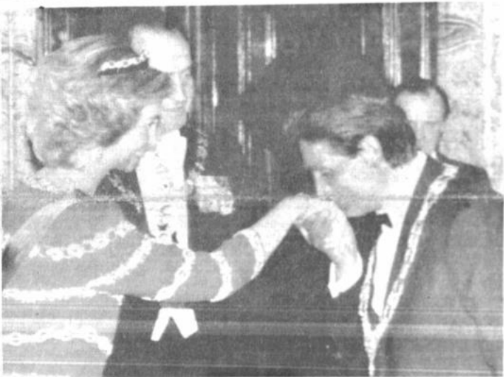
Jaime Paz Zamora besa la mano de la reina Sofía de España, mientras el rey Juan Carlos observa.

En respuesta a bloqueo económico del Kremlin a Lituania