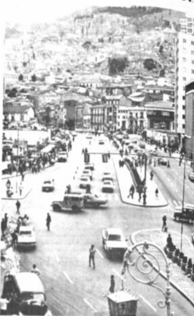
Los transportistas decidieron ayer efectuar un paro de 48 horas nacional en procura de lograr que el gobierno deje sin incremento en las tarifas del peaje en los carreteras del país.

Aseguró que ese incremento se aplica en la autopista de El Alto y en todos los caminos del país. Pa-