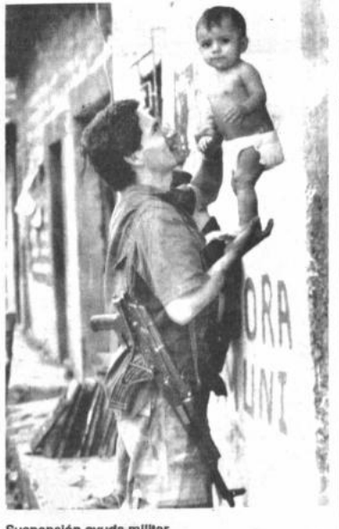
Suspensión ayuda militar Un miembro del FMLN juega con su hijo de ocho meses en la conflictiva zona de Chalatenango. Los dirigentes del grupo izquierdista pidieron al gobierno de EE.UU. la suspensión de la ayuda militar a El Salvador (San José de las Flores,).

La señora Violeta Barrios de Chamorro asumió hoy la presidencia de Nicaragua por el camino de la paz y el desmilitarización, en un período que comenzará el miércoles próximo y deberá finalizar el 10 de junio. Más maestros que soldados y más escuelas que cuarteles, dijo la señora Barrios de Chamorro durante su campaña electoral. Sus ofrecimientos de terminar con el servicio militar obligatorio, que durante una década atormentó a las madres nicaragüenses, aparentemente volvió los votos en su favor, según observadores. Violeta Barrios de Chamorro nació en la ciudad sureña de Rivas el 18 de octubre de 1929, en una familia acomodada local. Cursó sus estudios primarios y secundarios en Nicaragua, y más tarde se casó con el periodista Pedro Joaquín Chamorro Cardenal. Chamorro, un crítico de la dictadura de Anastasio Somoza y que fue propietario y director del diario La Prensa, fue asesinado por pistoleros a sueldo durante la dictadura en 1978. Su viuda debió cambiar las tareas de dueña de casa y madre de cuatro hijos por las de asumir la dirección del periódico, que ejerció hasta pocos años antes de su candidatura presidencial. El asesinato de Chamorro fue un importante factor de la insurrección popular que derrocó a la dictadura somocista de medio siglo, y desembocó en el triunfo de la revolución sandinista.