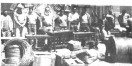
Entrega de material eléctrico

Destacó que el anuncio del gobierno de declarar una pausa ecológica, deja de ser un discurso para convertirse en una realidad con la reversión de esas tierras.