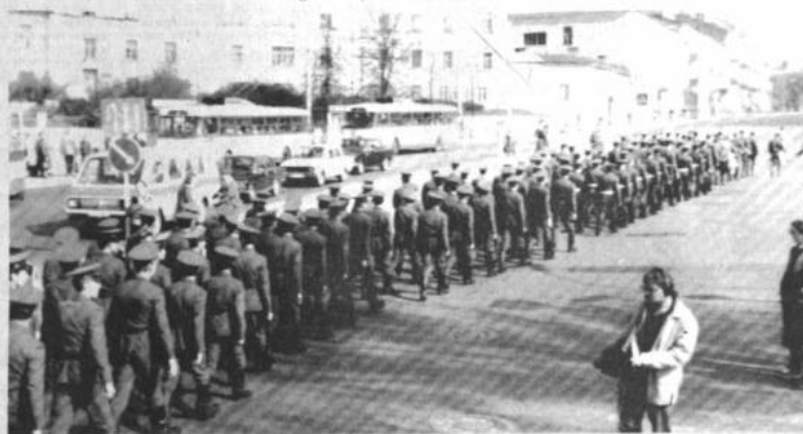
Anticipo de Lenin

Pravda, al observar que las quejas de la gente a Shevchenko "no recibieron la debida consideración", señaló que no es casualidad que ahora sea objeto de críticas.