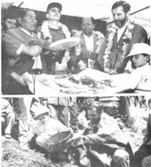
Día Mundial de la Tierra

Para solucionar en parte el paro del transporte urbano, fueron habilitadas camionetas, camiones y otros vehículos, desde y hacia la ciudad alicaña.