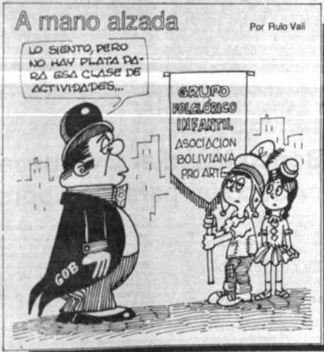
Por Rulo Vali

...de que te haya ...nacer de nuevo, ...viento sopla donde ...te oyes su silbido; pero ...de donde viene ni a ...Así le sucede al que ha ...del Espíritu". ...vuelto a preguntarle: ...¿cómo es esto? Res- ...Tu eres maestro en ...¿no entiendes esto? ...dijo, nosotros ha- ...de lo que sabemos, y ve- ...proclamar lo que hemos ...pero ustedes no hacen caso ...de lo que decimos. ...les hablo de cosas de la ...y no me creen, ¿cómo me ...pero si les hablo de cosas ...de la vida eterna, ¿cómo me ...creen? ...embargo, nadie ha subido ...al cielo, sino el que ha bajado del ...Hijo del Hombre. ...como Moisés levantó la ...en el desierto, así tam- ...necesario que el Hijo del ...sea levantado en alto, ...que todo aquel que crea en él ...la Vida Eterna. (Juan 3, 7-14)