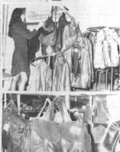
Feria de peletería y cuero

La Feria Nacional de Peletería y Cuero, inaugurada el pasado 18, se desarrolla con éxito en el Centro de Exposición y Comercialización de la Pequeña Industria y Artesanía (CECOPIA), en la Av. Camacho N° 1498, esquina Buena, de La Paz. La Feria es visitada por numeroso público que puede encontrar artículos de vestir de fina confección y variados modelos a precios del productor al consumidor.