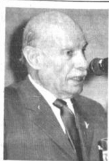
Ex presidente Walter Guevara

Insistió en que 1990 sea declarado un año de mucho vínculo con el exterior, para lograr el fortalecimiento de las relaciones internacionales.