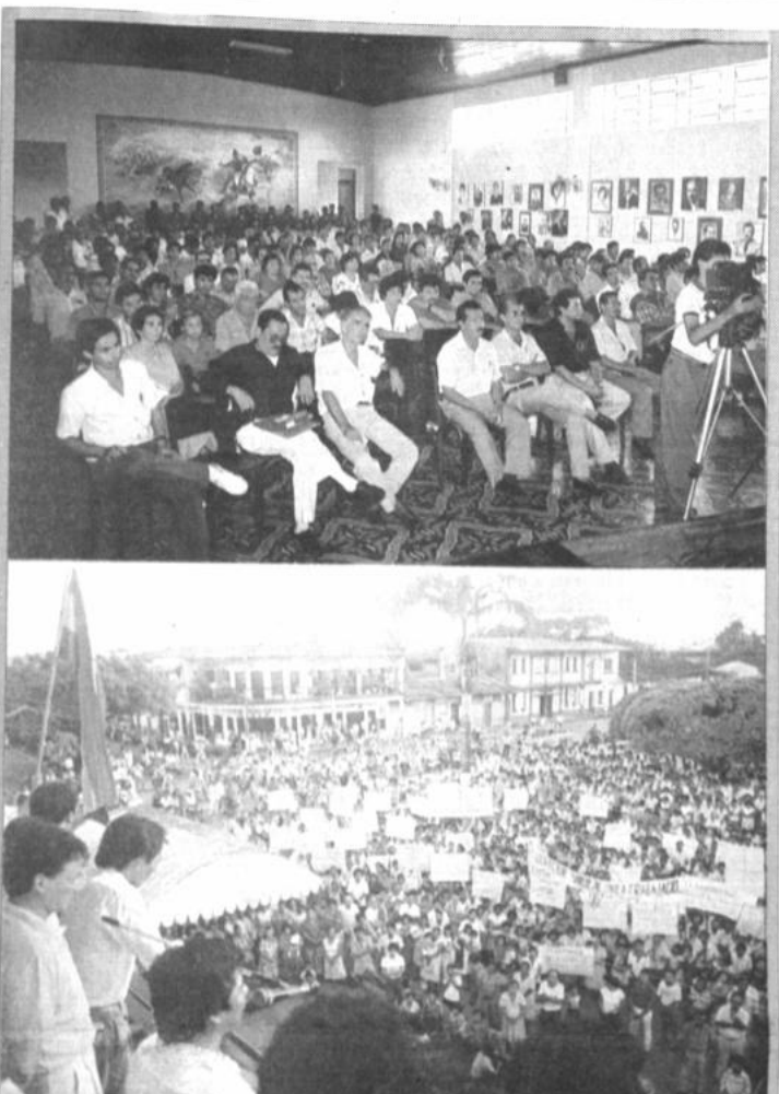
Conflicto en el Beni Mientras una "reunión consultiva" (foto superior) de autoridades y dirigentes cívicos del Beni rechazaba el sábado pasado en Guayaramerín cualquier intento de "desmembración" del territorio de ese distrito, en Riberalta (foto inferior) se realizó una manifestación en la que varios oradores volvieron a plantear la creación de un nuevo departamento en la llamada "región amazónica".

Esos estudios sostienen que la carretera Cobija-Puerto Maldonado sería la vía indicada para que Brasil y Bolivia salgan al Pacífico en condiciones muy favorables para sus exportaciones.