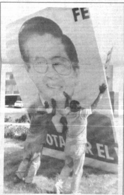
Dos operarios retiran un cartel de propaganda del candidato presidencial Alberto Fujimori, ayer, en Lima.