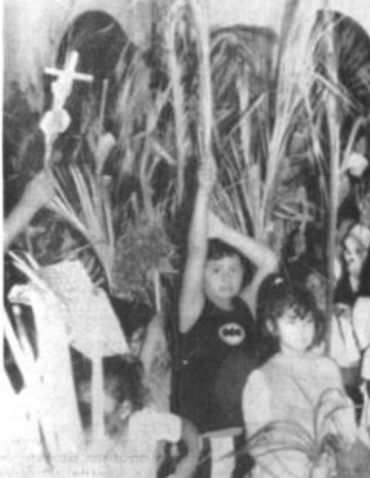
BENDICION DE PALMAS Y RAMOS