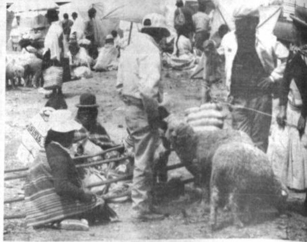
La avenida Elizardo Pérez de las villas Tupaj Katari y Huayna Potosí es escenario de la tradicional Feria de Ramos, donde lo más atractivo es la venta de animales.

Dirigentes de los ferroviarios y autoridades del Ministerio de Salud mantienen reuniones para encontrar soluciones al problema de la Caja de Salud de ese sector y -según Palacios- están buscando las fórmulas más favorables.