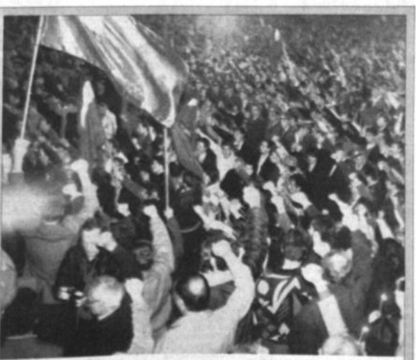
Demanda de independencia Decenas de miles de manifestantes pidieron ayer en Tiflis, Georgia, la independencia de esta república soviética, al conmemorarse la muerte de 20 manifestantes independentistas ocurrida hace un año.

En una votación simbólica, los asistentes alzaron los brazos y aprobaron la propuesta por aclamación. Sobre las cabezas de los asistentes flameaba un cartelón con la leyenda "Unión Soviética, prisión de naciones".