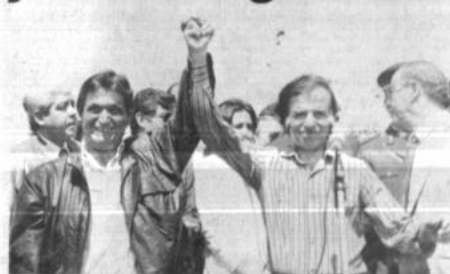
Paz Zamora y Carlos Saúl Menem en La Rioja

La prensa "riojana" destacó la visita del presidente Paz Zamora en su encuentro con Carlos Saúl Menem, expresando que "no sólo de relaciones monstruosas y contundentes se nutren los principales proyectos de los pueblos, sino que también los símbolos son necesarios para su cristalización".