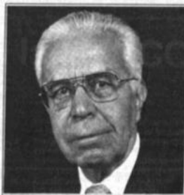
c. DR. VICTOR PAZ ESTENSSORO Líder indiscutible del Movimiento Revolucionario

"Confío en que el país comprende sería y responsablemente cuál es el desafío de esta generación", dijo al agradecer a los niños de la ciudad de Cochabamba que iniciaron una campaña de arborización. "Y gracias a todos los bolivianos que buscan y contribuyen a la forestación de las zonas devastadas", concluyó.