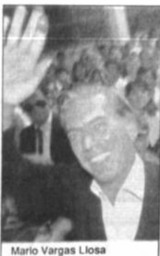
Mario Vargas Llosa

Vargas Llosa, líder de la coalición de centro-derecha Frente Democrático (FREDEMO), invitó a Fujimori a mantener conversaciones para "evitar" una segunda vuelta de las elecciones ante la semejanza de los programas económicos de los dos candidatos y los "inconvenientes" que ello ocasionaría al país.