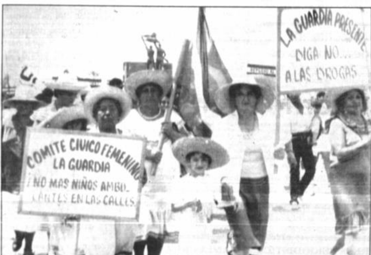
Día de la tradición. SANTA CRUZ, 8 (PRESENCIA). Fue multitudinaria la marcha en el Día de la Tradición donde se repudió al narcotráfico. En la composición niños y mujeres (algunas con tipos) luciendo sombreros de saó y con pancartas alusivas.

Otro objetivo del convenio es el apoyo a la creación de comedores populares, que signifiquen alimento para las familias de bajos recursos y para los ciudadanos indigentes.