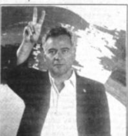
c. LIC. GONZALO SANCHEZ DE LOZADA Jefe Nacional del M.N.R.