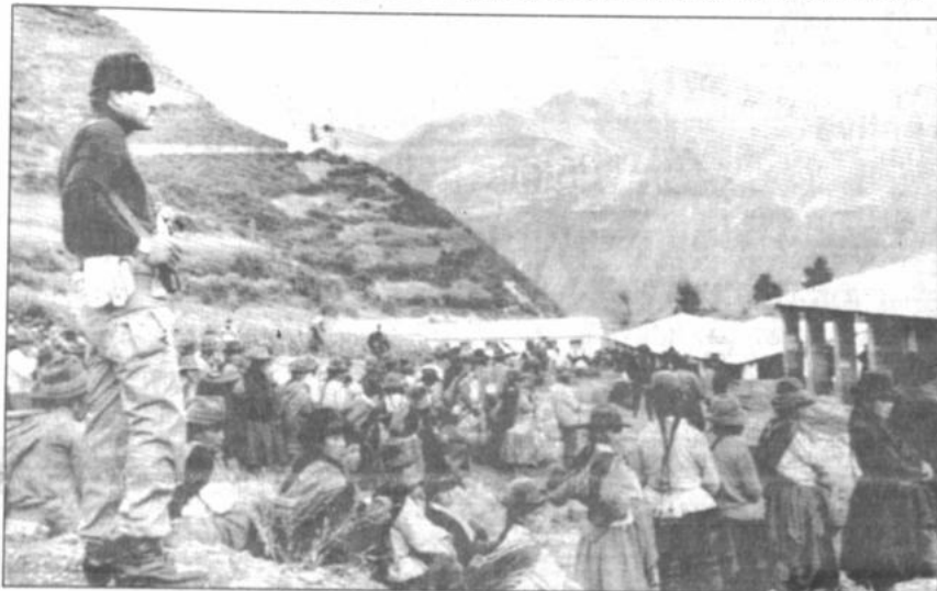
Elecciones peruanas Un soldado vigila en una de las poblaciones del Departamento de Ayacucho, mientras los campesinos hacían colas para votar. A pesar de las amenazas guerrilleras, los pobladores no tuvieron problemas para acudir a los centros de sufragio.

60% de electores votaron por la centroderecha. - Vargas Llosa ganó las elecciones con 35% promedio de los votos; Fujimori logró el 25%. - Tranquilidad en los comicios, pese a amenaza de Sendero Luminoso