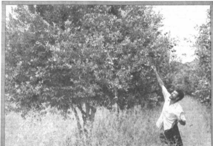
Cosecha en Espejos

"A partir de estas decisiones que hemos adoptado tendremos información mucho más completa y cabal para iniciar las acciones legales pertinentes. Como sabemos, el uso indebido de títulos profesionales o la usurpación de funciones están penadas por ley", indicó.