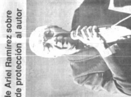
ARIEL RAMÍREZ, compositor argentino que recientemente visitó la Paz con el fin de concretar la ley de protección al autor.

FOLCLORE. En el Tanco Quinquicho se cumplió otra reunión folclórica con auspicio de la Prefectura del Departamento. El domingo estuvieron en el escenario los conjuntos "Sicre", "Choquisaca" y "Anzures".