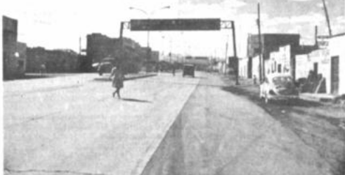
Problemas de iluminación

Finalmente indicó que todos los proyectos de desarrollo que se ejecutarán son coordinados con los dirigentes vecinales y cívicos para llegar con esos servicios en forma equilibrada a todas las villas alteñas.