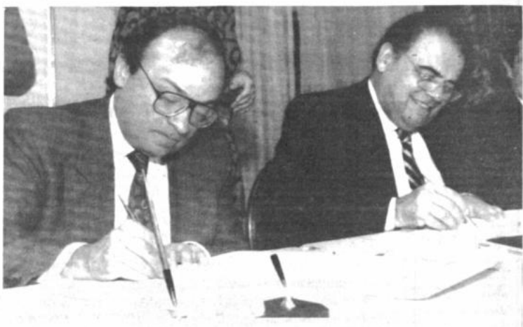
Préstamo BID. El ministro de Economía de Costa Rica, Rodrigo Bolaños (izq.) y el presidente del Banco Interamericano de Desarrollo, Enrique Iglesias firman un préstamo por 18 millones de dólares. (Montreal, teléfono REUTER).