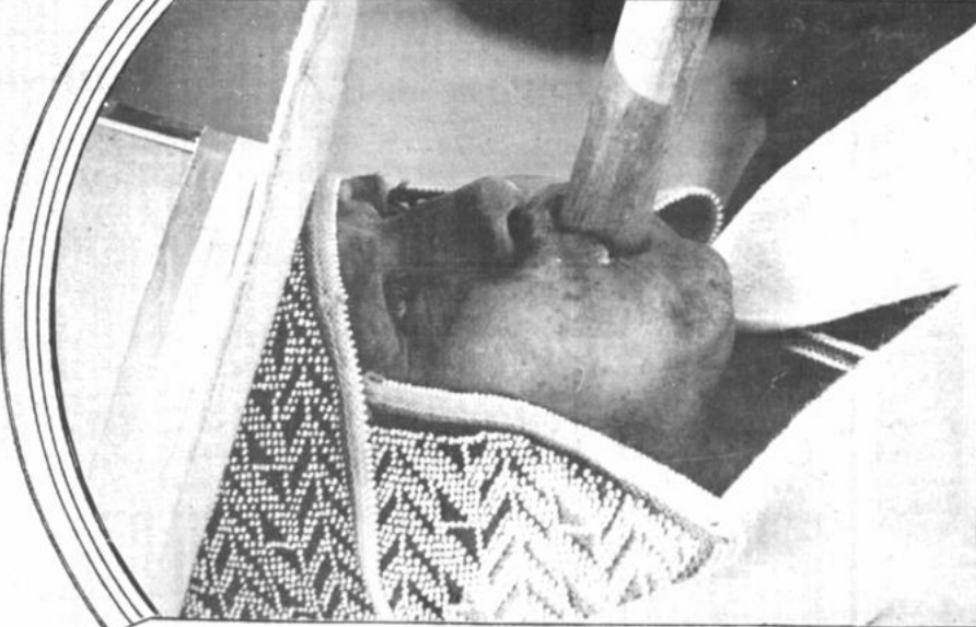
MÚSICA AUTOCTONA. La Prefectura del Departamento continúa con el auspicio de funciones folclóricas con el título "mi pueblo en la capital". El domingo se presentaron "Sicre", "Choquisaca" y "Anzures". La expresión genuina del folclore boliviano cobra realce en estas demostraciones del arte vernacular.