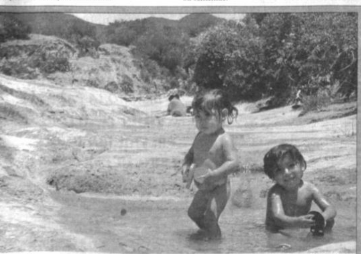
niños de la región de Tembladera (provincia Vallegrande de Santa Cruz) juegan con agua estancada después de las recientes lluvias. Las precipitaciones, sin embargo, no han sido suficientes para superar los efectos de la prolongada sequía que afecta a esa región.