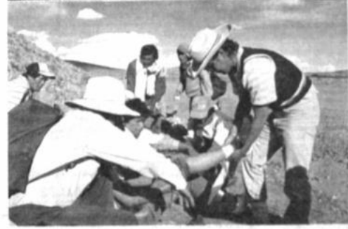
Marchistas En pos de reivindicaciones regionales un grupo de marchistas marcha desde Cotagaita y pide la solidaridad del pueblo boliviano para que el gobierno escuche sus demandas y dé una respuesta positiva a sus pedidos, que consisten en la instalación de una planta hidroeléctrica y atención en el campo de la salud, educación y comunicación. El grupo es visto en las fotografías en el tramo Oruro-La Paz.