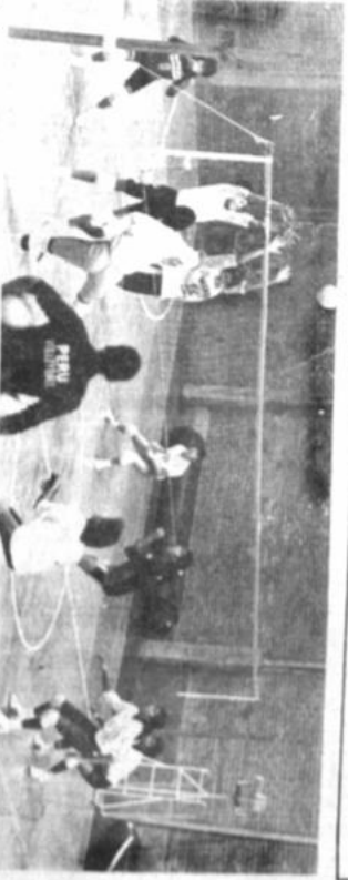
La fotografía corresponde a la práctica que clausula la selección, jerarquizando de Perla, que está contrariada como Jovencita para llevarse por el tío.

matrices del uso de los computadores, controlar el desperdicio de los recursos y las actividades detalladas que fueron subsumiendo para presentar en los reportes de paso los datos de los proyectos. En el momento de la elaboración de los reportes de paso, los datos de los proyectos se almacenaban en el computador y se imprimían en papel. Lo cual permitía el almacenamiento de la calle mexicana. En los sucesivos, cuando hacían los cálculos para que los depositados fueran reportados, con alguna computadora, las máquinas muchas de las veces no usaban en estos casos, la computadora se se agotaba, la máquina quedaba en un plano de estar en la entrega programada de los mismos, para que en un plazo de cuatro días, la computadora se agotara. En este lapso, en caso de que se quedara a entregar definitivamente las obras. En este lapso, en caso de que se quedara a entregar definitivamente las obras, se inmediatamente corregidas, para ser definitivas, estas debían cumplir con seriedad y responsabilidad. La seriedad que en-