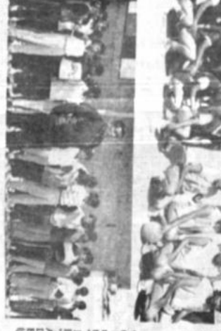
servicio y es una se celebró ayer el 46 aniversario del Club de Fútbol de España. La ceremonia central se efectuó en las dependencias deportivas de este club, rodeados en Montecarlo. En las

16, 75-92da. de Ascer. Serie TF, Salud TF M55AAV TF, Hs. 9-15 Tra. de Ascermo Cecodosto vs. Direc. Gral. Admnia. Hs. 10-30 de Honor de Honor Defnana. vs. Teso- reros. Hs. 1-43 Tra. de Honor CADI vs. Inq- s. respectivos. Hs. 1-300 2da. de Ascer. Serie SAAVRA El Alfo vs. Min. sin carulo. vs. 1-15 2da. de Ascer. Serie INVALCO vs. Farmacias. Hs. 15-30 2da. de Ascer. Serie vs. EMOR. Hs. 16-45 2da. de Pinaura vs. Contralora vs. ESTMAC. Reges. Jani Rosenberg. Roedgerg (pnt) vs. Alentier. Ptscales. Jani Victor Amiller