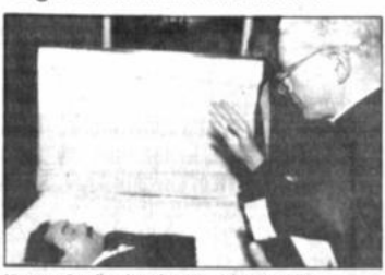
Un sacerdote bendice el cadáver de Jaramillo.

Bernardo Jaramillo, candidato presidencial de la Unión Patriótica, fue ametrallado ayer en Bogotá. - "Grupo Gonzalo Rodríguez Gacha", del cártel de Medellín, autor del atentado, según llamadas anónimas