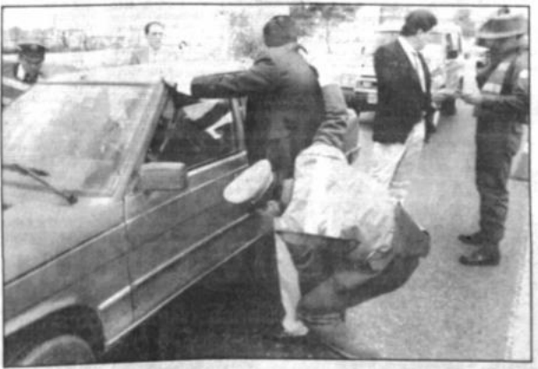
Control policial Policías colombianos registran a personas cerca del aeropuerto de Bogotá, poco después del atentado contra el candidato izquierdista Bernardo Jaramillo.