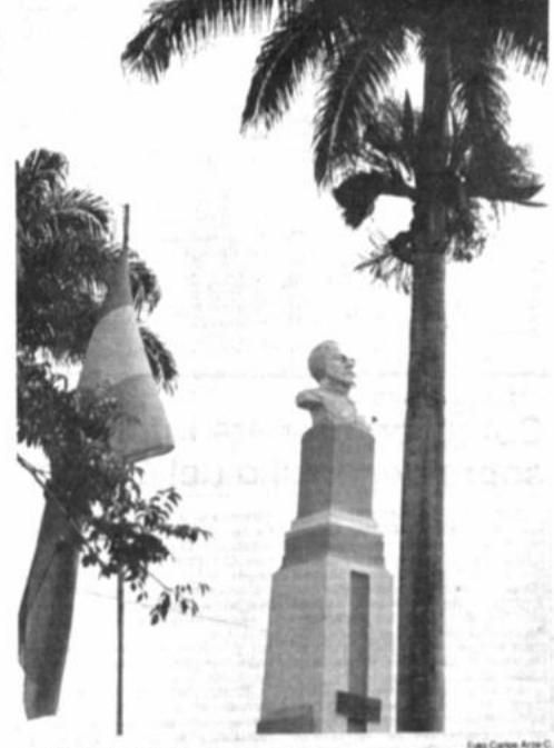
Integridad de Pando El Comité Cívico de Pando, en un pronunciamiento público, sostuvo que defenderá vehementemente la integridad territorial del departamento Pando. La advertencia surgió como consecuencia de los planes para crear un nuevo departamento en el norte de Bolivia que afectaría provincias pandinas. En el gráfico el monumento principal de Cobija, erigido en homenaje al presidente José Manuel Pando.