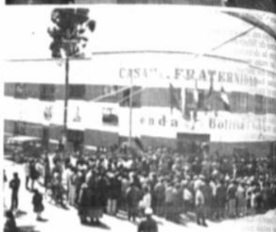
El presidente intervino de la República, el alcalde de El Alto, el embajador de Francia, cortan la cinta de inauguración de Casa de la Fraternidad.

realizaron una serie de actividades para recaudar fondos destinados a ayudar a los de la ciudad de El Alto, con el único objeto de