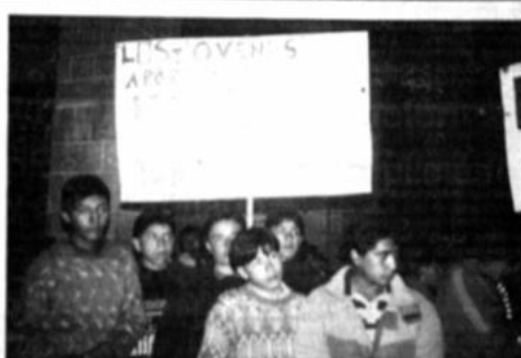
Peregrinaciones a Obreros

Los viernes por la madrugada, desde el pasado 2 de marzo, jóvenes de diversos barrios de La Paz y El Alto peregrinan a la parroquia de la Exaltación de Obreros.