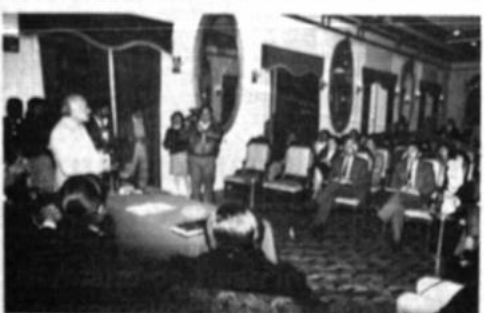
Apoyo a la niñez

En esa oportunidad se pronunciaron en favor del plan todos los directores de los medios de comunicación social.