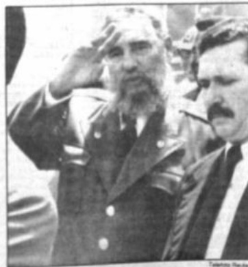
El presidente cubano Fidel Castro defendió enérgicamente la revolución de su país.

El congreso soviético dijo que la declaración lituana quedaba invalidada por los artículos 74 y 75 de la constitución de la Unión Soviética que establecen la primacía de las leyes soviéticas sobre las de las repúblicas.