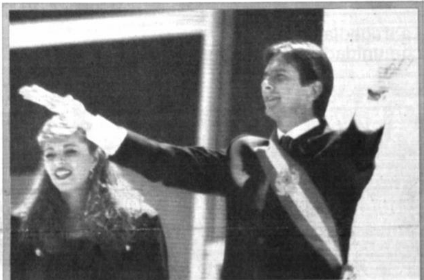
Nuevo presidente Fernando Collor de Mello y su esposa Roseane salieron desde el Palacio de Planalto, en Brasilia, después de convertirse ayer en los nuevos presidentes y primera dama de Brasil.

El país ha acumulado la deuda externa mayor del tercer mundo, con 114.000 millones de dólares, y los intereses atrasados sobre ese montante ascienden ya a 6.000 millones de dólares.