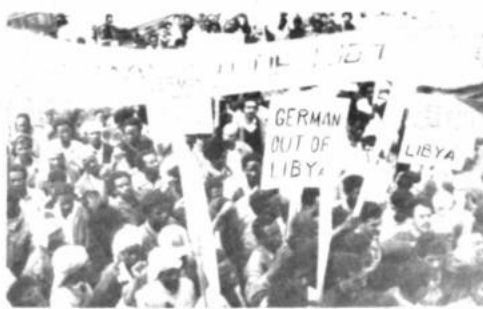
PROTESTA. Trípoli, 15. Manifestantes libaneses corrieron durante una protesta frente a la embajada alemana occidental. Khadafi acusó a los servicios de inteligencia de Alemania Occidental de haber causado el incendio de una fábrica de químicos en Rabta.

La Yihad islámica, que es la fuerza más poderosa de Beirut, dijo que el incendio fue un sabotaje por parte de la Yihad islámica.