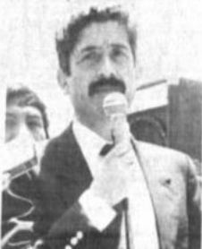
En el acto preparado por el Comité Cívico, que se realizó en la Zona 16 de Julio, el departamento Fernando Cajías anunció que la prefectura colaborará en algunas obras en El Alto.

Con respecto a los convenios establecidos que los participantes pagarán por el transporte de los alimentos, el valor de los alimentos seguro contra accidentes bajo.