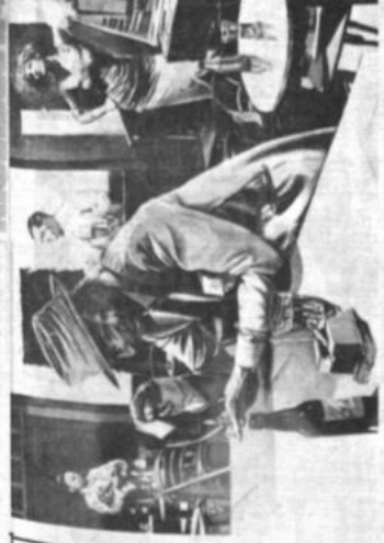
"EN ALTA BAR" es el nombre de este cuadro del pintor Mario Conde, que se exhibe actualmente en una muestra colectiva de artistas paraguayos, realizada en Espacio Portales (Av. 16 de Julio 1607).

La documentación destinada a la impresión del catálogo deberá estar en poder de los organizadores antes del 31 de mayo, y las obras antes del 31 de mayo. Participar deberán acudir a la dirección del Museo Nacional de Arte, ubicado en la calle Comercio.