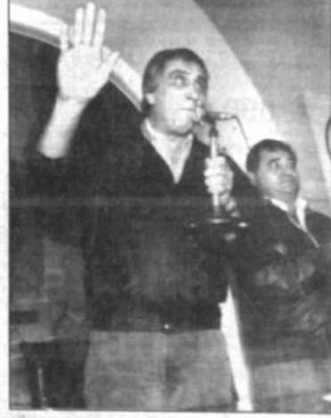
Amenaza sindical El líder sindical argentino Saul Ubaldini amenazó ayer con convocar a masivas protestas si el gobierno de Carlos Menem no cambia su postura política económica.