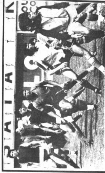
Con miras a la Libertadores Integrantes del Club The Strongest volverán hoy a los entrenamientos con miras a su difícil encuentro frente a Oriente Petrolero el próximo miércoles en el inicio de la Copa Libertadores.