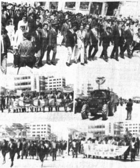
Las principales entidades de la ciudad de El Alto, se congregaron en el desfile cívico que contó con la presencia del presidente de la República, Lic. Jaime Paz Zamora, ministros, diputados, concejales y población de la nueva ciudad.