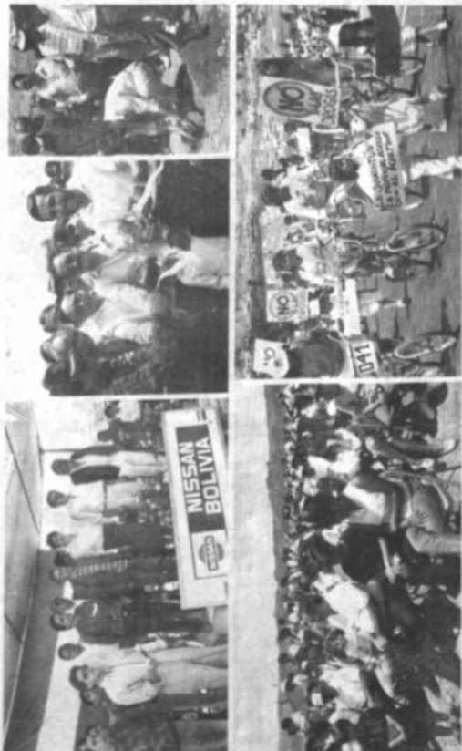
Alto Irapavi Esta es la hermosa región de Alto Irapavi (sur de La Paz), donde se inauguró ayer la pista del kartódromo. Abajo: Pilotos de karting en una de las pruebas de exhibición de la Asociación de Karting de La Paz.