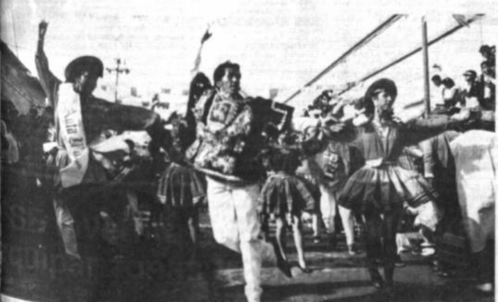
Espectáculo del carnaval en las ciudades de Oruro, Tarija, Cochabamba y Sucre, se realizaron una serie de actividades, despidiendo el año 1990. Entre ellas, grupos folclóricos, el corso de niños, el Corso de Corsos y otras, cerraron esta magnífica fiesta carnavalesca y colorida, hasta el próximo año.

El mejoramiento vial, indispensable para integrar esos centros productivos con los mercados departamentales y nacionales, y mejoramiento de los sistemas de agua de Montegudo y Padilla, hallan en la agenda de la futura cooperación de CARE, avizor Díez Canseco, remitiéndose al análisis de la iniciativa surgida en la Corporación Regional de Desarrollo. Por ahora buscan dar continuidad a nuestros convenios, cuyos resultados han sido ampliamente satisfactorios", finalizó el funcionario.