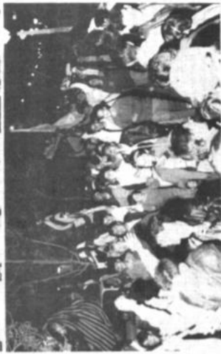
La fiesta del pueblo El pueblo paceño vivió una fiesta inolvidable. Miles de aficionados celebraron el título obtenido por The Strongest tras derrotar a Oriente Petrolero, en Cochabamba, por 1-0. Arriba: fotografías fueron tomadas en El Prado.

Anuncie en PRESENCIA agencias en todo el país