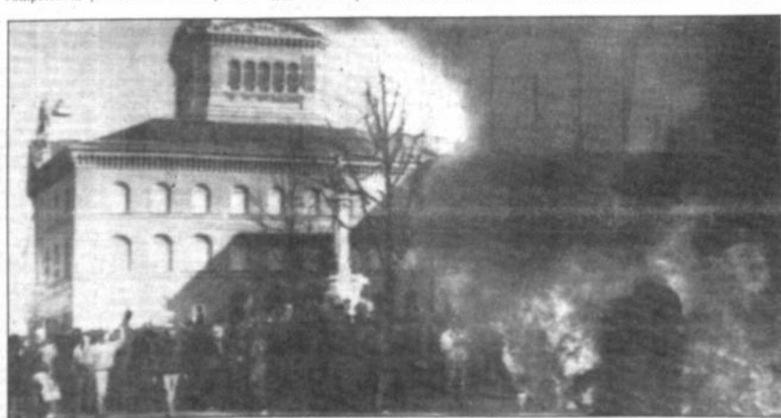
Registros clandestinos Un carro en llamas frente al parlamento suizo, fotografiado el sábado por la tarde, luego que manifestantes le prendieron fuego. Alrededor de tres mil personas protestaron en la capital suiza contra el registro clandestino de actividades culturales y políticas, hechas por la Policía Federal en las pasadas décadas. Las investigaciones comenzaron hace algunas semanas, hicieron evidente que una mayoría de los ciudadanos suizos tienen registros clandestinos que contienen innecesarios detalles.

Los docentes pacheños arguyen que aún no está solucionado el problema del bono de Bs 300, persiste la "injusticia salarial" y hay incumplimiento de las leyes en la institucionalización de los cargos jerárquicos.