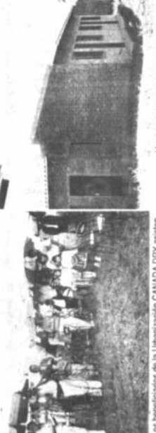
Un veta de las viviendas entregadas