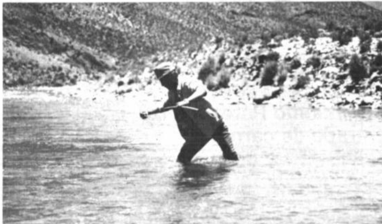
Río Lauca. Una autoridad comunal de la zona fronteriza con Chile, apoya el trabajo de PRESENCIA, para constatar la profundidad del río Lauca. Cruzando por un sector y mediante una medida, señaló que existen 50 centímetros de profundidad por unos 15 metros de ancho. La fotografía es elocuente: al mostrar a la autoridad comunal con las aguas hasta la rodilla. Asimismo, otras autoridades cantonales próximas a las serranías del majestuoso Sajama mostraron su preocupación, tanto por el nivel de las aguas como por futuras acciones contra el derecho de las aguas internacionales.

Con la ejecución de estos trabajos se busca iniciar un programa destinado a mejorar la migración de mayor número de familias campesinas a las regiones fronterizas, donde a la fecha existe reducido número de pobladores, que son los únicos que se constituyen en los centinelas de la frontera, expresó el Prefecto orureño. Antecedentes del Plan de Soberanía y la posibilidad de la ejecución de los proyectos, fueron conocidos por los comunarios y autoridades campesinas, durante el viaje de la comisión destacada por la Prefectura de Oruro, hasta el río Lauca, este último fin de semana.