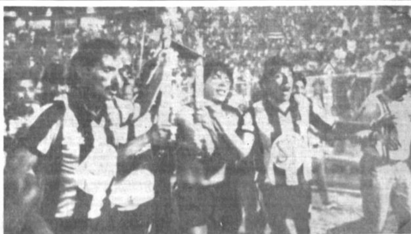
The Strongest, campeón Los jugadores del equipo pacheño inician la vuelta olímpica en el estadio Félix Capriles, de Cochabamba, tras vencer a Oriente por 1-0 y ser proclamados campeones nacionales de la gestión 1989.

Los "contras" antissandinistas anuncian el comienzo de su desmovilización, luego de casi una década de lucha contra el gobierno de Nicaragua (página 6).