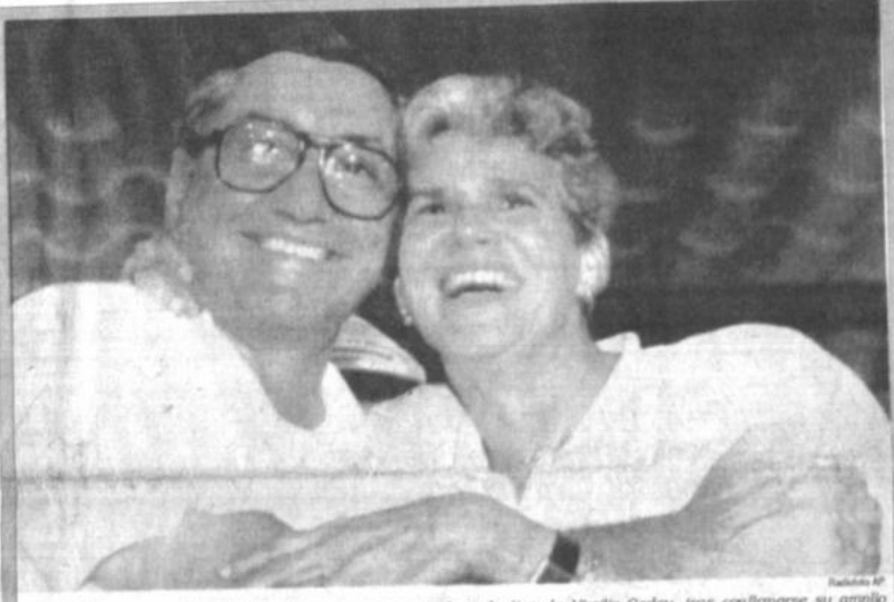
Violeta de Chamorro (derecha) se abraza con su compañero de fórmula Virgilio Godoy, tras confirmarse su amplio triunfo en las elecciones nicaragüenses del domingo pasado.

En un emocionado discurso que hizo derramar lágrimas a muchos de los asistentes, el presidente Daniel Ortega dijo a entender que a pesar de la derrota en las elecciones presidenciales de ayer, la iniciativa sandinista fue un gigantesco paso adelante para