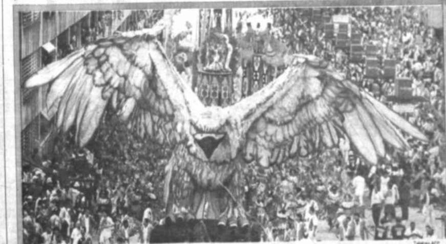
Carnaval. Una gigantesca águila, símbolo de la escuela de samba "Portela", y cerca de 5.000 sambistas abren el desfile de esta escuela, ayer, en el "sambódromo" de Rio de Janeiro, donde prosigue el carnaval.

Menem impulsó, asimismo, planes para privatizar buena parte de las empresas estatales, creadas hace cuatro décadas por el peronismo.