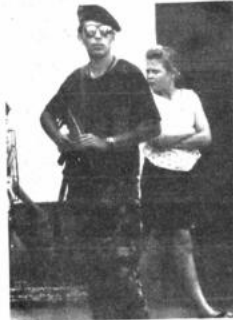
Control Buenos Aires 22. Un policía antiterrorista monta guardia en el centro de San Miguel.

Los pueblos más afectados son Santo Tomás, Colquemarca, Llucio y Chamaca, en Chumbivilca, y Quinota, Llucio, Piliquia y Qindoroma, en Espinar, dijo el informante.