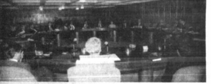
Ejecutivos de la Cámara de Comercio de EE.UU. que llegaron al país, durante la reunión con miembros del gobierno, empresarios nacionales y parlamentarios.