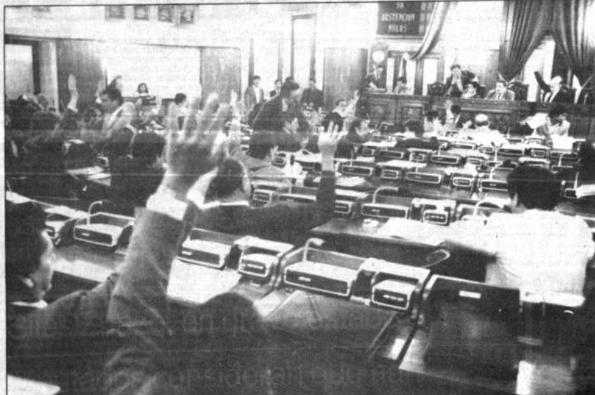
Ultima sesión de diputados

La Cámara Baja, en su última sesión ordinaria realizada ayer, aprobó apresuradamente varias leyes en favor de algunos distritos. En la oportunidad, los diputados eligieron a sus representantes en la Comisión de Congreso.