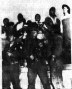
Proselitismo Bogotá, 22. El pre candidato presidencial liberal, César Gaviria (centro, arriba) habla durante un acto proselitista.

La situación de orden público por que ha existido en el momento. El ejército no está pudiendo ganar la guerra y es difícil que la esté perdiendo", dijo Gómez Hurtado, dos veces candidato presidencial, en una entrevista que será divulgada esta tarde por televisión.