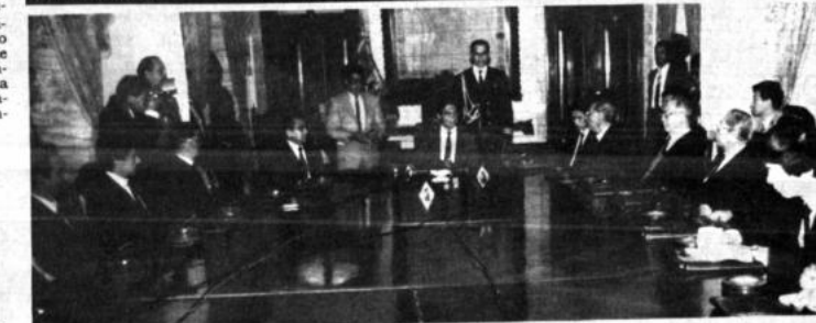
Representación de China El presidente de la República, Jaime Paz Zamora, (centro) dialoga con miembros de la misión de parlamentarios chinos en el salón del gabinete de ministros.

Recordó que el mes de noviembre, hubo elecciones municipales que ha impedido "cumplir con el trabajo y que, por el corto tiempo, no se pudo apreciar la labor de