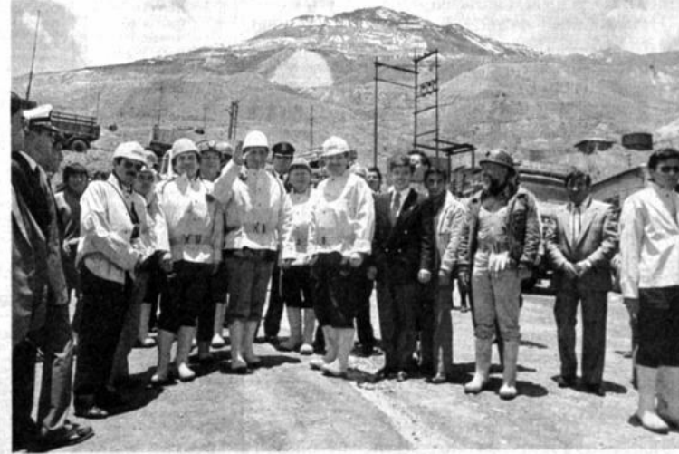
Visita al Cerro Rico La reciente visita que realizó el presidente de la República Jaime Paz Zamora, junto al ministro de Cooperación del gobierno de España, Luis Yáñez Barnuevo, a la ciudad de Potosí, ha causado expectación en la población por el anuncio de que el gobierno español financiará el proyecto vial Tarapaya-Challapata, que integraría a Potosí con Oruro y La Paz.

Pese a la propuesta de que, si se les otorgaba, la Caja del Chofer ampliaría sus servicios a otros sectores de la población, los delegados consideraron que el sobreprecio es un aporte que se creó con la finalidad de arreglar el pésimo estado de las calles, especialmente del centro de la ciudad. En ese sentido se exhortó a los transportistas a continuar dando también el aporte, como miembros de la sociedad.