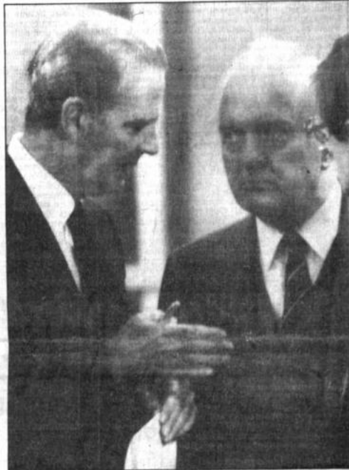
Acuerdo EE.UU. y sus aliados con la URSS y la RDA acordaron ayer la unificación de Alemania. James Baker (izquierda) y Eduard Shevardnadze realizaron intensas consultas, antes de anunciar el acuerdo, en Ottawa, Canadá.

En Bonn, el canciller de Alemania Occidental, Helmut Kohl y el primer ministro comunista Hans Modrow se reunieron para discutir la unidad monetaria. Ambos acordaron establecer una comisión para estudiar formas de transformar al marco de Alemania Occidental en la moneda oficial de Alemania Oriental.