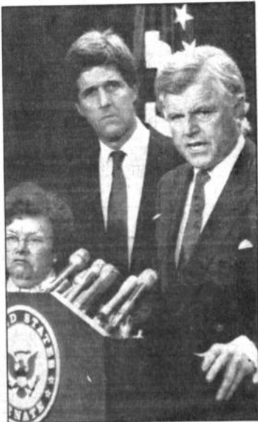
Por la solución política

En ese lugar, el único acceso terrestre posible consiste en atravesar la escuela naval de cadetes "Almirante Padilla".