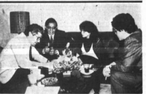
Donación china para la policía

Se elabora un proyecto de pre-factibilidad apoyado por el Banco Interamericano de Desarrollo, que servirá para fortalecer a los distritos de Tarija, Sucre y Potosí.