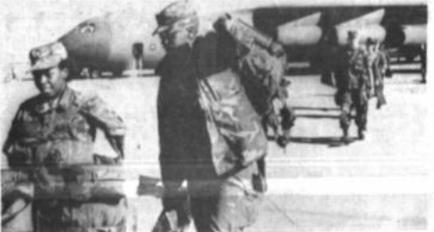
Médicos militares de Estados Unidos

La misión de médicos odontólogos está asentada en la base militar de Chaguaya de la Armada Boliviana.