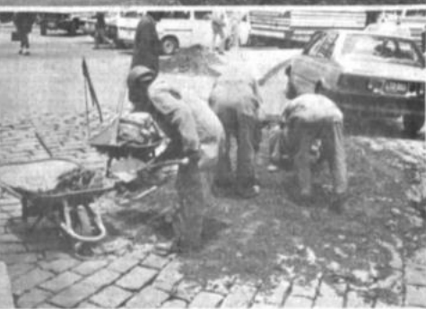
La tormenta que azotó a la ciudad de La Paz causó desprendimiento de adoquines, los cuales fueron colocados en su lugar por los obreros de la Alcaldía.