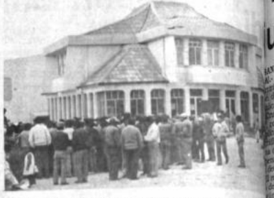
La alcaldía de la ciudad de El Alto, no fue incorporada a su puesto General de la Nación.

El jueves por la mañana se inaugurará el primer congreso de municipios del departamento de La Paz, en la ciudad de El Alto. Asistirán los representantes