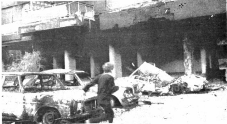
Enfrentamientos en Beirut

"La fecha de su libertad se determinará con carácter de urgencia", dijo el ministro Viljoen a la prensa.