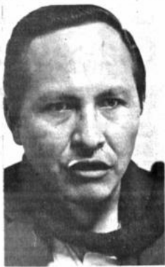
Victor Hugo Cárdenas

dirigentes indicaron que conside- ran que se debe discutir la posi- bilidad de adoptar el sistema electoral o mexicano donde el Estado contribuye al funciona- miento de los partidos políticos; que se garantice el acceso a los medios de comunicación social con una regulación y frecuencia de espacios para que las cam- pañas políticas no se conviertan en anuncios comerciales como ha ocurrido en el pasado reciente. Otros planteamientos de este grupo político se refieren a la elección directa del presidente que establece la Constitución Po- lítica del Estado, con el 53% de votos, que según los dos delega- dos trae distorsiones profundas para el sistema político. Para es- to, dijo, hay dos opciones: la segunda vuelta o reducir el por- centaje con el que se elige al pre- sidente. También están de acuer- do en la edad de 18 años para que el ciudadano pueda acudir a elec- ciones. El ministro Capobianco, al ex- presar su preocupación por la asistencia de los representantes de Izquierda Unida a esta consul- ta política, dijo que esta instancia es fundamental para sentar las bases del proyecto de reformas a la Ley Electoral. Esta etapa ter- minará el viernes con el preside- nte de la comisión MIR-ADN, pe- ro que también se ha invitado a Conciencia de Patria y a la Unión Cívica Solidaridad, además de otros partidos políticos.