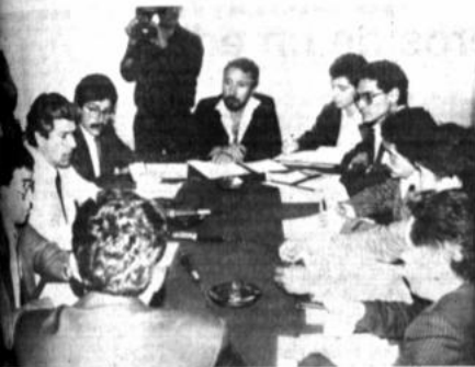
miembros de Izquierda Unida, dialogaron con ministro del Interior so- bre reformas a ley electoral.

Anunció que iniciará un quere- lado criminal contra Zapata "obli- gándolo a que presente las prue- bas que él ha indicado tener" por- que no son evidentes las denun- cias del diputado disidente del MNR.