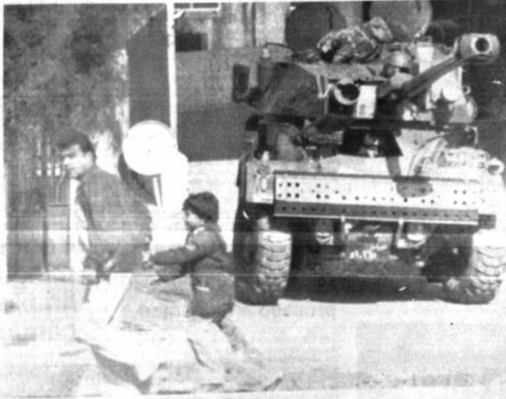
Tanques en las calles de Beirut

Manifestantes, unos 400 según la policía, eran de una tribu de 5.000 que acudió al sitio de Waikanae para celebrar los 150 años de la fundación de Nueva Zelanda.