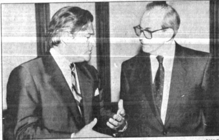
Relanzar Cuenca del Plata

Expresó que lo ideal sería que el presupuesto sea aprobado a la brevedad, a fin de garantizar la buena marcha del Estado, pero esa situación "no está" en manos del gobierno, y corresponderá a los parlamentarios del oficialismo y oposición ver si lo aprueban rápidamente.