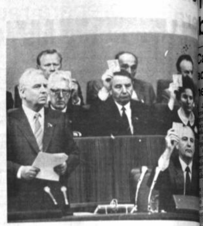
La jerarquía soviética. En el presidium Mijail Gorbachov, Secretario General del PCUS, en la inauguración de la Conferencia Nacional del Partido Comunista Soviético.

Los frentes populares de las repúblicas del Báltico están centrando cada vez más su atención en la independencia total de la Unión Soviética gobernada por los rusos.