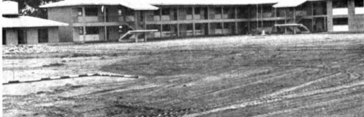
Colegio salésiano En ceremonia especial fue inaugurado y bendecido el colegio fiscal "Santo Domingo Savio" que pertenece a las "Escuelas Populares Don Bosco". Consta de 17 aulas, talleres para enseñanza técnica, laboratorios, oficinas para administración, ambientes para los maestros, una batería deportiva. Fue construido con una inversión de $US 271.472.93 de los cuales $US 99.500 fueron aportados por el Fondo Social de Emergencia. Se encuentra ubicado en Villa Loreto, al sur de la ciudad junto a la iglesia de María Auxiliadora.