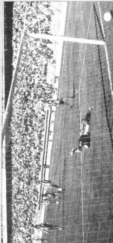
El primer gol

Fue cuando restaba un minuto para la finalización del partido. La pelota impulsada por Eliseo Aguirri penetra en la valla junto al poste. El arquero Solís se arroja sin poder evitar el tanto.