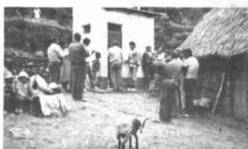
Uno de los 751 baños higiénicos familiares entregados en Yungas. Consta de inodoro, lavamanos y ducha. Funciona mediante un sistema de cámara séptica, con arrastre de aguas y pozo de absorción.

Finalizó etapa de Proyecto de Desarrollo Sociocomunitario