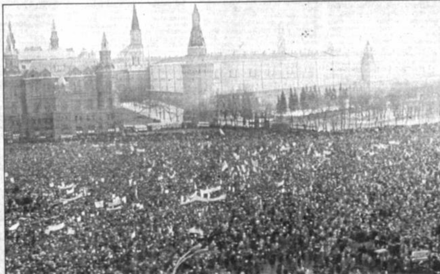
Protesta en Moscú

Aproximadamente 100.000 personas se congregaron ayer en la Plaza Roja de Moscú, para demandar reformas democráticas en la URSS. Se anunció que nuevas movilizaciones se realizarán en los próximos días. (Página 7).