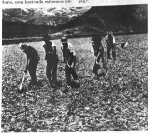
Un solo tractor Lamentablemente un solo tractor descompuesto llegó hasta la provin- cia Azurduy. Por ello la labor del agricultor continúa como en los antiguos tiempos con el sistema de "yuntas" y en la mayoría de los casos como esta fotografía, con la fuerza del hombre.

ra mantener e impulsar las actividades culturales, folclóricas y religiosas: "Ya se estaban olvidando del charango. Antes con eso no-ller. Las costumbres de la cultura también está desapareciendo porque, hay jóvenes campesinos que se van para la Argentina o Santa Cruz y regresan con otra ropa, con grabadora y su música de moda".