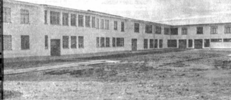
Parcial de las instalaciones del "Hogar Sagrado Corazón", a cargo de las misioneras de la Institución Benéfica del Sagrado Corazón de Jesús, que está situado en el sector sur-este de la ciudad de Oruro.

Esta es la fiesta de nuestra Iglesia, de la que nos gloriamos de ser parte, de esta Iglesia a la que no queremos calificarla de otra forma, sino como la calificaron las generaciones en veinte siglos: Iglesia Católica, Iglesia Apostólica, Iglesia que tiene su unidad y su centro en el Obispo de Roma; está es la Iglesia a la que nosotros pertenecemos y a la que deseamos que sea cada vez más viva, más fuerte, más extraordinaria en su presencia transformadora, no por agradar a los hombres, sino por ser fieles a la voluntad de Dios que nos ha pedido construir su reino aquí y ahora, con esfuerzo de todos y con la unidad de todos, como familia verdadera de Dios nuestro Padre, como hermanos que nos reunimos para cumplir y hacer lo que el Señor nos pide, enlazió el presidente de la Conferencia Episcopal Boliviana.