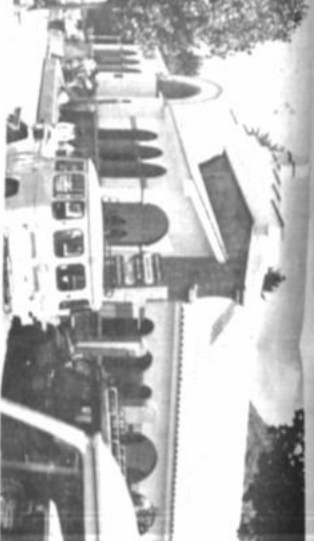
MUSEO ANTROPOLOGICO. En la ciudad de Oruro se inauguró el Museo Antropológico. El museo está ubicado en la calle Lora 380 y tiene una superficie de 1.500 metros cuadrados. El museo está equipado con 10.000 ejemplares de libros, revistas y documentos. El museo será administrado por el personal de la Facultad de Derecho de la UAGRM.

REINICIO DE LA MASCARA Y EL DISFRACE. En el marco de la exposición "El mundo de los niños" y "narrativo", se presentó una muestra de máscaras y disfraces. La muestra fue inaugurada el día 10 de febrero.