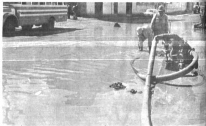
Obreros del retén de emergencia bombean aguas estancadas de la lluvia en la Av. Esteban Arce, villa Alto San Antonio.

Pide también al alcalde que ordene al intendente municipal que disponga la vigilancia permanente del bosquecillo de Pura Pura mediante un grupo de gendarmes, quienes deben recorrer constantemente la zona, para cuyo efecto solicita vehículos y otros elementos logísticos.