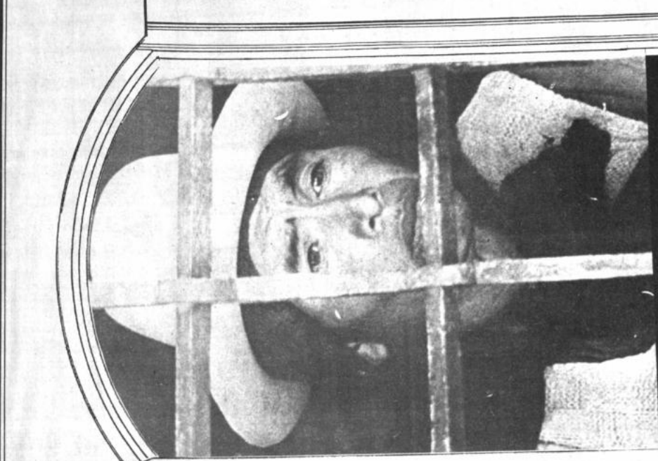
FOTOGRAFÍA tomada por el artista Aldo Cardozo quien ofrece una muestra en la Casa de España, como parte del programa cultural llamado a recordar el desamortamiento de América. Las actividades encaminadas a recordar el desamortamiento de América, a artistas nacionales y extranjeros, se realizarán en la Casa de España, en la ciudad de La Paz, Bolivia. La inquietud de quienes están al frente de instituciones hispanas en Bolivia.