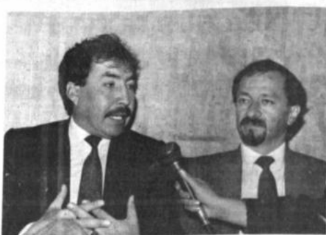
Misión de la OMS