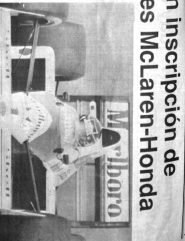
El piloto británico Nigel Mansell, durante uno de los grandes premios de Fórmula Uno, fue rechazado por la FISA.

LIMA, 20 DE ENERO (AP). Unión Huaral al derrotar por 3-0 al Almirante Miraflores, tiene la primera victoria, invicto, en la liga de fútbol que se determinará el segundo equipo peruano que participará en la Copa Libertadores de América. Los jugadores de Unión Huaral, en su primer partido, jugaron un buen partido, lo que les permitió ganar 3-0 al Almirante Miraflores. Los jugadores de Unión Huaral, en su primer partido, jugaron un buen partido, lo que les permitió ganar 3-0 al Almirante Miraflores.