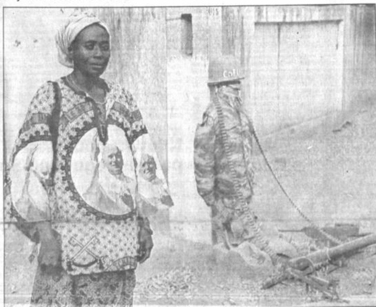
Espera al Pontífice

Critica severamente las políticas respecto al Tercer Mundo que se guían exclusivamente por objetivos económicos