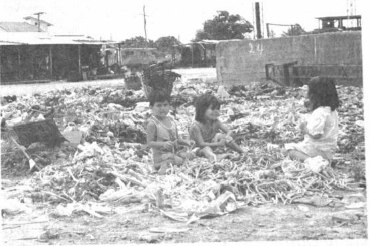
Distracción y trabajo. Estos niños, que no conocen otros alborozos ni otras comodidades que las de acompañar a sus padres en el duro quejido por la vida, encontraron este basural en las proximidades del mercado "Abasto", en una populosa zona de Santa Cruz, para escurrir los residuos y de ellos sacar algo para la olla familiar, como quien dice que están jugando..

6.- Declarar la necesidad de suscribir contratos con las comunidades organizadas, productores y empresas nacionales para la explotación de Ulexita a partir del 29 de enero, como prioridad para el directorio de CIRESU. Por otra parte, en las últimas horas ha viajado a la ciudad de La Paz una comisión del Comité Cívico Potosinista para plantear al directorio de CIRESU, así como al ministro de Minería y Metalurgia la realización de una reunión nacional cumbre en la ciudad de Potosí que se realizaría del 12 al 15 del próximo mes de febrero para recién adoptar decisiones últimas en torno al contrato con la LITHCO de los Estados Unidos para la explotación del litio en el gran salar de Uyuni.