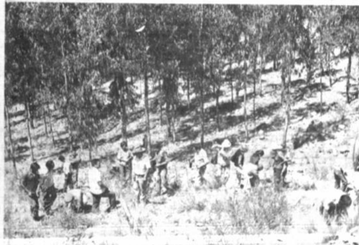
Loteadores clandestinos intentan vender terrenos en Pura Pura

Pese al despliegue del retén de emergencia, que confrontó una gran cantidad de equipo y de bombas que impidió la atención a zonas donde se requirió de dicho retén.