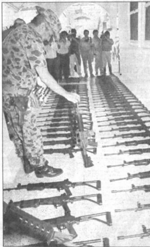
Armas del narcotráfico

Un militar inspecciona armas incautadas a narcotraficantes en Colombia. El "cábel de Medellín" entregó ayer al gobierno colombiano una tonelada de explosivos, como "expresión de paz". (Página 9).