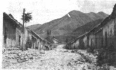
TARVITA La fotografía muestra una vista parcial del pueblo de Tarvita, cañón de la provincia Atacama, a unos 200 km. de la ciudad de Sucre. En "Los Tiempos buenos" de esta zona, según los pocos pobladores que quedan, había "mucho dinero", "se era así este desierto. Muchos se han marchado a las ciudades. Los niños y jóvenes, no tienen los recursos humanos y materiales suficientes para una educación acorde a las necesidades actuales, según revela un profesor de Tarvita.