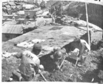
Trabajadores del retén de emergencia remueven escombros en donde se derrumbó una pared y mató a cuatro niños.

Funcionarios del departamento de Bienestar Social informaron que por instrucciones superiores, se dio la ayuda necesaria a la familia damnificada. Tendrán salón velatorio, ataúdes y coche fúnebre.