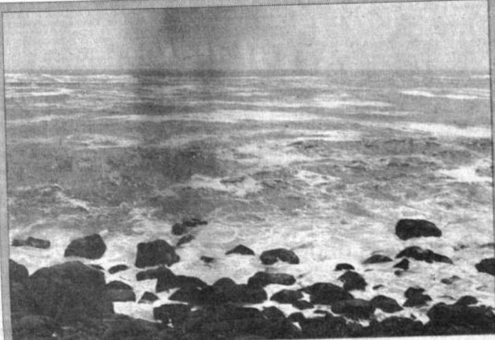
Océano Pacífico Parte de la costa del Océano Pacífico en territorio que ante de 1879 perteneciera a Bolivia. Nuestro país estudia la forma de lograr un acceso soberano al mar, tomando en cuenta las nuevas condiciones imperantes en el continente.

El canciller boliviano, Carlos Iturralde, durante una reciente conferencia de prensa, reiteró que el "objetivo nacional es el retorno al mar" y afirmó que