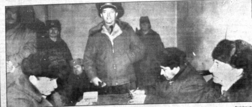
Retorna la normalidad de Bakú Negociadores armenios (izquierda) y azerbaijanos (derecha) discuten la retirada de sus combatientes, iniciada ayer, de la tensa zona fronteriza. Radio Moscú dijo que retornaba la normalidad a Bakú, capital de la República de Azerbaiyán. Según la agencia noticiosa TASS, tras la retirada, la seguridad quedará a cargo de las tropas soviéticas.

La marcha estudiantil, en la que también participaron representantes sindicales, salió de la Universidad de La Habana, recorrió la parte antigua de la ciudad y finalizó en el Parque Central.