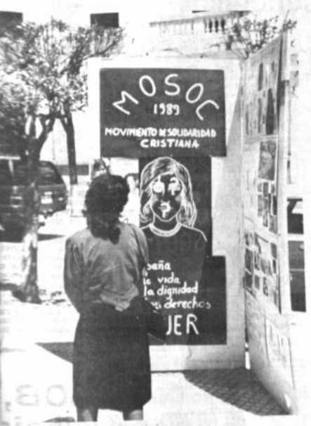
Comité de Solidaridad Cristiana (MOSOC) de la ciudad de Tarija organizó una campaña en favor de la dignidad de la mujer, mediante actos públicos. En esta campaña participaron numerosas instituciones sociales y cívicas.