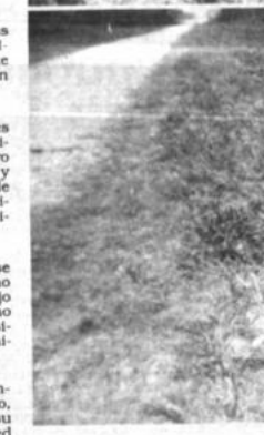
Mantenimiento de Caminos

Con el uso de técnicas apropiadas para la conservación de caminos, el país puede ahorrar ostensiblemente, aseguran expertos