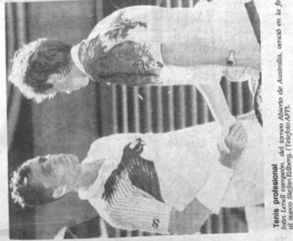
Tenis profesional El sueco Stefan Edberg, vencedor en la final del torneo Abierto de Australia, venció en la final al sueco Stefan Edberg. (Foto AFP).