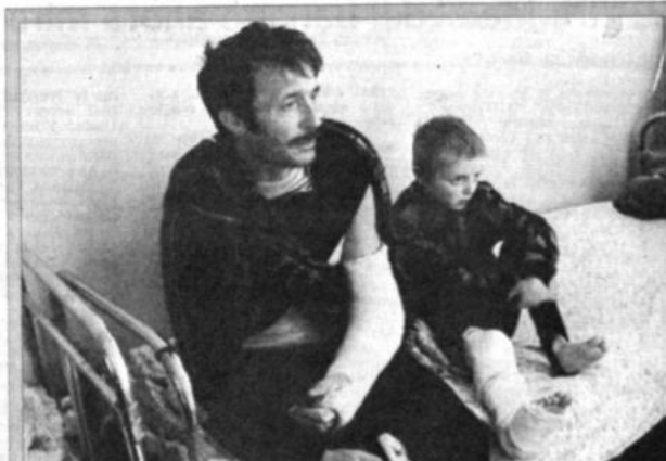
Victimas en la URSS

Según el informe oficial, los cuatro mandatarios definirán una estrategia común para enfrentar al narcotráfico en la región hemisférica y crearán los mecanismos de coordinación y seguimiento de las acciones antidroga que se realicen en cada país.