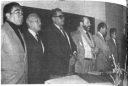
Ministro de Educación, Mariano Baptista, inauguró la reunión de directores departamentales de la educación urbana y rural.

Hizo referencia a la existencia de reformas educativas que se plantearon en los años 1964, 1969, 1983 y 1985 pero que no se