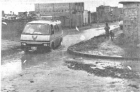
Producto de la lluvia persistente que se precipitó con intensidad ayer, las calles del sector norte de la ciudad de El Alto quedaron intransitables para los transeúntes y dificultoso para los vehículos. El crecimiento de las aguas del río Hernani, en las zonas de Ballivián y 16 de Julio, desvelaron a los vecinos quienes trabajaron hasta las primeras horas de ayer para evitar inundaciones.