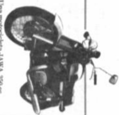
Una motocicleta JAWA, 350 cc. de TELASISTEMA BOLIVIANO

Un pasaje LA PAZ MIAMI LA PAZ de: LLOYD AEREO BOLIVIANO