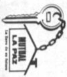
Un lote de terreno, 100 m 2 en urbanización "EL KENKO", con agua, luz y alcantarillado.