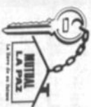
Un lote de terreno, 160 m 2 en urbanización "EL KENKO", con agua, luz y alcantarillado.