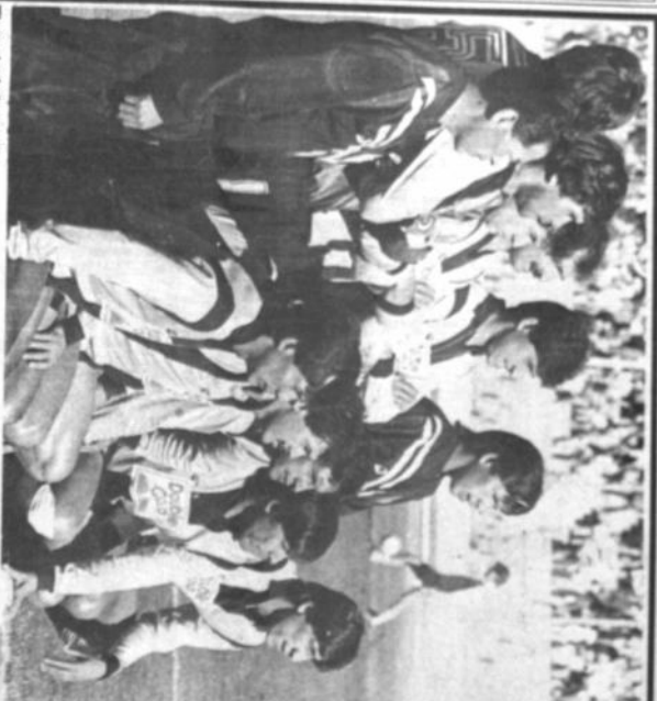
Tigre de Achumani Miembros de The Strangers que desde hoy se ubicarán a preparar su viaje al Ecuador y todo lo relativo a la venta de entradas.

El "Tigre" comienza a pensar en la copa Analizará esta noche propuesta para su viaje al Ecuador