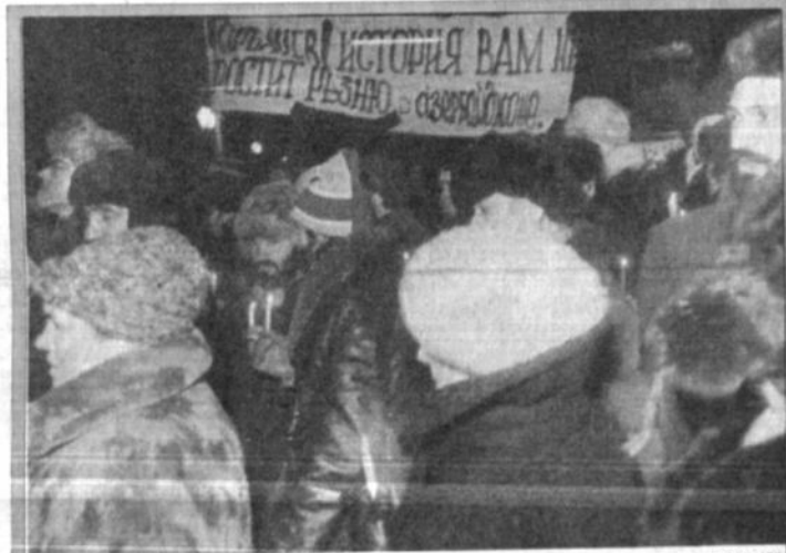
Tensión en la URSS Manifestantes armenios llevan una pancarta en la que se lee: "Gorbachov, la historia no te olvidará por la masacre de Armenia". La protesta se realizó ayer mientras se celebraban los enfrentamientos étnicos entre las repúblicas soviéticas de Armenia (católica) y Azerbaiján (musulmana).