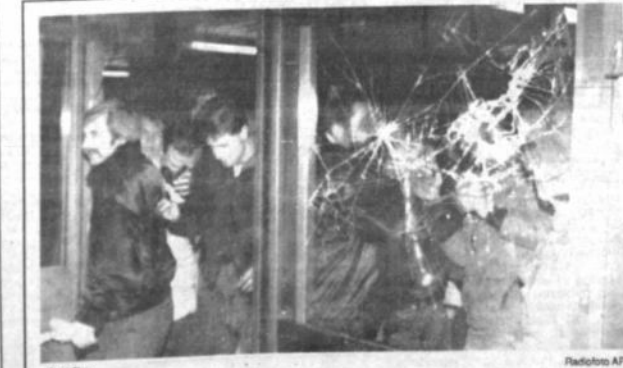
Asalto Millares de manifestantes berlineses atacaron ayer el cuartel general de la Policía Secreta de Alemania Oriental, arrojando muebles y papeles por las ventanas.