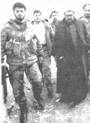
Camino a una manifestación. El líder espiritual Sheikh Subhi Tufayli (segundo a la derecha) rodeado de sus guardas-palidas camina hacia una manifestación preparada por los guerrilleros pro-iraníes para protestar por el conflicto Irán-Shiita.

Si, embargo, sus afirmaciones, según los comentaristas, promoverán las presiones de los círculos ultranacionalistas que exigen la anexión de Cisjordania y Gaza.