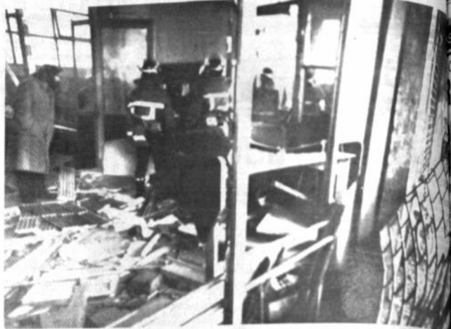
Asalto a una oficina postal Estado en que quedó la oficina postal de un suburbio de Bolonia al estallar prematuramente un paquete colocado por ladrones que trataban de abrir la caja de seguridad, hiriendo a por lo menos tres personas (Bolonia, Italia, Radiofoto AP).

El Kremlin envió a la región refuerzos de tropas de seguridad interna, después de que se informó que las autoridades habían perdido el control en partes de Azerbaiján, donde la mayor parte de las víctimas fueron armenios atacados por turbas de azerbaiyanos en Bakú, la capital. Se informó también que muchos armenios emprendieron la huida. La agencia oficial TASS dijo que algunos azerbaiyanos iban armados con ametralladoras y, en una región, fueron tomados como rehenes dirigentes comunistas y gubernamentales. La radio soviética dijo que fueron enviados a Bakú altos funcionarios expertos en mediación, para poner fin a los ataques fatales que se iniciaron el sábado a la noche y continuaron ayer, y a Eriván, capital de la vecina República de Armenia. Armenia está preparada para el combate", dijo un activista armenio, Karen Shakhnabazyan, en una conversación telefónica desde Eriván.