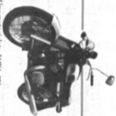
Una motocicleta JAWA, 350 cc. de TEL. SINDICATA BOLIVIANA

Un pasaje LA PAZ MIAMI LA PAZ de: LLOYD AEREO BOLIVIANO