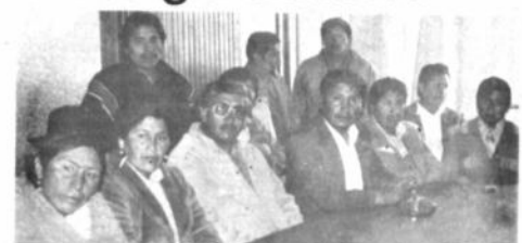
Dirigentes de FEJUVE anunciaron que COBEE no cumplió el cronograma de instalación de energía eléctrica en 35 villas de El Alto.

En cuanto a la instalación de los medidores, de los nueve que anunció COBEE sólo se coloca-