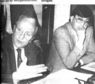
Ferdinand Imposimato, experto del Fondo de las Naciones Unidas para la Fiscalización contra el uso indebido de drogas.

Agregó que el experto visitará los juzgados especiales de Santa Cruz y La Paz, y visitará al presidente de la Corte Suprema de Justicia, Edgar Obillas, para analizar los resultados obtenidos en la administración de justicia, por delitos vinculados con las drogas.