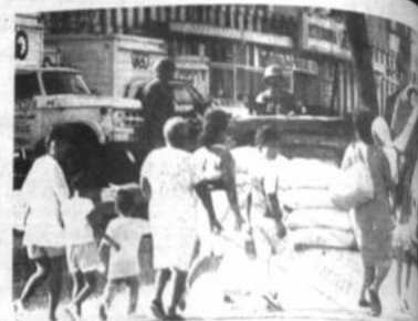
La Paz, Bolivia. Jueves 11 de enero de 1990.