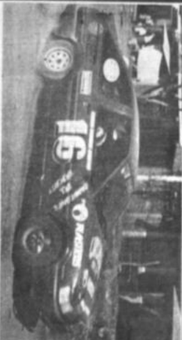
Doble Copacabana Los días 3 y 4 de febrero se disputará la prueba "Doble Copacabana" en homenaje al 37 aniversario de la Asociación de Automovilismo de La Paz.

Consejo superior se reúne esta noche en Cochabamba