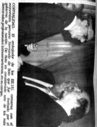
CORRALMAYO. El embajador de los EE.UU. condecora con el primer premio Hernando de Soto que fue invitado por el gobierno de la Paz de Saco es considerado uno de los más destacados proyectos latinoamericanos, en su campo.