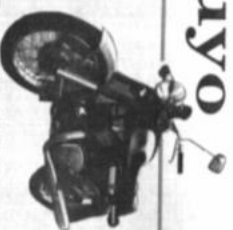
Una motocicleta JAWA, 350 cc. de TELESISTEMA BOLIVIANO

Un pasaje LA PAZ MIAMI LA PAZ de: LLOYD AEREO BOLIVIANO