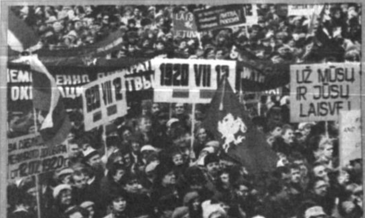
Manifestación Unas 15.000 personas se concentraron ayer en el centro de la capital de Lituania - a donde llegará hoy Gorbachov -, durante una manifestación llamada "determinación hacia la independencia". La foto fue divulgada por la agencia oficial TASS de la URSS.