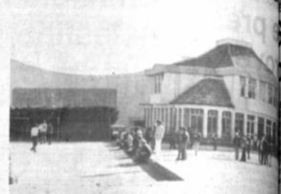
La alcaldía de El Alto permanece inactiva, en razón a que no se ha designado al nuevo burgomaestre.

La Corte Departamental Electoral, según Espinoza, pasó un informe donde aclara que CONDEPA no tiene un octavo concejal. "El conflicto está en la Corte Nacional, porque hay un documento escrito", dijo.