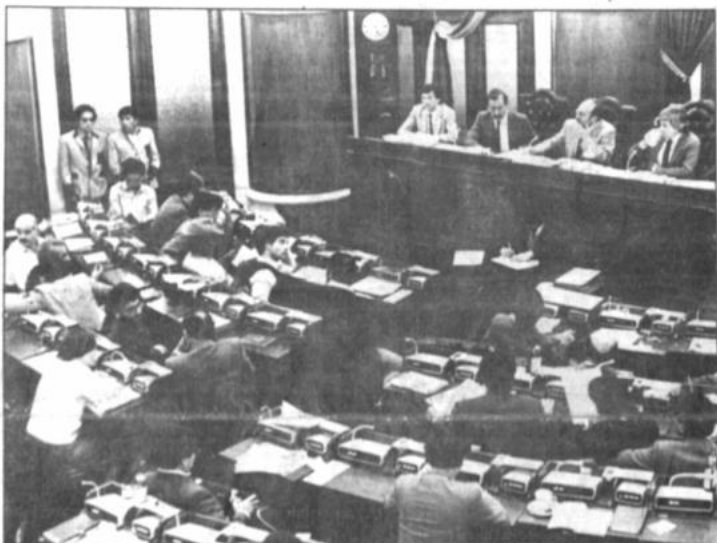
Sesión de Congreso

Pide que se efectúen "consultas urgentes" para la constitución de una Organización de Estados Latinoamericanos, sin la "injerencia de una potencia agresiva e irrespetuosa de los elementales principios de convivencia pacífica entre los pueblos".