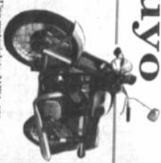
Una motocicleta JAWA, 350 cc de TELEFONOS BOLIVIANOS