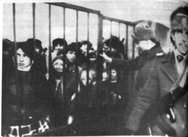
Montando guardia. Soldados rumanos montan guardia ante la puerta de una iglesia Católica, en Bucarest, para el ingreso desordenado de ciudadanos para recibir víveres y vestimentas, aunque luego se les entregó en pequeños grupos para entregarles tales suministros (Bucarest, Radiografía AP).

Los compromisos de seguros han reventado también a su consecuencia de las cuantiosas pérdidas sufridas por las compañías, alegando que fueron provocadas por una situación de guerra.