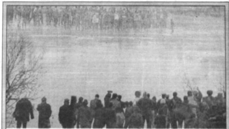
Tensión en la URSS

Mosquera Chaux había sido mencionado como posible sucesor de Londoño Paredes.