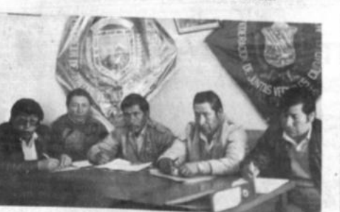
Dirigentes de FEJUVE analizando los problemas surgidos a consecuencia de que hasta la fecha no se nombran nuevas autoridades.

Finalmente, la Federación de Juntas Vecinales de El Alto se declara en estado de alerta, y anuncia que tomará medidas de hecho en el plazo de 48 horas, a partir de ayer, no se solucionan los problemas que está ocasionando el nombramiento de las nuevas autoridades de El Alto.