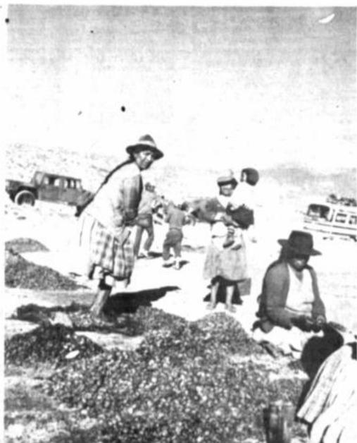
Producción de chuño

Por su parte, el secretario ejecutivo de la Central Obrera