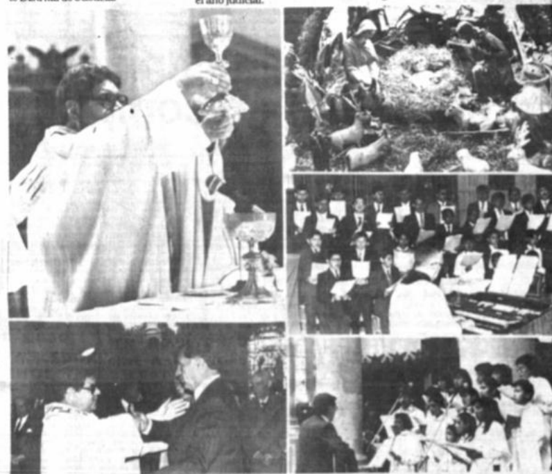
Misa de fin de año

El concejo pazeño está compuesto por cinco municipios del acuerdo ADN-MIR, cinco de CONDEPA, dos del MNR y uno de UCS, quienes deberán elegir a la primera autoridad ejecutiva del gobierno comunal.