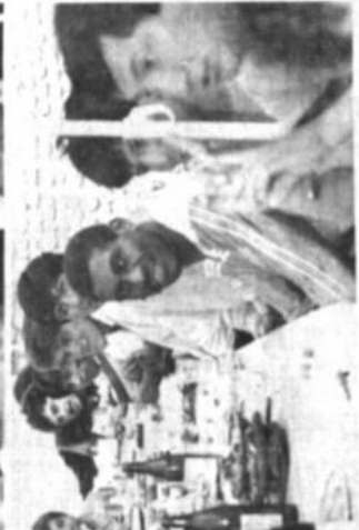
Felicitados "Tigre" Todos los jugadores y parte del cuerpo técnico se reunieron ayer en un restaurant de la ciudad para desearse mutuamente los mejores deseos por el año nuevo. Los futbolistas completaron la diferencia de sus dirigentes y se reunieron en un breve tiempo de su descanso para esa reunión de camaradería.