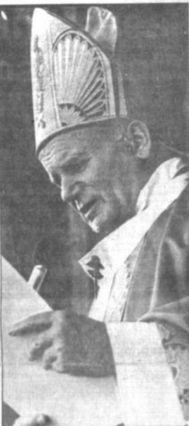
Jornada de la paz S.S. Juan Pablo II en mensaje emitido por la Jornada Mundial de la paz, cuyo lema, este año, es "Paz con Dios creador, paz con toda la creación; recordo que la tierra es herencia de todos y que debe beneficiar también a todos."

En un mundo plagado de injusticias, de diferencias de reinos, de violación a los derechos humanos, la Iglesia vuelve a hacer sentir su voz, afirmando con pleno convencimiento que la paz es posible.