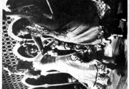
BAILES ESPAÑOLES, siempre actuales y favoritos que estimulan la danza española.