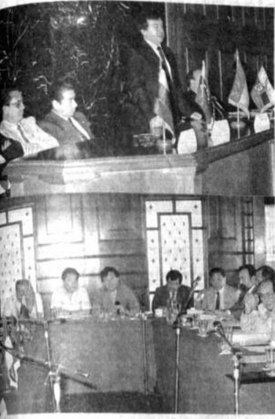
El presidente de la Comisión VII del Parlamento Andino se encuentra con los miembros de la Comisión VII del Parlamento Andino en la ciudad de Cochabamba y en un momento de la reunión.