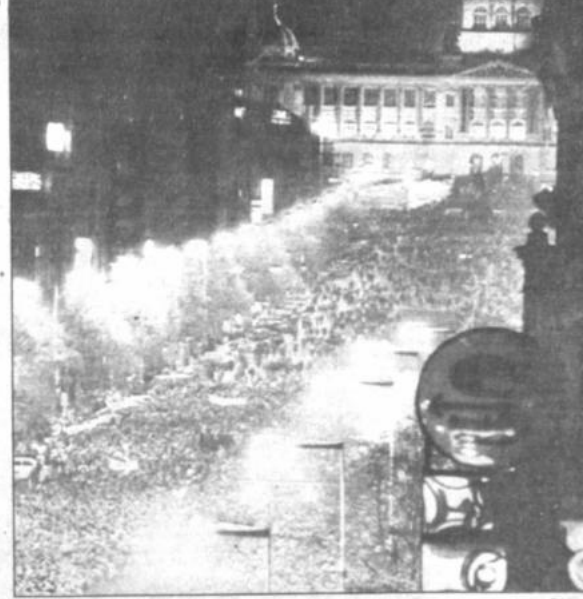
Gigante manifestación en Praga

Expertos económicos sostienen que la elevada cotización de la divisa norteamericana podrá finalmente influir sobre los precios de los distintos productos y hacer fracasar la lucha del gobierno contra la inflación.