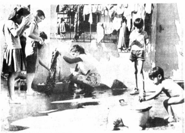
Refugiados Mujeres toman agua y lavan sus ropas mientras una niña se baña en un refugio al norte de la capital salvadoreña. Miles de civiles han abandonado sus hogares huyendo de los combates entre el Ejército y la guerrilla del FMLN (San Salvador, El Salvador).

LA PAZ, 20 (AP). Veintitrés personas y otros 23 resultaron heridos en un accidente de un autobús que chocó con un muro de 10 metros cuando regresaba del centro turístico de La Cruz, localidad a 10 kilómetros al oriente de esta ciudad. Los policías y voluntarios de la Cruz Roja, durante el rescate, sacaron los cadáveres de los heridos y los trasladaron al hospital. Se dijo que entre las víctimas había un niño de 10 años y un adulto. Se informó del número de muertos y heridos en un accidente de autobús.