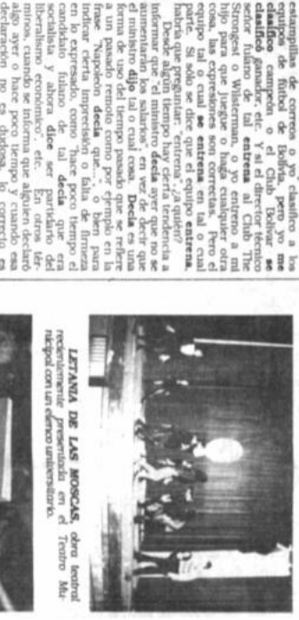
LETAÑA DE LAS MOSCAS, obra montada recientemente en el Teatro Municipal de Cochabamba.