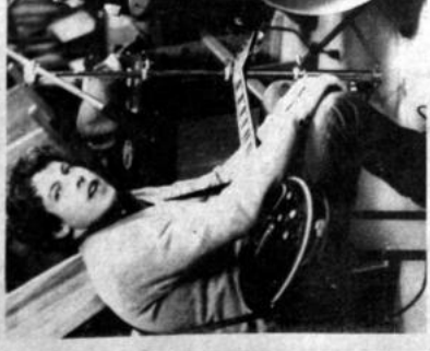
ANDREY MAKAREVICH, director del concierto "Mashina Vremeni" que causó sensación en la juventud soviética.

Desde que el jazz empezó a difundirse a todo el mundo, no tardaron en aparecer músicos que sugirieron la fusión de los dos mundos influidos por el jazz los músicos mezclaban su folclore y creaban música con distintas clases de ritmos y melodías dependiendo siempre del lugar donde se daban estos cambios y acrecentando así la expansión del jazz.