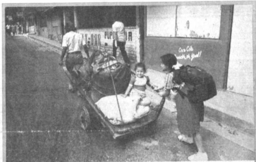
El drama salvadoreño

Una familia retorna a su hogar, después de haber estado refugiada en otro sitio de la ciudad de San Salvador, a consecuencia de la lucha entre guerrilleros del FMLN con efectivos militares. Millares de personas dejaron sus hogares, mientras se producía el enfrentamiento que dejó centenares de muertos. (Más información página 9).