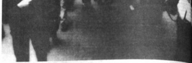
Marcha de protesta

El debate se abrirá con la discusión de cómo reorientar la ayuda en la década de los años noventa. El parlamento europeo ya se pronunció en el pasado sobre ese problema de rivalidad entre los dos continentes y propuso una repartición del 65 y 35 por ciento a favor de Asia.