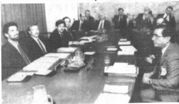
Conversaciones de paz. Las delegaciones de los llamados "Contras", a la derecha, encabezados por el Col. Enrique Bermúdez y de los representantes del gobierno de Nicaragua, encabezados por Víctor Hugo Tinoco, Izquierda, se reúnen en una mesa de conferencias que encabeza el Secretario General de las Naciones Unidas, Javier Pérez de Cuellar.