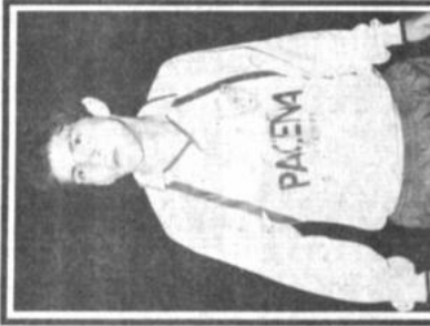
Milton Melgar Será de la partida mañana frente al club San José de Oruro en el inicio de la segunda rueda del torneo "Jorge Carrasco V".

UCB campeón de volibol masculino Dio anoche la vuelta olímpica