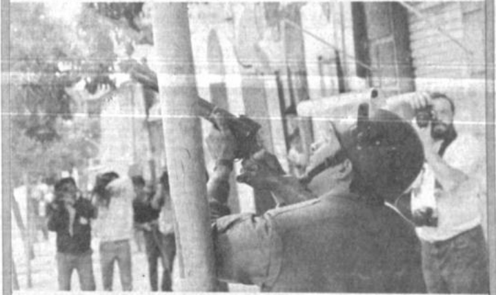
Conflicto El ministro de Educación, Mariano Baptista, visitó anoche al primer piquete de huelguistas de hambre del magisterio, a quienes anunció la disposición gubernamental a dialogar "sin condiciones". En la fotografía inferior, un policía dispara gases lacrimógenos hacia la Universidad paceña, durante los enfrentamientos producidos al mediodía de ayer.