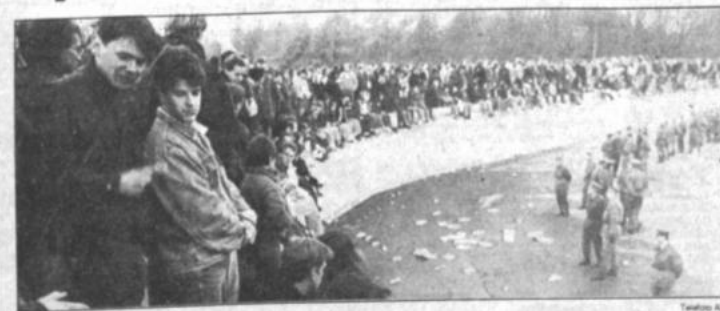
Muro ocupado Millares de jóvenes subieron ayer al Muro de Berlín, al proseguir los festejos por la apertura de la frontera entre las dos alemanías.

BERLIN, 10 DE NOVIEMBRE (DPA). Tras la histórica apertura anoche del muro de Berlín, en ambos estados alemanes se hicieron hoy llamados para que en la República Democrática Alemana (RDA) se celebren elecciones libres.