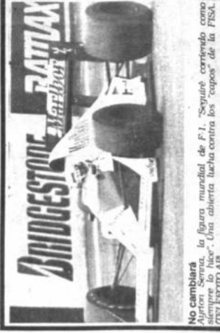
No cambiará Aunque Senna, la figura mundial de F.I., "Seguiré corriendo como siempre lo hice". Una abierta lucha contra los "capos" de la FISA.