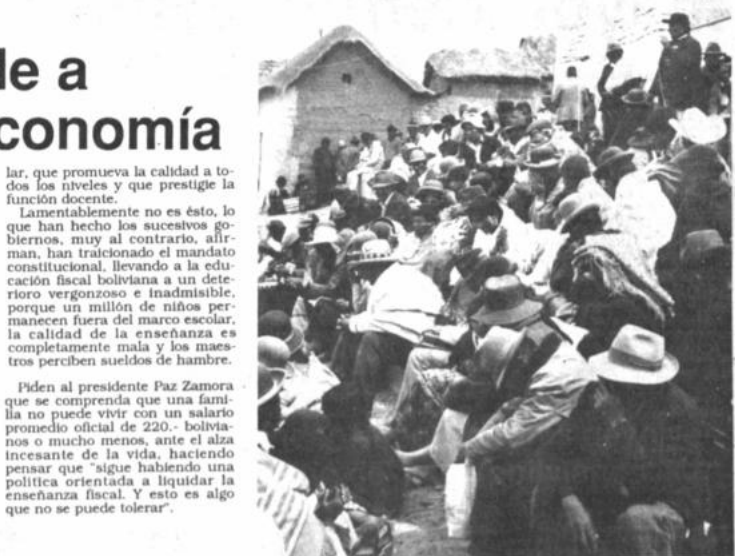
XX encuentro Diocesano de comunidades Eclesiales de Base del campo y las minas del departamento de Oruro, que se realizó en San Pedro de Totora, el pasado mes de octubre, con la presencia de aproximadamente 800 campesinos, fructificó la de católica y se resaltó la reflexión espiritual, en la búsqueda de una Iglesia identificada con la problemática y valores culturales andinos y aymaras.

Las tradicionales comidas de Todos Santos, como el Mondongo, fueron frías para un gran porcentaje de los asaltados que aún no cobró el sueldo del mes, excepto naturalmente para los "campesinos" parlamentarios, anotó uno de los comentaristas radiales escuchados hoy aquí.