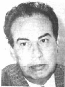
Guillermo Fortún, ministro sin Cartera

Fortún, quien las conversaciones con las diferentes fuerzas políticas aún están en fase de negociación, dijo que el acuerdo se llegará con todos los sectores que han logrado una significativa presencia en los concejos municipales.