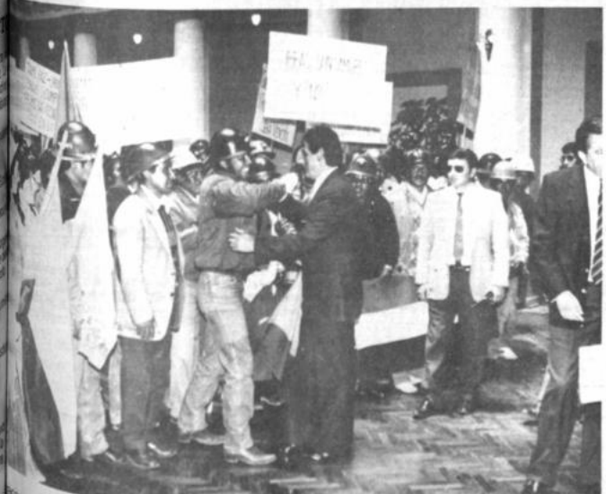
Expresión de los trabajadores localizados en son de agradecimiento al Lic. Jaime Paz Zamora, Presidente del Gobierno de Unidad Nacional.