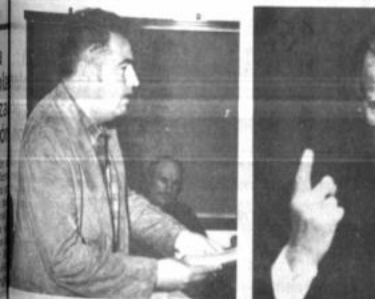
George Bush, presidente de EE.UU.

El presidente Bush, reiteró su política de "mano dura" contra los traficantes de drogas, con los presidentes de Colombia, Virgilio Barco, y de Venezuela, Carlos Andrés Pérez, que se celebrará el próximo año en Cartagena de Indias. Según fuentes oficiales, Bush destacó el respaldo a Barco, para el que tuvo una lucha abierta contra los narcotraficantes.