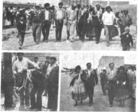
En medio de un repogto general de los pobladores, fue inaugurado el sábado el servicio de energía eléctrica en la zona de Romero Pampa.

Denunciaron el caso a la alcaldía, que decidió paralizar los trabajos de amurallamiento mientras se dirima el mejor derecho propietario del manzano. Informaron que el Concejo Municipal emitirá una ordenanza para la expropiación de ese terreno.