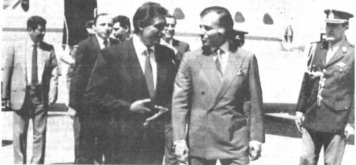
Jaime Paz Zamora y Carlos Saúl Menem en el aeropuerto militar de Buenos Aires.

El presidente argentino dijo que el tema del narcotráfico está incluido en sus conversaciones con Paz Zamora, porque se trata de "uno de los más graves" problemas que enfrenta actualmente el mundo entero.