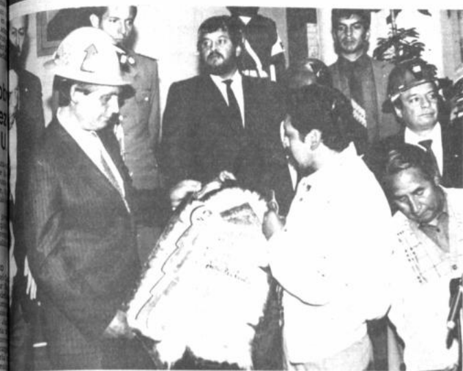
Adhesión de los trabajadores mineros a la política de localización del Gobierno de Unidad