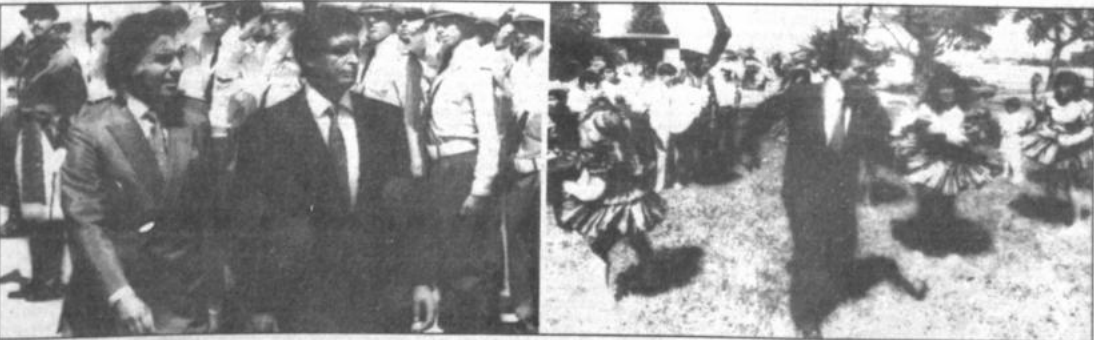
Paz Zamora en Buenos Aires

Desde San Salvador se informó que el FMLN rechazó hoy "con indignación" la Declaración de los presidentes, porque "no contribuyó a las posibilidades de una solución negociada". Según la guerrilla, los gobernantes centroamericanos le dan "un respaldo incondicional al principal violador de los Derechos Humanos de la región, un gobierno que ha asesinado y perseguido a religiosos, y bombardeado a la población civil".