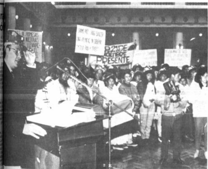
Ministro de Minería y Metalurgia, Ing. Walter Soriano Lea Plaza, da a conocer la política de ocupación y organización de cooperativas: ocupación, producción, aumento económico y minero y metalúrgico.