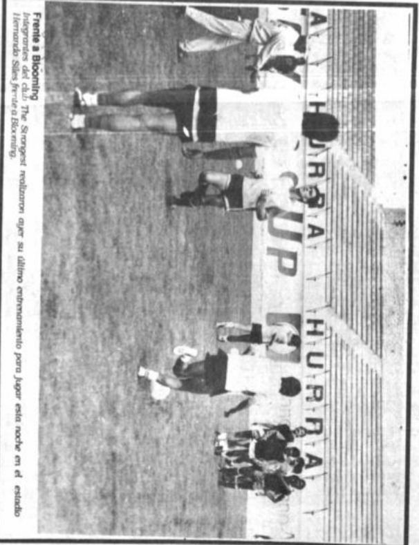
Frente a Blooming integrantes del club The Strongest molieron ager su último entrenamiento para jugar esta noche en el estadio Hernando Siles frente a Blooming.

Plantel cruceño superó a último momento problema económico.- El partido comenzará a horas 20:00