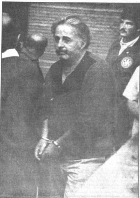
Arce Gómez, en Miami

Luis Arce Gómez, a quien no se había vuelto a fotografiar en los últimos seis años, aparece cuando ayer comparecía ante un juez de Miami, esposado. El ex hombre fuerte de García Meza quedó detenido sin derecho a fianza y volverá a comparecer ante una corte el próximo martes 26 de diciembre.